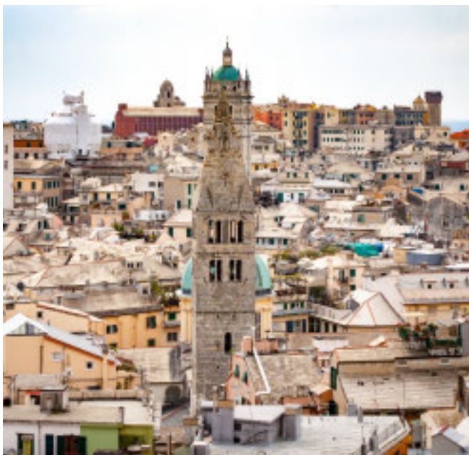
GENOVA Una splendida vista del suo panorama

Con Lonely Planet tre giorni di eventi legati all'«Elogio della fuga»