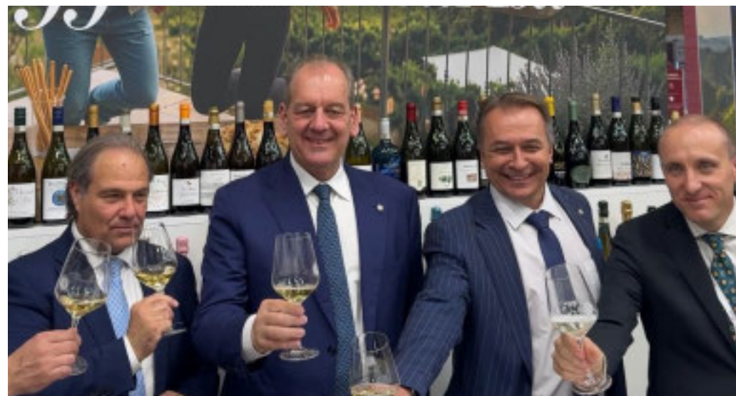
Inaugurata l'Area Piemonte, da oltre 700 metri quadrati

«La misura rappresenta un pilastro delle politiche per la montagna - sottolinea l'as-