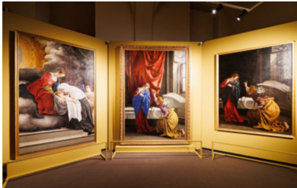
Due progetti distinti, ma uniti da un unico filo conduttore

L'esposizione dedicata a Orazio Gentileschi, curata da Annamaria Bava e Gelsomina Spione e realizzata in collaborazione con Arthemisia,