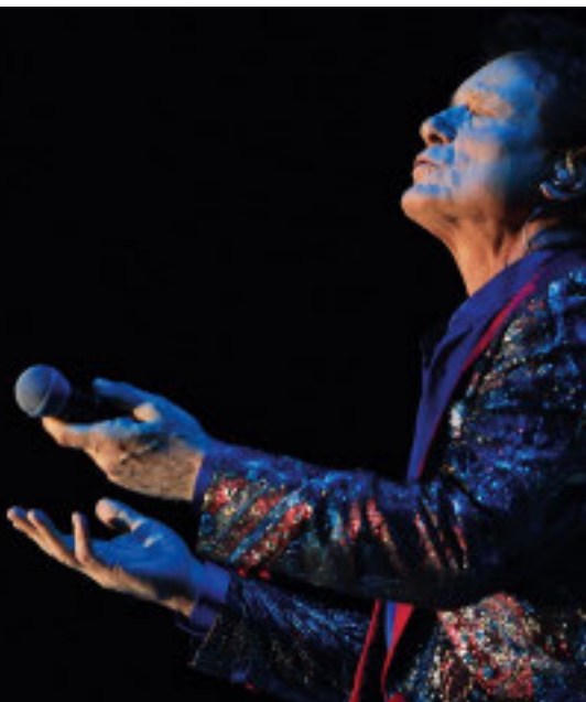
Massimo Ranieri, inimitabile lo stile di un'icona della musica italiana

Massimo Ranieri arriva a Genova in concerto il 10 e l'11 gennaio