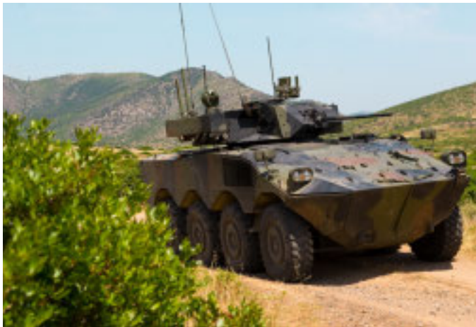
Un nuovo VBM Plus equipaggiato da Leonardo

Gli aggiornamenti introdotti hanno riguardato principalmente l'upgrade del sistema di tiro, da parte di Leonardo, con l'introduzione di componentistica elettronica di ultima generazione confor-