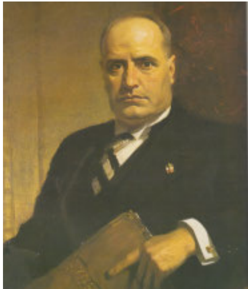
Ritratto a olio di Benito Mussolini, dipinto da Franck O. Salisbury (1927). Il duce, col distintivo del PNF, tiene in mano una carpetta intitolata "Governo"

roce, senza quartiere, proiettata nel tempo sino al completo esaurimento delle risorse dello Stato, verso una pace che coincideva con la disfatta della propria civiltà, come appunto avvenne sulla fine del 1918 quando i vinti caddero per fame e ormai incalzava l'epidemia di febbre spagnola, vincitrice suprema su tutti. Da lì arrivava la divaricazione fra la dirigenza politica d'anteguerra, usa a ritmi ormai arcaici, e il Paese che esigeva immediate e profonde riforme. Non solo diritto di voto per tutti (donne comprese), ma riconoscimento del contributo dato alla Vittoria, da tradursi immediatamente in trattamento economico e condizioni sociali "da vincitori". "Terra ai contadini" e compartecipazione alla proprietà delle fabbriche o almeno della loro direzione e degli utili furono rivendicazioni ricorrenti in tutta Europa. Quella svolta epocale fu subito chiara agli scrittori nati in trincea, come Giuseppe Ungaretti, o a quanti descrissero la biblica "fornace ardente" dei combattimenti e i suoi riflessi permanenti sulla psiche dei milioni di sopravvissuti. Scurati, invece, stigmatizzò Mussolini, uno dei tanti. Uno che tuttavia, piaccia o meno, dalla primavera del 1919 si fece portavoce e interprete della necessità di una svolta radicale.