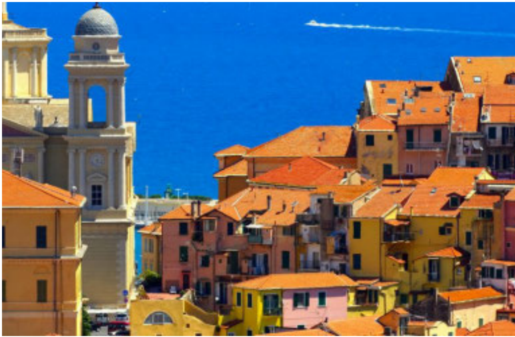
Seconde case e case vacanza trainano il turismo in tutta la regione