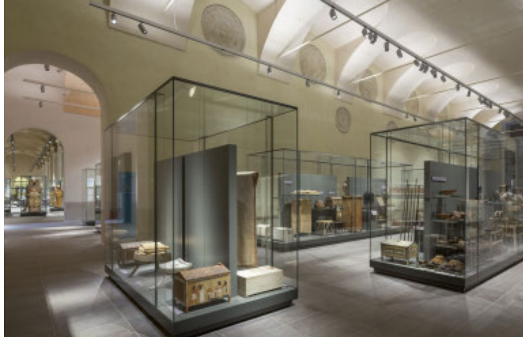
Bene anche i canali social. Sono 484.394 i follower totali dei social del Museo

Un bicentenario oltre le aspettative per l'istituzione culturale, grazie ai ri-allestimenti e ai tanti eventi