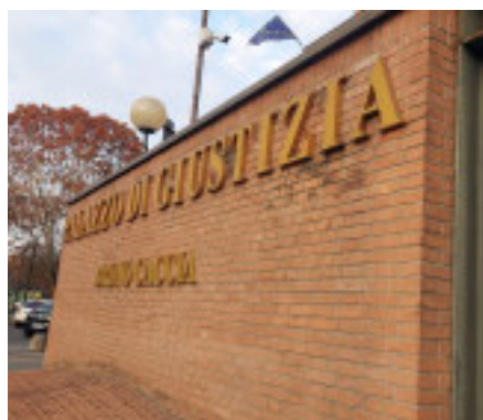
Il Tribunale di Torino

L'imputato è stato chiamato comunque a rispondere solo dei danni patiti da un unico apparato, e anche