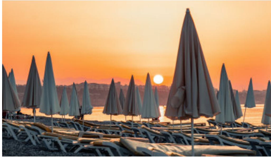
Tempi duri per i concessionari balneari che devono fare i conti con l'Europa