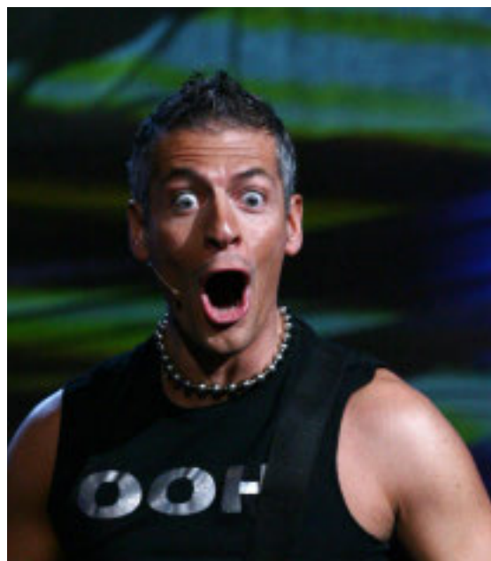
Giovanni Vernia, Luca Barbarossa e Dario Ballantini sono tre dei quattro protagonisti delle serate estive al Casinò

Dalla comicità alla musica d'autore. Sabato 19 luglio alto gala di lusso con Luca Barbarossa, cantautore, interprete, conduttore televisivo tra i più apprezzati, che può vantare cinque presenze al Festival di Sanremo. All'Ariston aveva vinto l'edizione