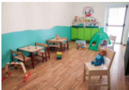
Una delle stanze arredate per gli incontri

■ Oltre 500 minori e 400 famiglie coinvolte, migliaia di ore di attività educativa in carcere, nelle scuole e sul territorio: sono i numeri de «La Semina dei Sogni: l'infanzia tra carcere, scuola e comunità», un progetto selezionato da «Con i Bambini» nell'ambito del Fondo per il contrasto della povertà educativa minorile che è partito in Liguria con un intervento strutturato per i prossimi quattro anni. L'avvio del progetto è stato presentato durante il Seminario «Figli e genitori oltre la detenzione», alla Biblioteca Universitaria di Genova. Il nuovo progetto, coordinato dalla Cooperativa Sociale Il Cerchio delle Relazioni, si svilupperà in tre città liguri grazie al supporto della Regione e all'adesione della Casa circondariale di Genova Marassi, la Casa circondariale di Genova Pontedecimo, la Casa di reclusione Chiavari e la Casa circondariale di Sanremo ol-