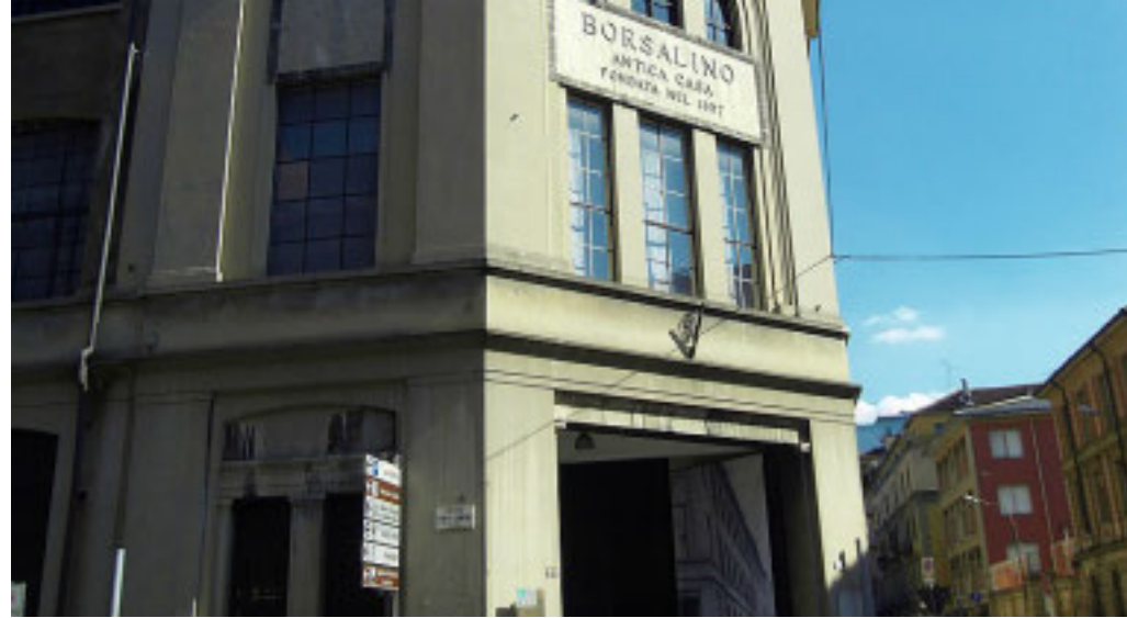
Sede dell'Università Piemonte Orientale ad Alessandria

L'iniziativa si svolgerà giovedì 22 maggio presso il Dipartimento di Scienze e Innovazione tecnologica