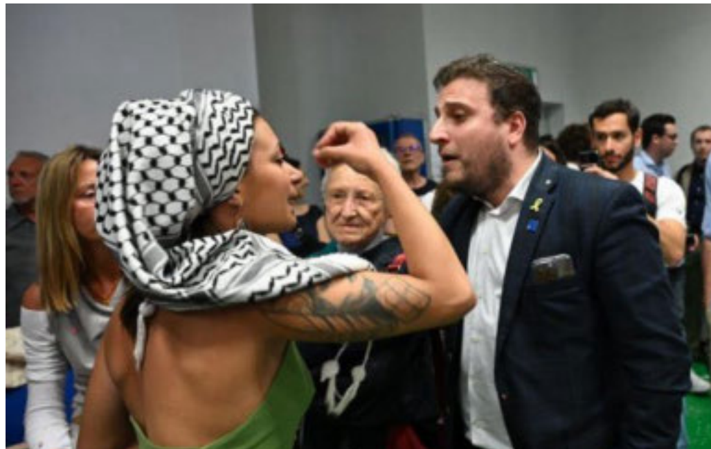
Tensioni al Campus Einaudi e al Salone del Libro, dove è stato impedito dibattito con comunità ebraica

Durissima la reazione di Forza Italia: «La Sinistra alleva in casa nuova generazione di antisemiti»