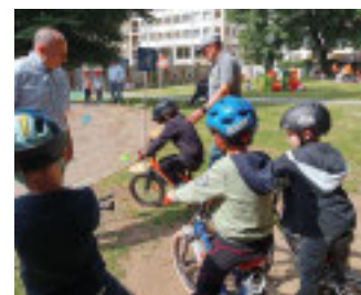
Un momento della mattinata

■ Piccolissime ruote crescono a Novara presso la Fondazione scuole d'infanzia. Si è svolta nei giorni scorsi, a cura della Commissione di educazione stradale della Federazione italiana motociclistica, l'attività di educazione stradale appunto, destinata ai bambini del plesso scolastico "Negroni" e "San Lorenzo". L'evento si è