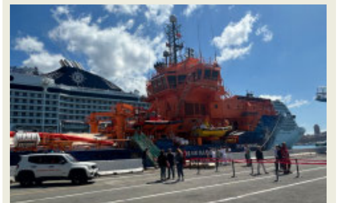
La nave attraccata in porto a Genova