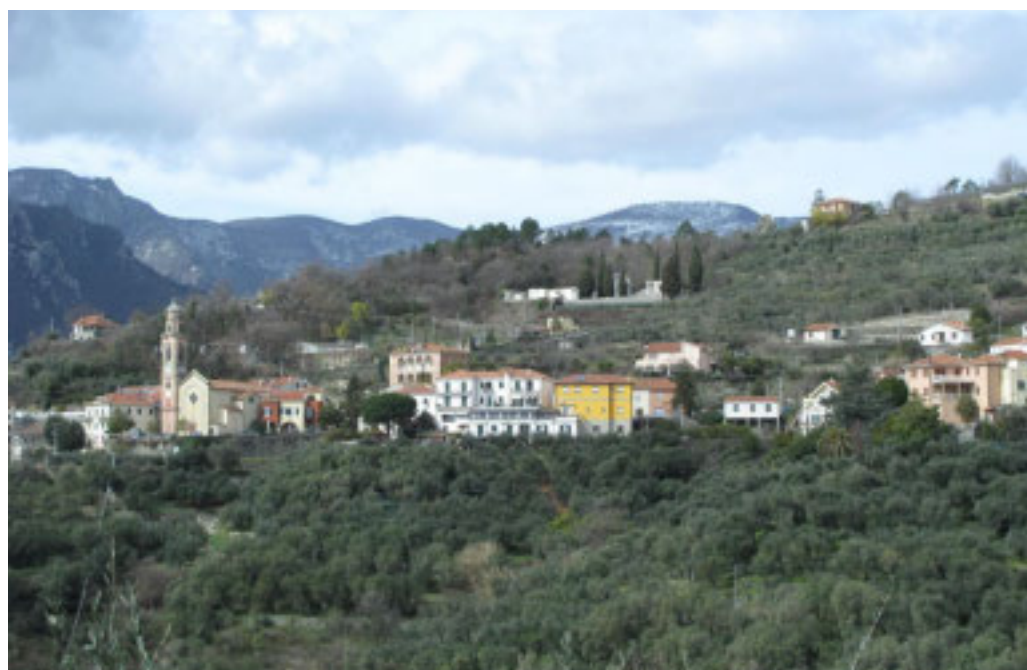
A Bardino nuovo la tavola rotonda promossa in collaborazione col Gal Valli Savonesi

simo esperienziale che vada oltre la semplice visita, incentivare la nascita di nuove imprese e di forme di lavoro agili: queste sono solo alcune delle leve da attivare. L'incontro di sabato si configura quindi come un momento di seminale importanza per seminare le idee di un futuro più rigoglioso e resiliente per l'entroterra. Un futuro in cui la sua identità peculiare non sia un freno, ma un potente magnete per attrarre nuove energie e nuove opportunità. Un futuro da plasmare insieme, con la partecipazione attiva di chi vive e lavora in questi luoghi, con il sostegno convinto delle istituzioni e con la visione di un territorio che sa guardare avanti.