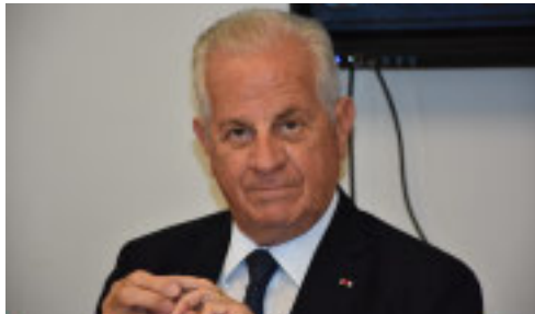
Il presidente della Provincia Claudio Scajola

■ «Contestiamo la sottrazione delle risorse finanziarie: è a rischio la sicurezza dei cittadini. Vogliamo l'apertura immediata di un tavolo di crisi con il ministro Salvini e che si proceda a ritrovare subito i 385 milioni di fondi sottratti per il 2025 e il 2026». Il presidente della Provincia di Imperia Claudio Scajola è fortemente preoccupato e chiede un tavolo di confronto con il ministro Salvini per la decurtazione di fondi imposta dalla legge di Bilancio e dal Decreto Milleproroghe. Secondo Scajola la sicurezza delle strade provinciali è messa a rischio dai tagli ai programmi di investimento, che erano stati assegnati alle Province. «Sulle strade provinciali si è abbattuto un taglio di 1,7 miliardi, risorse già assegnate a Province e città metropolitane e destinate agli investimenti per la messa in sicurezza e l'efficientamento di 120 mila chilometri di vie che collegano il Paese - ha aggiunto -. Molto grave poi