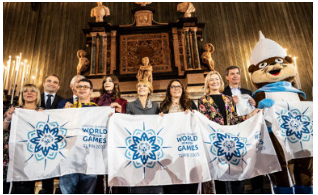
La presentazione della manifestazione al Palazzo Reale di Torino

rappresentano un importante riconoscimento per Special Olympics Italia, che da oltre 40 anni è in prima linea nel cambiamento di mentalità riguardo al potere dello sport nel pro-