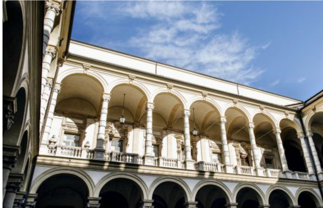
Nuovi servizi per chi frequenta l'ateneo o ci lavora

L'ateneo torinese è il primo in Italia ad attivare 4 Sportelli anti-violenza