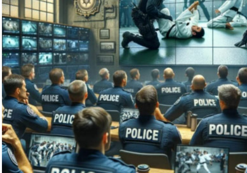
SUPER COP I poliziotti americani ai corsi di tecniche di difesa

Il sindacato Siulp organizza un addestramento sulla base delle tecniche usate in strada a New York e dai Rangers