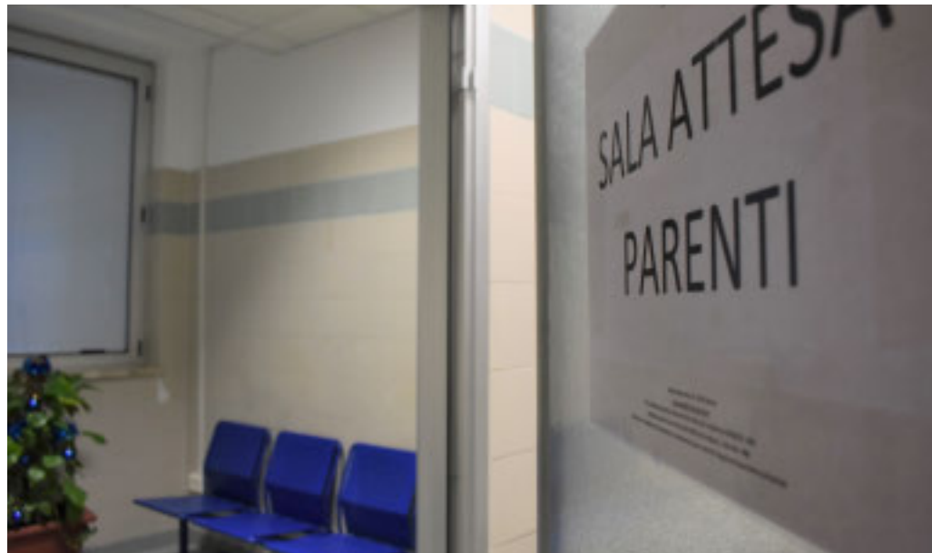
Chi ha un caro ricoverato al pronto soccorso ha bisogno di avere notizie

«Ps-Tracker» è il nuovo sistema di Liguria Digitale per dare informazioni ai congiunti e smorzare le tensioni