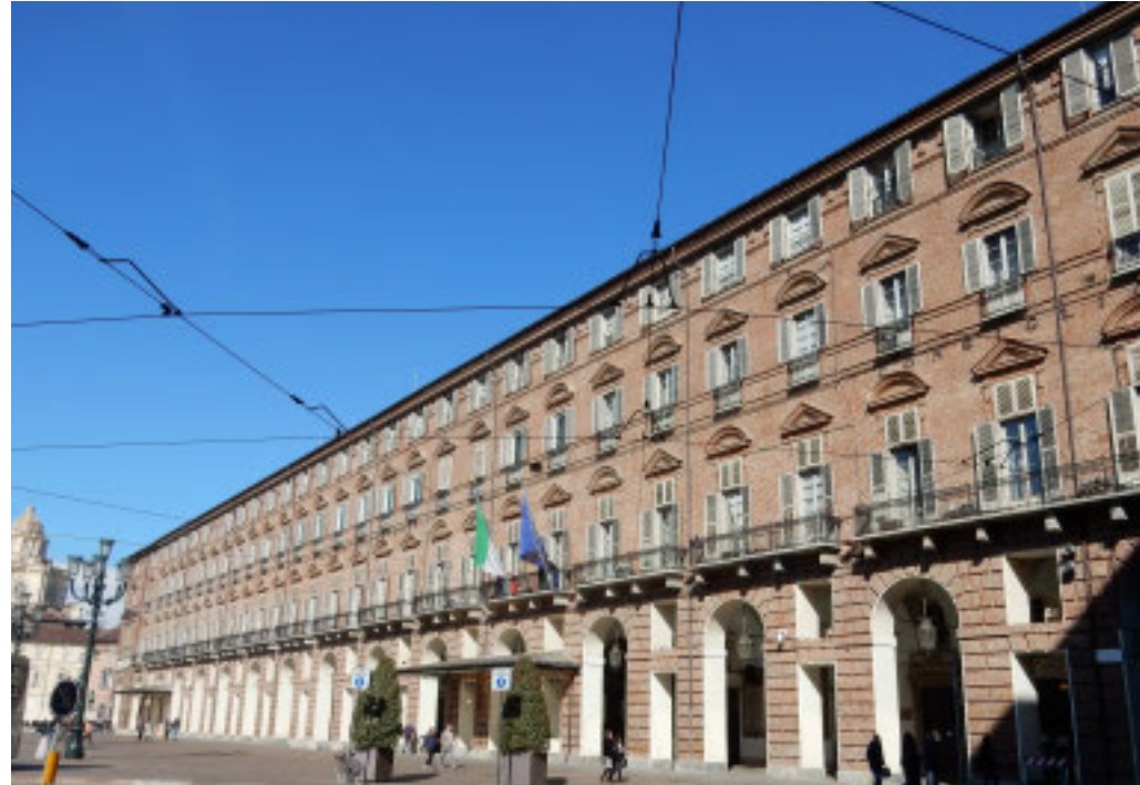
Il Palazzo del Governo in piazza Castello a Torino

Per Forza Italia è l'ennesima «pezza», che rischia solamente di spostare i problemi in altri quartieri