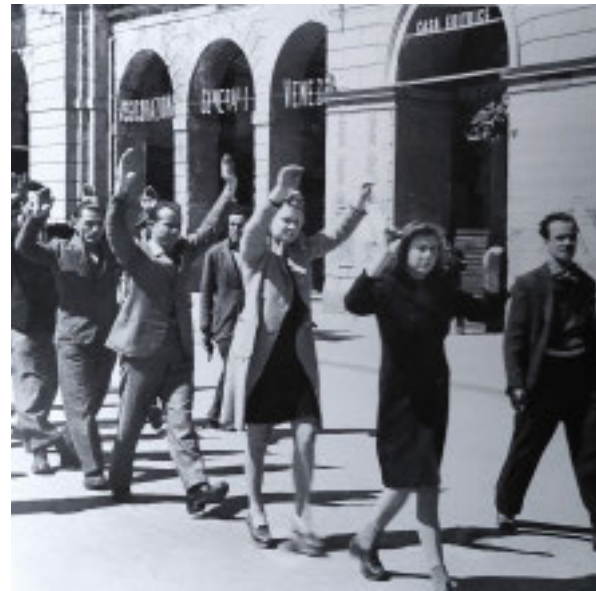
Cuneo, Piazza Vittorio Emanuele II, dopo il 25 Aprile: donne accusate di "collaborazionismo" vengono condotte in giudizio