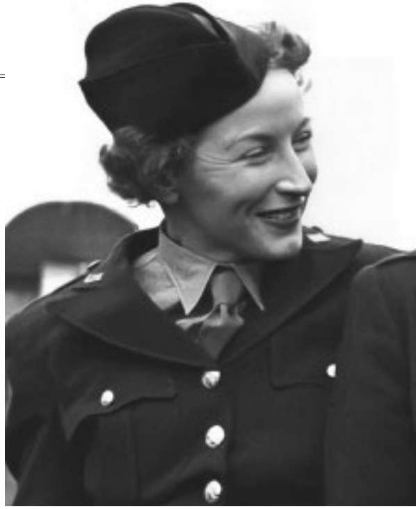
Milano, negli stessi momenti: anche le ragazze del corpo di ballo della "Gazzetta del sorriso" subiscono la stessa sorte della soubrette, esposte al ludibrio della folla e sotto custodia di partigiani armati