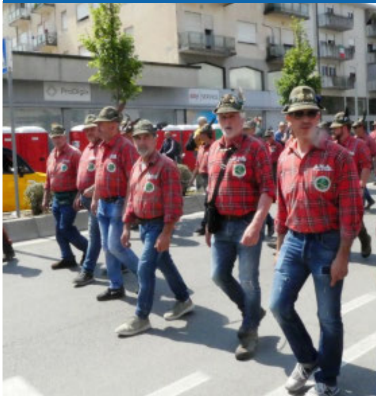
Servizio a pag. 3