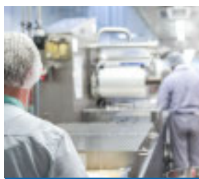
SERVIZIO A PAG. 21