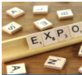
RAVASIO A PAG. 22