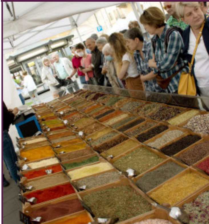
Servizi alle pagine 12 e 13