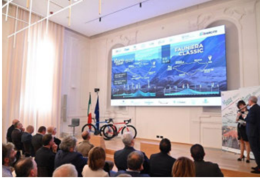
Un momento dell'evento di presentazione.

Indossata obbligatoriamente in gara, la maglia, "ambasciatrice di Cuneo", viene portata con orgoglio dai ciclisti durante tutto l'anno, per il forte simbolismo: appartenenza, partecipazione, condivisione della fatica e della gioia di pedalare con tanti appassionati, ma anche ciclismo epico su montagne splendide e su territori di grande storia del ciclismo. Grandi novità nel programma della 35° La Fausto Coppi Officine Mattio, che caratterizzano la manifestazione, sottolineando valori significativi. Innanzitutto, l'ambiente: dall'attenzione per le vie alpine con il progetto salva-