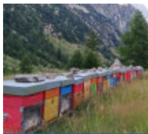
SERVIZIO A PAG. 23