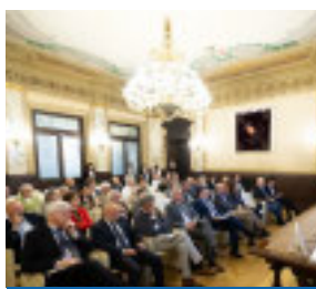
SERVIZIO A PAG. 20