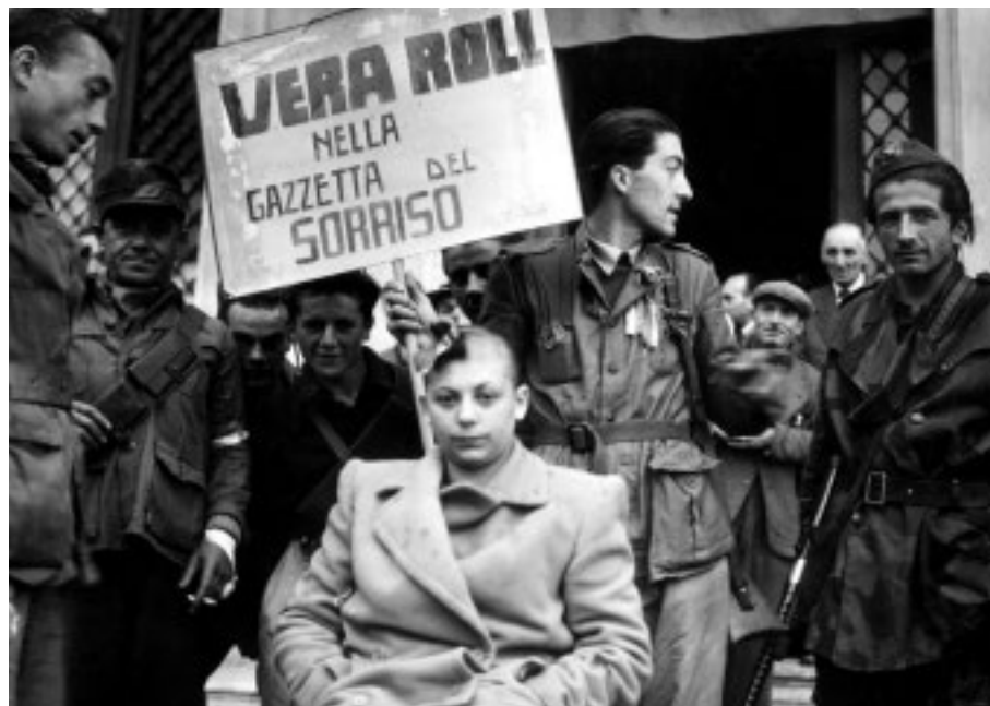
I giustizieri armati, a fine operazione ostentano orgogliosi il cartello che porta il nome della soubrette, scritto sballato