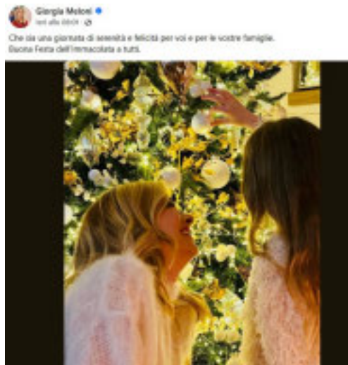
Il post della premier Giorgia Meloni