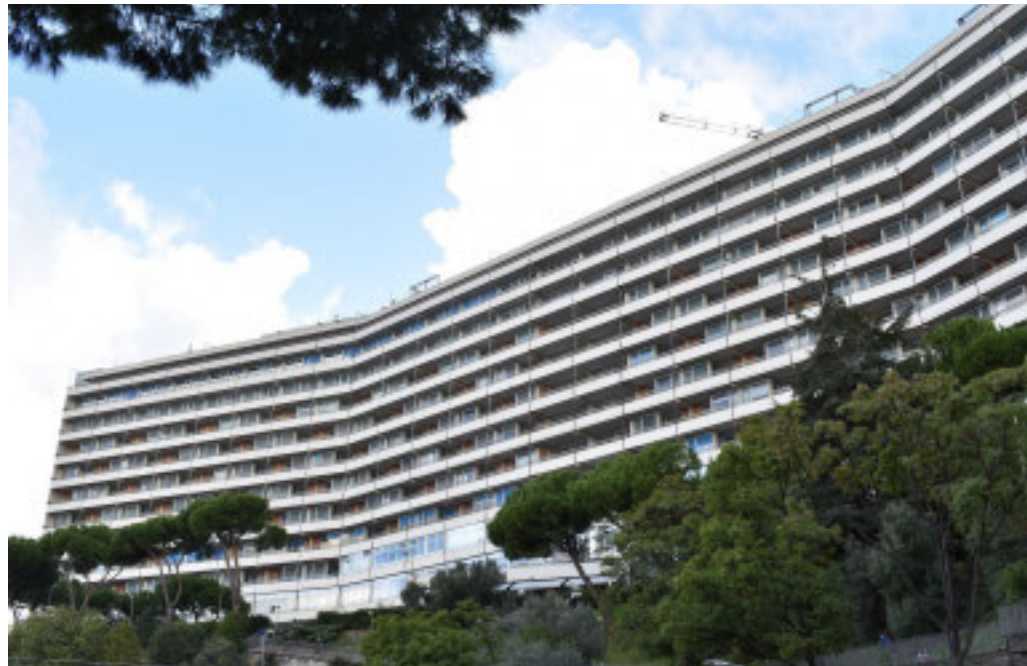
l'ospedale San Martino è riconosciuto di livello molto alto per l'oncologia

Bene policlinico San Martino, Galliera, Villa Scassi e Gaslini Ma non ci sono eccellenze nell'ambito osteomuscolare