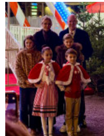
La pista di Pattinaggio sul ghiaccio inaugurata dalla Famiglia Principesca

sonde che regolano in tempo reale la produzione di freddo. Il sistema monitora costantemente le condizioni ambientali, ottimizzando i consumi e garantendo al