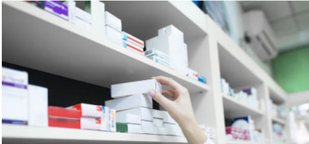
Lo scorso anno a fronte di un preventivo di 144 milioni c'è stato un incremento di 17,8 milioni

Il vincitore del bando dovrà conciliare la sostenibilità del Sistema Sanitario Regionale con l'innovazione delle cure nel rispetto dell'appropriatezza prescrittiva di tutti i clinici della Cdss e le sperimentazioni cliniche di farmaci in