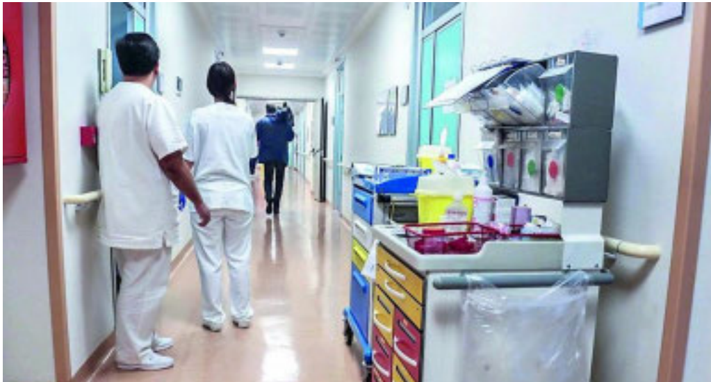
Medici e infermieri spesso non denunciano le aggressioni subite durante il loro servizio

■ Il dato è preoccupante: nel 2024 in Liguria si sono verificati 800 episodi di violenza ai danni degli operatori sanitari. Numeri allarmanti che sono il frutto di uno studio dell'Osservatorio ministeriale e diffuso nel corso della Giornata contro la violenza ai danni di infermieri e medici. Un'occasione che rappresenta un momento di riflessione su una realtà preoccupante che, purtroppo, continua a crescere. I numeri delle aggressioni subite durante il servizio sono probabilmente sottostimati, visto che molti operatori in servizio negli ospedali e anche in altre strutture sanitarie non denunciano immediatamente gli episodi di violenza o addirittura non li denunciano affatto. Ma c'è un altro dato particolarmente preoccupante della fotografia scattata dall'Osservatorio ministeriale, riguarda il genere delle vittime: la maggior parte degli operatori aggrediti sono donne. Inoltre, c'è una crescente frequenza di episodi ripetuti, con alcune vittime, come infermieri e operatori socio-sanitari, che subiscono