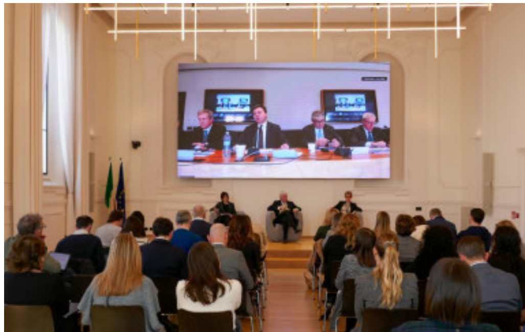
La presentazione della congiuntura industriale cuneese in collegamento con quella piemontese e torinese

Il sistema manifatturiero cuneese flette, ma si dimostra solido. In espansione i servizi, bene l'occupazione