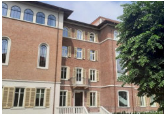
La sede di Fondazione Industriali