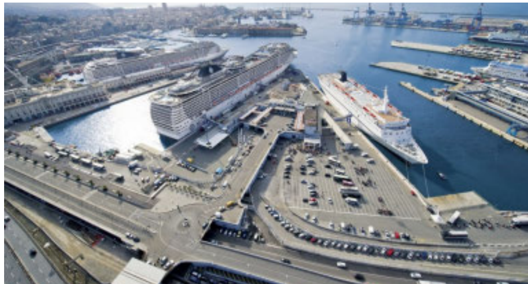
Il porto di Genova con le navi da crociera e i traghetti

Msc confermerà il suo ruolo di maggiore operatore a Genova, portando circa 1 milione 200mila passeggeri con 238 scali. L'ammiraglia Msc World Europa (circa 216.000 tonnellate di stazza lorda e capace di portare fino a circa 6.750 pas-