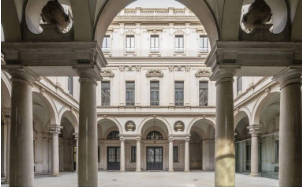
La sede della Fondazione Crt

Tra le prime realizzazioni più significative rientra la predisposizione di un volume ce-