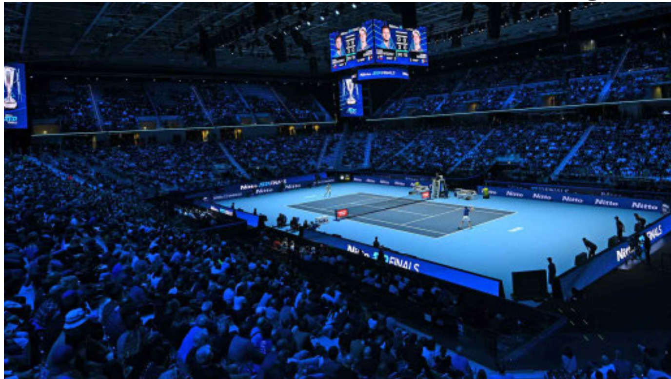
Le gare si terranno dal 9 al 16 novembre

Presentato il ricco programma di eventi speciali, con concerti, mostre e talk a corollario delle gare