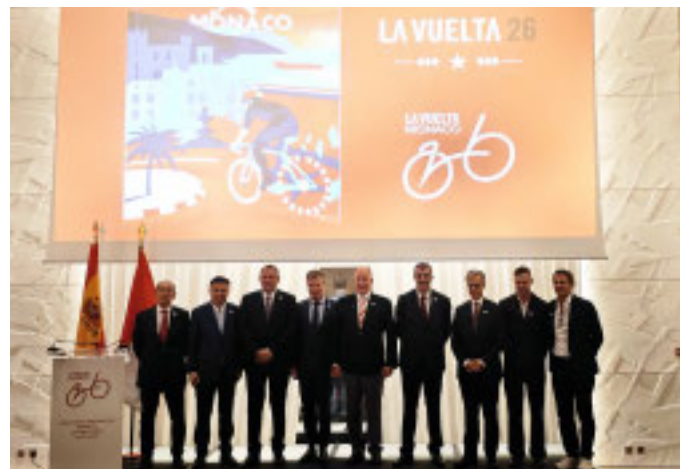
La presentazione dell'evento che si svolgerà la prossima estate. È avvenuta alla presenza di Sas il Principe Alberto

Nel 2026 il Principato ospiterà l'81ª edizione della prestigiosa corsa ciclistica iberica