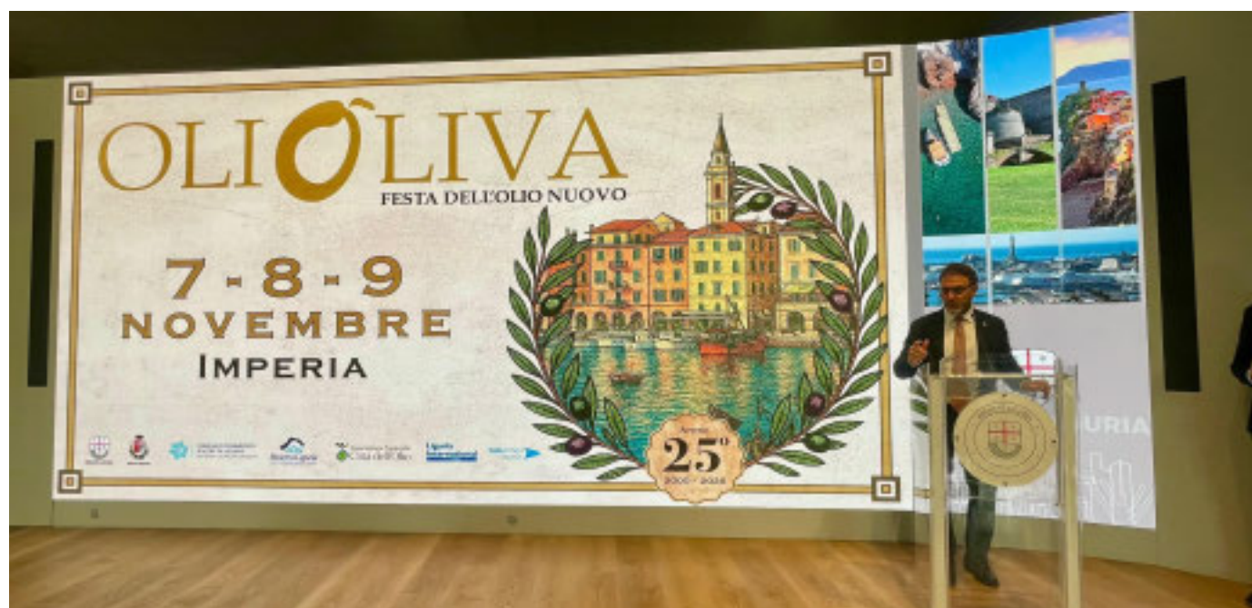
Il vicepresidente della Regione Alessandro Piana presenta l'evento «Olioliva»

«Olioliva, giunta quest'anno alla 25esima edizione, cresce sempre di più. Un evento che da anni rappresenta un'eccellenza per la città di Imperia e per l'intera Riviera Ligure. Olioliva si configura come un momento di valorizzazione della cultura olearia del nostro territorio, promuovendo l'olio extravergine di oliva, che da sempre ci caratterizza, quale prodotto di eccellenza riconosciuto a livello internazionale, così come la dieta mediterranea e che abbiamo contribuito ad affermare nel mondo», dichiara il sindaco di Imperia Claudio Scajola.