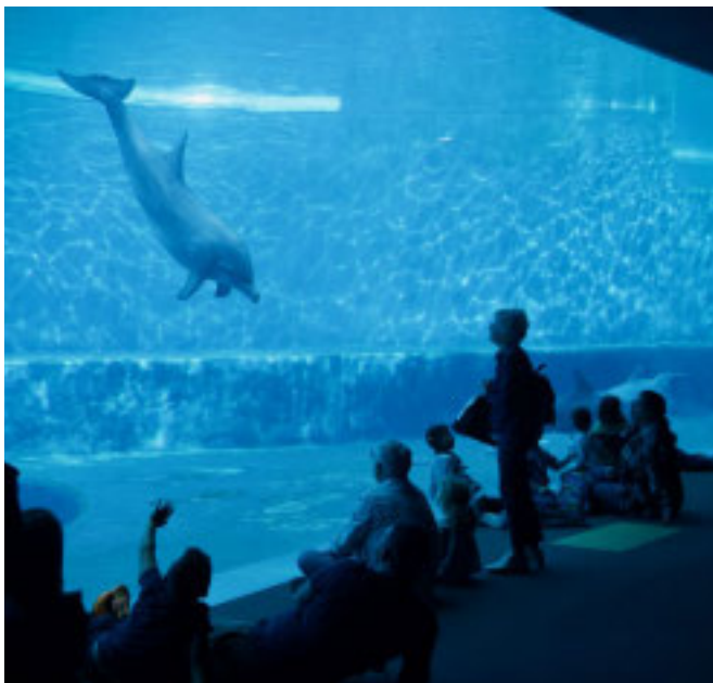
RICERCATORI OSPITATI CINQUE GIORNI A GENOVA

All'Acquario Training School per esperti Iniziativa per la rete di ricerca europea sulle foreste