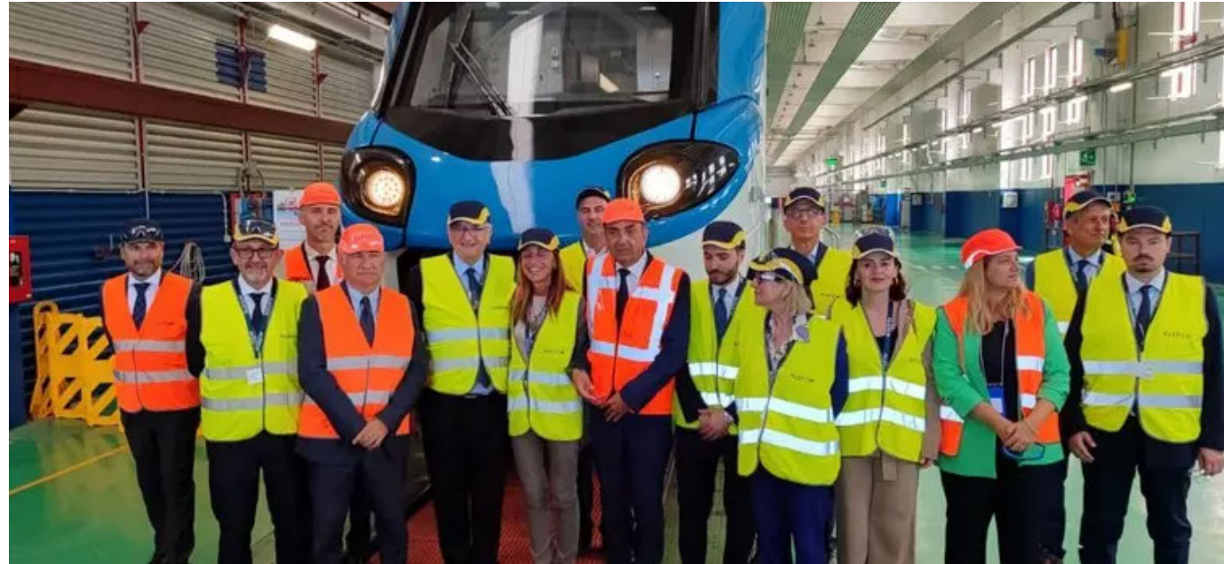
Un momento durante la visita all'Alstom