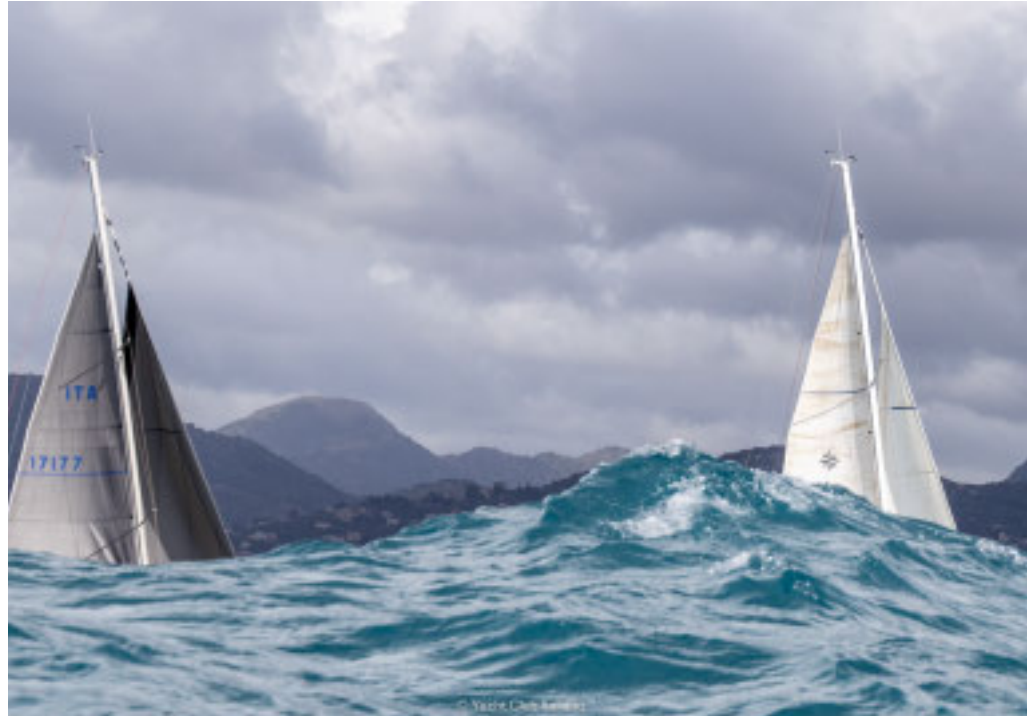
Magnifiche le imbarcazioni in gara

Sabato 20 settembre, torna l'evento organizzato dallo Yacht Club Italiano, gemellato con il Nautico