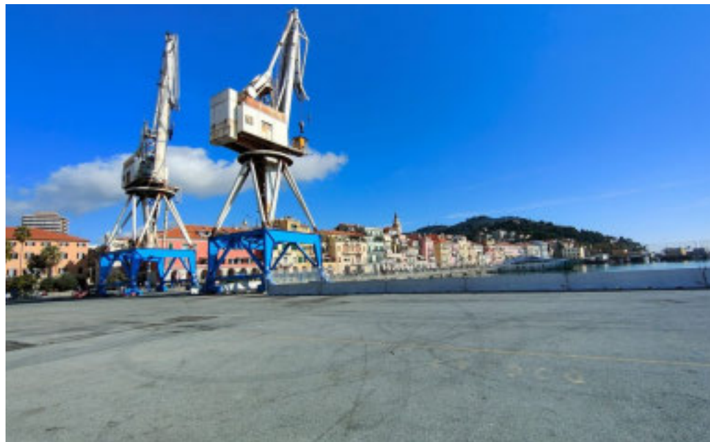
Il porto di Imperia potrebbe diventare un hub per le crociere