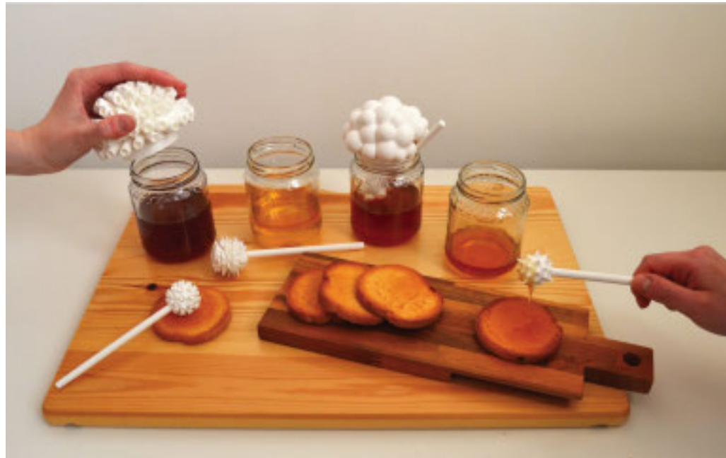
Collaborazione tra Politecnico torinese e università parmense per la didattica

Insegnamento confermato per l'Anno accademico 2025-2026. Lezioni in due città: Torino e Parma