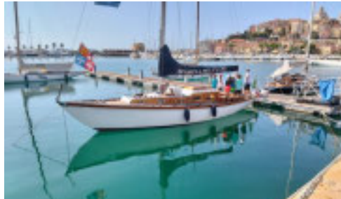
Penelope ormeggiata in porto a Imperia