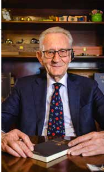
BEPPE GHISOLFI DIRETTORE RESPONSABILE