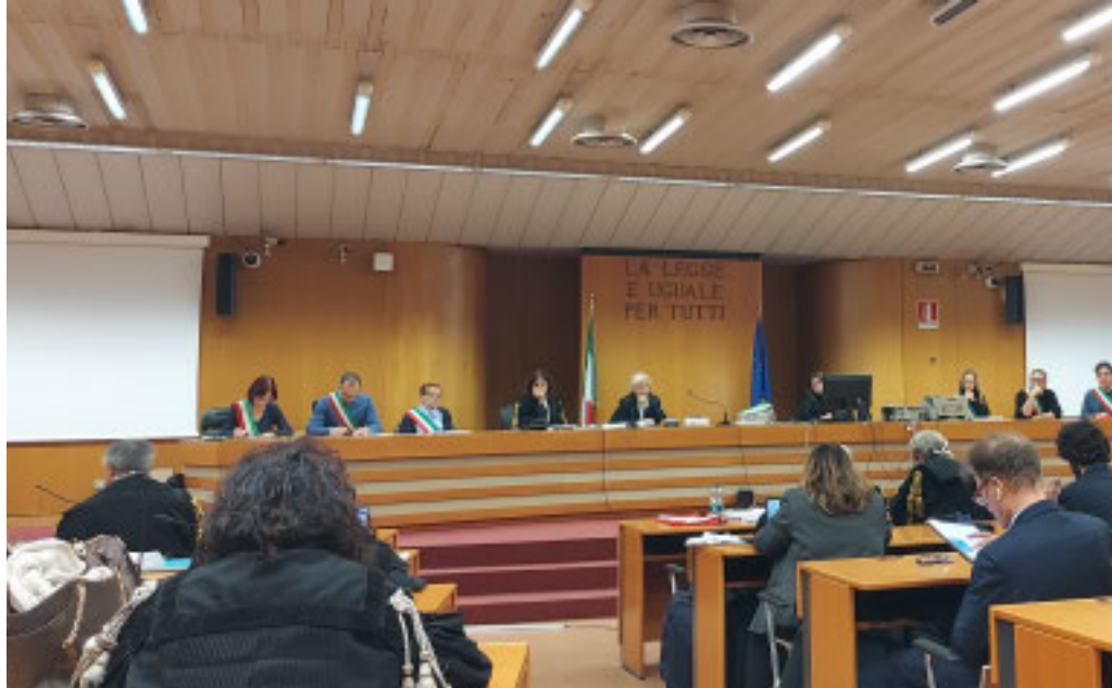
Ultime udienze per il processo d'appello per le vittime dell'amianto