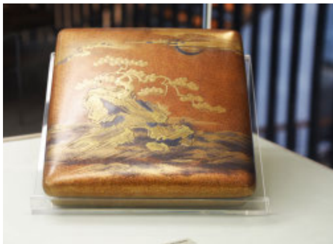
Scatola da scrittoio (suzuribako)

di presentare a un ampio pubblico quell'affascinante arco di tempo che va dal 14.000/12.000 a.C. fino al VII secolo d. C. Si parte dal periodo preistorico J mon, arrivando al periodo Yayoi che vede la formazione dei primi paesi organizzati e di una struttura sociale e politica, per giungere infine al periodo Kofun - al centro degli scavi condotti dalla missione Be-Archaeo sul tumulo funerario Tobiotsuka kofun nei pressi della città di Okayama e su altri siti del Giappone centrale - che vedrà il formarsi dei regni alla base della successiva nascita della religione, dello stato e del sistema imperiale nipponici. Si tratta di tre epoche che, pertanto, risultano essere fondamentali per comprendere a fondo tutti gli sviluppi seguenti del Giappone. La mostra è anche l'occasione per presentare e divulgare le analisi svolte da parte dell'Università di Genova e dell'Università di Torino su alcuni reperti archeologici collezionati da Edoardo Chiossone, conservati nei depositi e ora esposti al pubblico nel percorso di mostra. Tra gli eventi collaterali sarà proposta una rassegna di incontri divulgativi tenuti da importanti esperti del settore sul tema archeologico e sulla storia antica del Giappone.