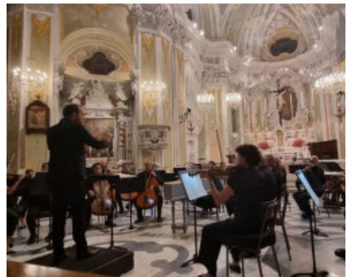
La Gog stasera si esibirà nella chiesa di San Matteo