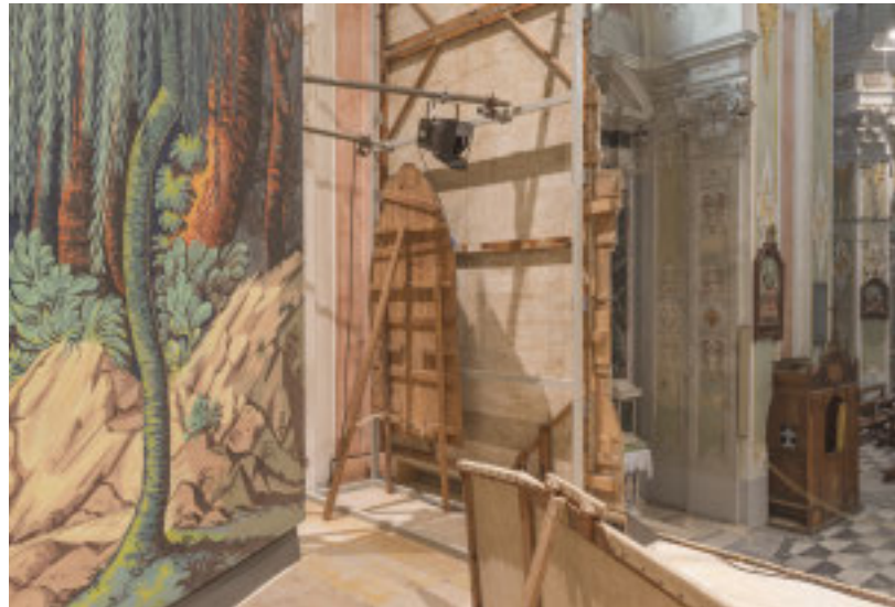
I magnifici Cartelami di Laigueglia