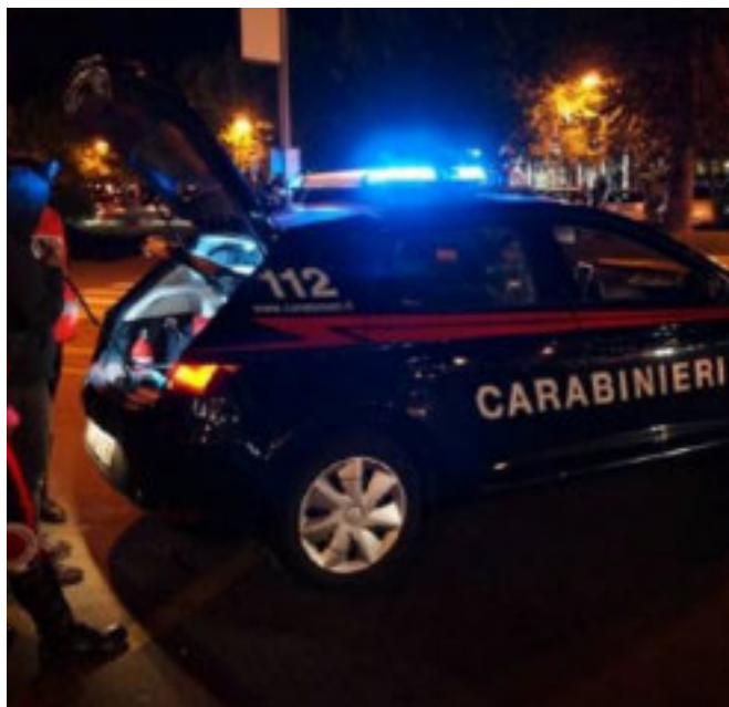
I CARABINIERI Hanno condotto le indagini

Una coppia di fratelli romeni ha aggredito un altro ragazzino per derubarlo