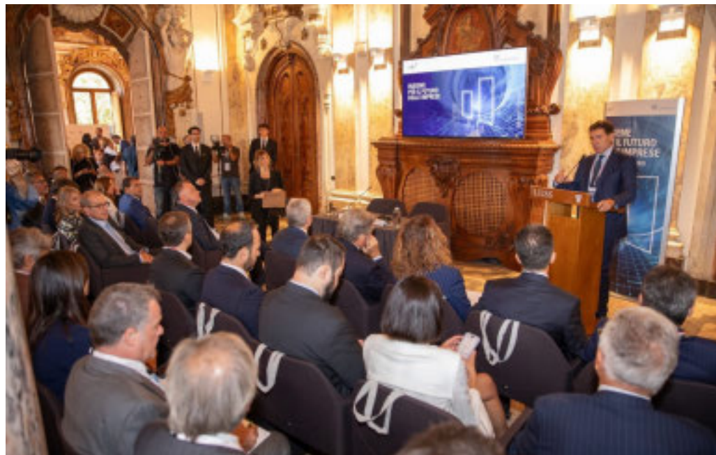
La tappa torinese del roadshow nazionale di Cdp

A Torino istituzioni e imprenditori a confronto su credito, export, rilancio e sviluppo industriale