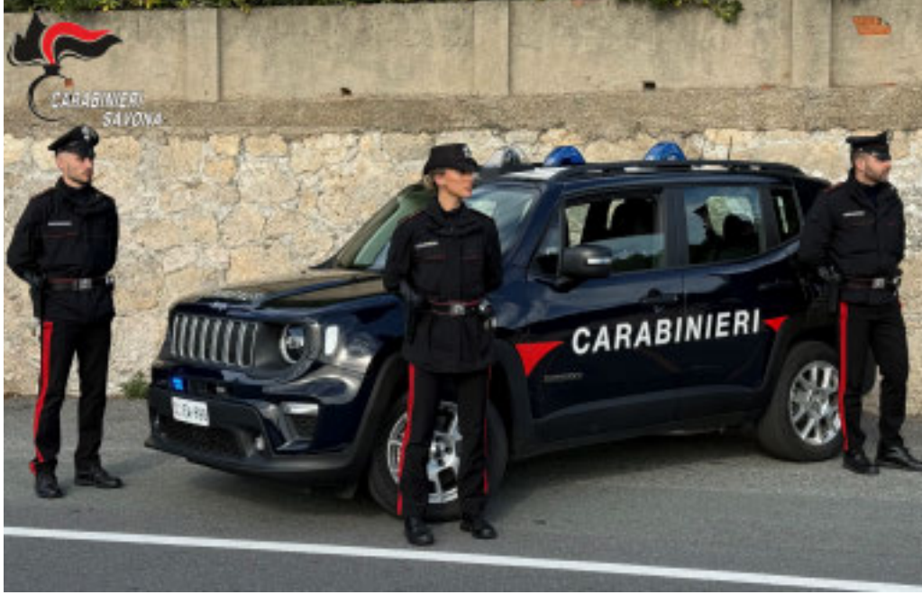
I carabinieri sono sempre a disposizione dei cittadini

■ Nell'ambito della campagna informativa e preventiva promossa dal Comando Provinciale dei Carabinieri di Savona rispetto alle truffe commesse ai danni dei soggetti appartenenti alle fasce deboli, nei giorni scorsi i Carabinieri della Stazione di Noli hanno tenuto un incontro con la cittadinanza presso l'oratorio di Sant'Anna, anche alla presenza di una rappresentanza della Polizia Locale e del Comune di Noli, nel corso del quale sono state fornite informazioni e consigli finalizzati a mettere in guardia la popolazione rispetto ad un fenomeno criminoso particolarmente diffuso, quale è quello delle truffe. Durante l'evento sono stati indicati concretamente esempi di possibili dinamiche costituenti truffe ed è stata ribadita la disponibilità in qualsiasi momento del personale dell'Arma per fornire indicazioni e supporto qualora si ravvisino situazioni sospette. Le truffe sono diventate sempre più sofisticate e proprio a Noli, lo scorso settembre una donna 65enne era stata raggiunta nell'ambito di una truffa commessa tramite la tecnica dello «spoofing», venendo quindi raggiunta telefonicamente da un numero apparentemente riconducibile alle Forze dell'Ordine.