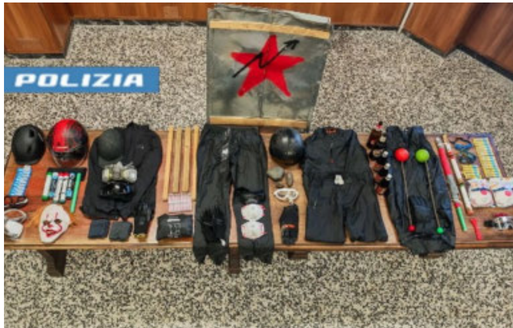
Materiali sequestrati dalla Polizia in occasione del corteo di sabato scorso

Il magistrato emerito denuncia benevolenze verso Askatasuna di parte della buona borghesia torinese