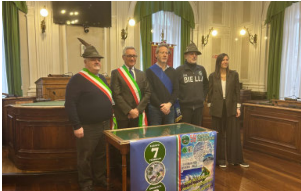
La conferenza stampa di presentazione

Siamo certi che la presenza degli Alpini saprà rinverdire, anche se in minima parte, lo straordinario clima di entusiasmo e partecipazione che Biella ha vissuto lo scorso mese di maggio, riportando sul territorio quello spirito di festa sobria e autentica che contraddistingue le manifestazio-