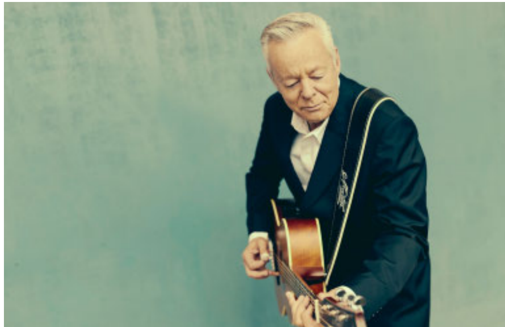
Tommy Emmanuel è una star a livello mondiale

■ La prima chitarra a 4 anni, a 9 l'esordio da professionista, a 12 i primi riconoscimenti. «Maestro della chitarra acustica», «leggenda del fingerstyle»... Le etichette si sprecano quando in ballo c'è Tommy Emmanuel, fuoriclasse australiano della sei corde in concerto stasera al Politeama Genovese nell'ambito del tour 2026 che lo riporta al pubblico ligure, dopo il tutto esaurito del 2023, sempre al Politeama. Talento straordinario ed energia travolgente, Tommy promette uno spettacolo che unisce tecnica ed emozione. Una cavalcata attraverso i classici più amati del suo repertorio, da "Classical Gas" ad "Angelina", fino ai brani del recente album "Living in the Light", ultimo capitolo di una carriera votata all'eclettismo e sospesa tra atmosfere country e riff jazz, reminiscenze blues e ampie digressioni folk. Per non dire delle ballate mozzafiato e dei coinvolgenti brani up-tempo. «Ogni concerto è una nuova occasione per connettermi con il pubblico e raccontare storie attraverso la musica. Non vedo l'ora di tornare sui palchi italiani e condividere questa esperienza unica con tutti i miei fan», dichiara Tommy Emmanuel, apprezzato per il grande interplay con il pubblico, capace di trasformare ogni live in un