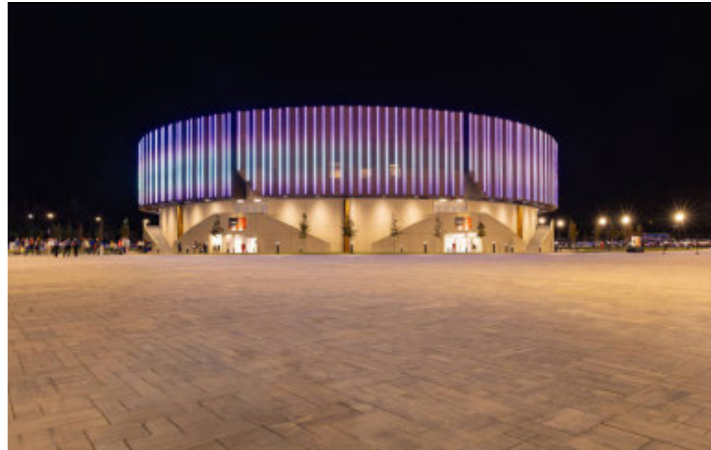
Nova Arena di Tortona

L'arrivo a Tortona di questo spettacolo - con oltre 120 milioni di fan attivi su piattaforme digitali in tutto il mondo - rappresenta un traguardo significativo per la Cittadella dello Sport - Nova Arena, che prosegue così le proprie attività di intrattenimento. Lo spettacolo si ispira infatti al successo planetario del film d'animazione Netflix «K-Pop Demon Hunters», vincitore di due Golden Globe 2026 come miglior film d'animazione e miglior canzone originale per «Golden», diventato il titolo più visto nella storia di Netflix con oltre 236 milioni di visualizzazioni.