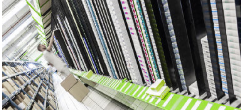
La gestione della logistica del 118 entra ora in un sistema centralizzato

Azienda Zero gestisce gli approvvigionamenti, Unifarma cura distribuzione e logistica operativa