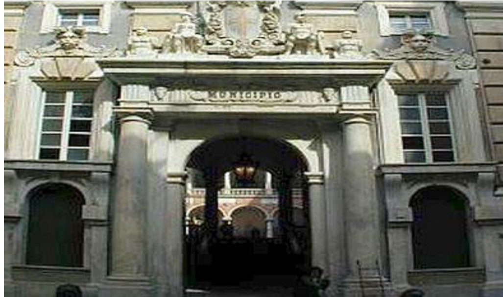
Palazzo Tursi sede del Comune di Genova

Si è riunita la Commissione Sicurezza per fare il punto sulle iniziative messe in campo contro degrado e criminalità