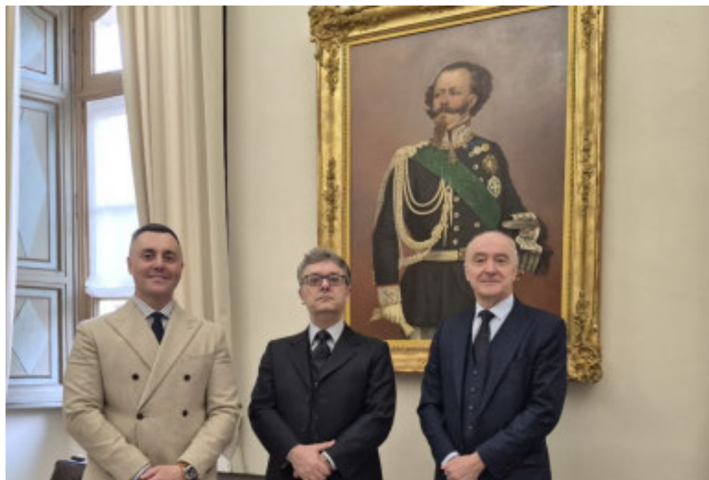
I dipinti di Vittorio Emanuele II e Umberto I tornano a Palazzo Cacciapiatti

Il restauro è iniziato a settembre 2025 e si è concluso a febbraio 2026 e ha