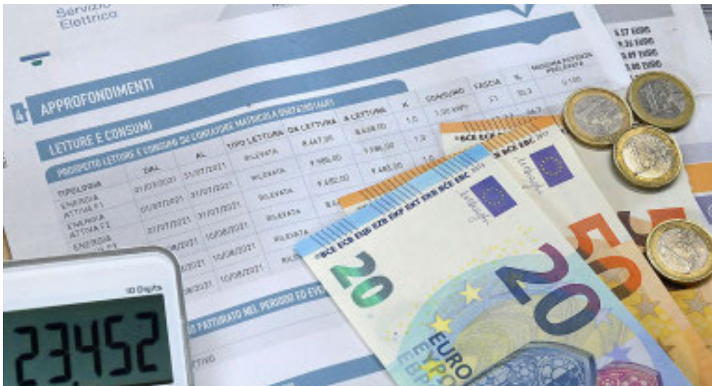
I rincari energetici pesano sulle tasche delle famiglie liguri

Analizzando meglio le statistiche si scopre che, da ottobre a gennaio, il rincaro maturato in bolletta si è tradotto in un incremento medio del 1,5% per la luce e dell'8% per il gas rispetto allo stesso periodo del 2023-2024. E' la componente del gas quella a pesare di più sulle tasche delle famiglie. L'analisi è stata realizzata sui consumi dichiarati da un campione di oltre 770.000 richieste di fornitura luce e gas raccolte da Facile.it. La spesa è stata calcolata a parità di consumi e considerando una tariffa indicizzata,