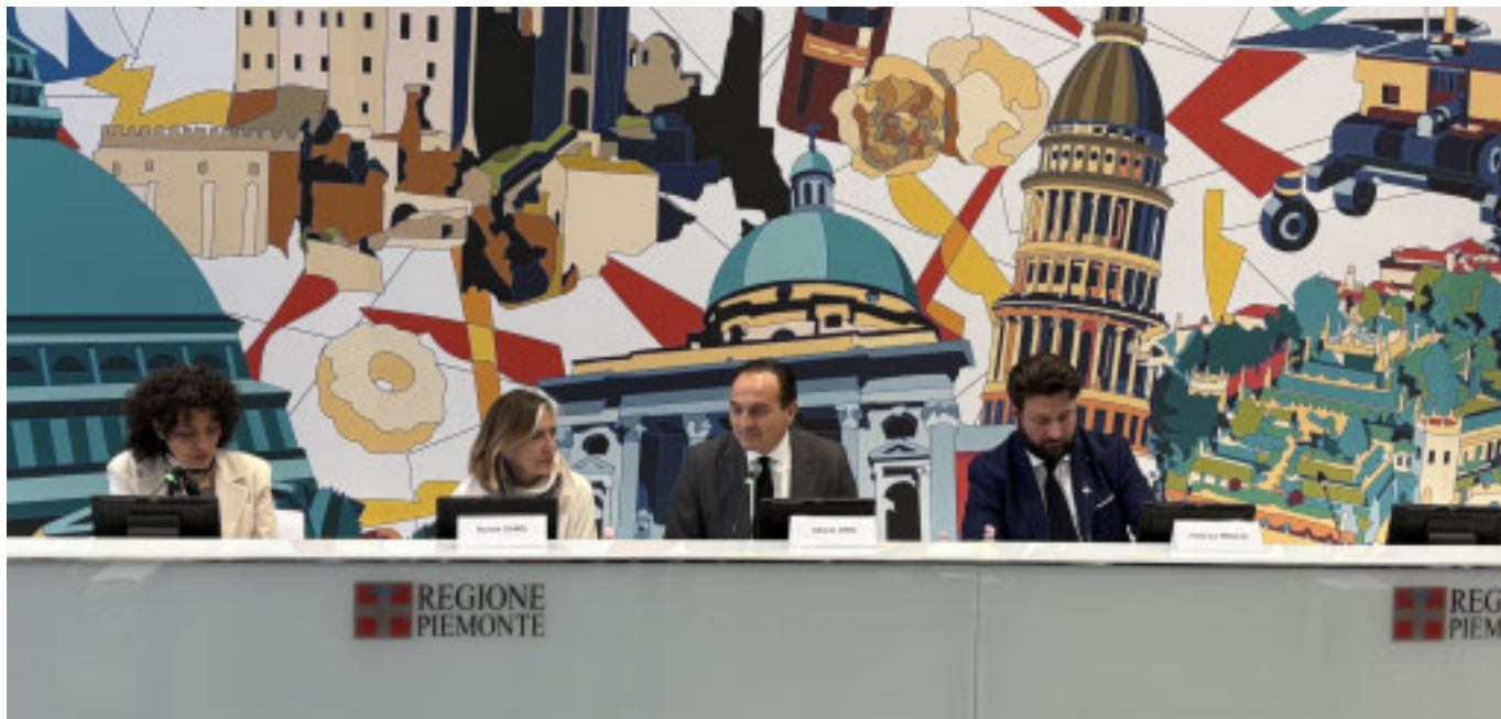
L'iniziativa organizzata al Grattacielo Piemonte

La Giunta Cirio ha rafforzato la collaborazione con l'Agenzia per la cybersicurezza nazionale