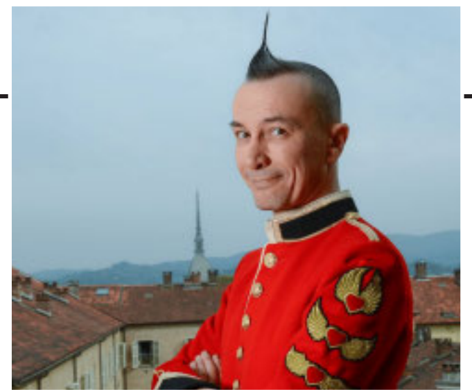
Arturo Brachetti è tra gli ospiti della kermesse

«Inspira, Ascolta, Esplora» sono tre performance in programma al The Heat Garden - Gruppo Iren che apre le sue porte al pubblico per un'esperienza immersiva tra arte, natura e sostenibilità in un percorso interattivo (sabato 24 maggio alle ore 18.30). Tra le imponenti strutture del nuovo sistema di accumulo termico del Gruppo Iren e le undicimila piantumazioni che lo avvolgono, si verrà guidati in un carosello contemporaneo: dalla danza evocativa e mistica di Ruth di Francesca Cola alla