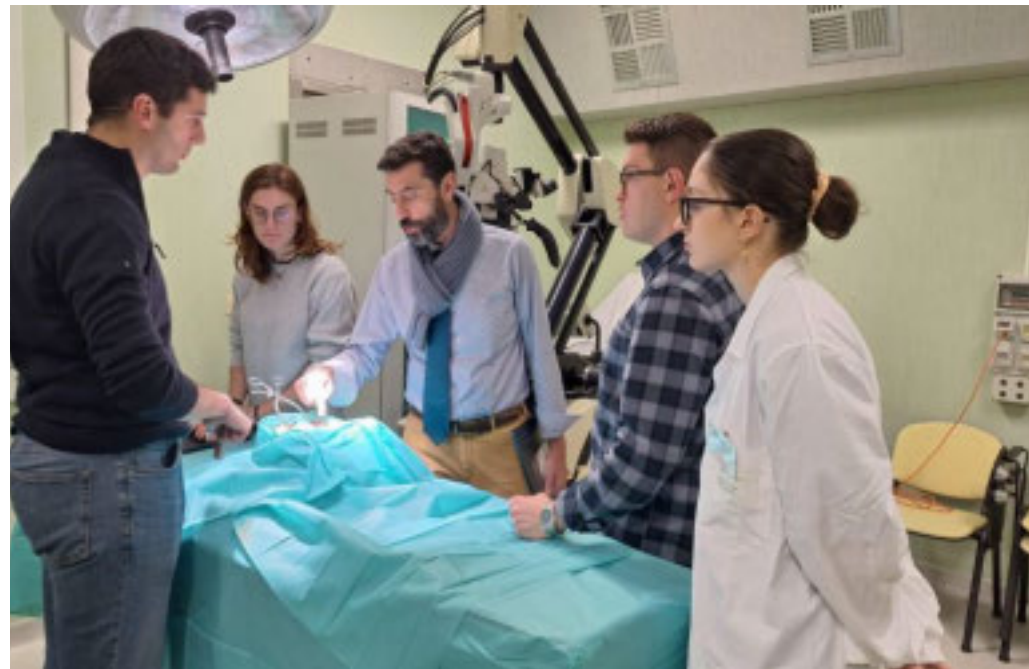
Il centro simulazione dell'Azienda Ospedaliero - Universitaria di Alessandria

Il progetto formativo prevede una fase teorica, una di simulazione su modelli avanzati e infine l'accesso alla sala operatoria