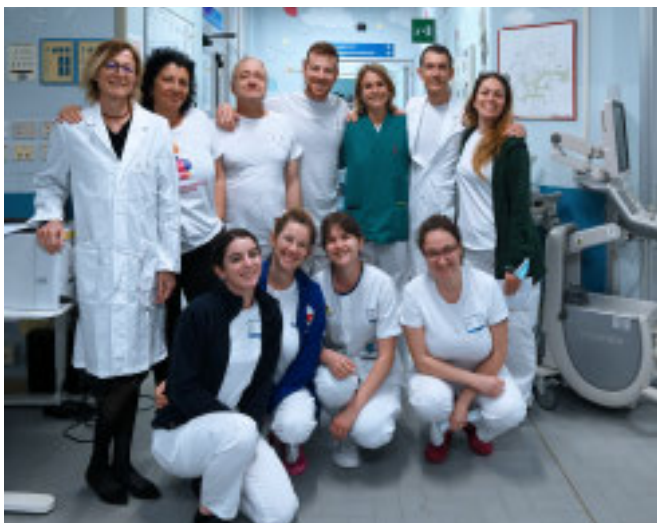
LA SQUADRA Del reparto di Rianimazione del Gaslini

La decisione dopo la chiusura anticipata del reality The Couple