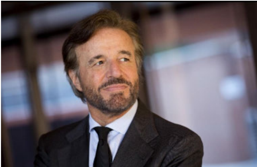
L'attore Christian De Sica sarà ospite ad Alassio per Ligyes 2025