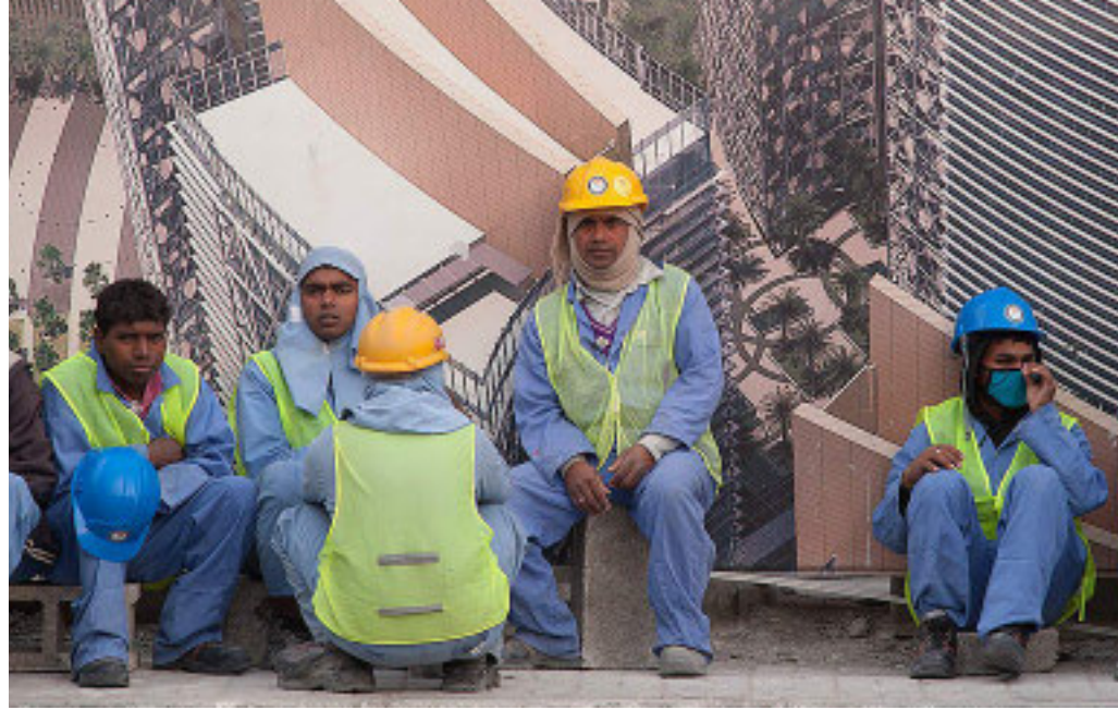
Trainano i settori delle costruzioni e dei servizi