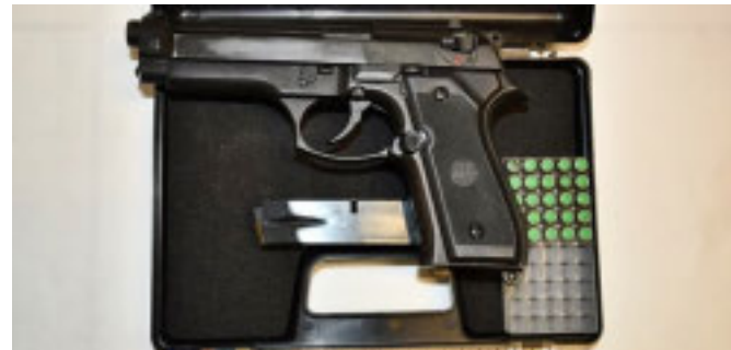
La pistola a salve

pistola che, sebbene non in grado di sparare, era sicuramente funzionale a spaventare e diminuire quindi le capacità di difesa della vittima.