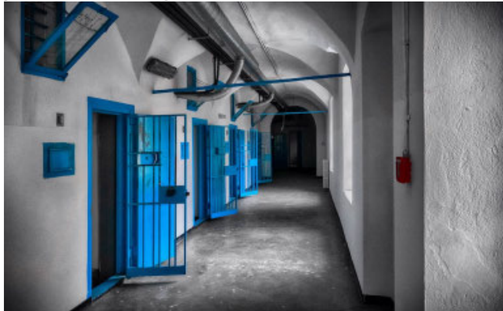
L'ex casa circondariale di piazza Monticello nel centro di Savona

Siti messi in vendita dal Demanio per essere riqualificati e valorizzati