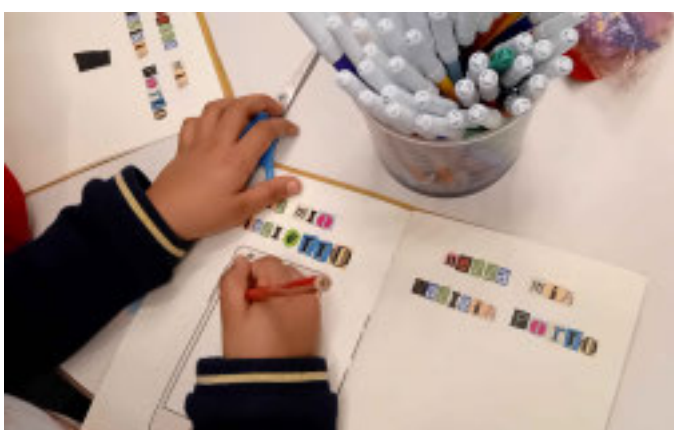
Laboratorio «Diario di Viaggio»

■ In occasione del suo terzo anniversario, il Museo Nazionale dell'Emigrazione Italiana (Mei) propone un ricco calendario di eventi, incontri e attività gratuite dedicati ad adulti, bambini e studenti universitari in programma fino a domenica 11 maggio 2025. Il fine settimana rappresenta il momento culminante delle celebrazioni, con laboratori per famiglie, conferenze tematiche e visite guidate. L'accesso al museo sarà gratuito nelle giornate di sabato 10 e domenica 11 maggio, dalle 11 alle 19 (ultimo ingresso alle 18). Inaugurato l'11 maggio 2022, a seguito dell'accordo di valorizzazione del 2018 tra MIC, Regione Liguria e Comune di Genova, il Mei si è affermato in soli tre anni come punto di riferimento culturale per la narrazione delle migrazioni italiane nel mondo. Il museo, interamente multimediale, si sviluppa attraverso 16 aree tematiche che ripercorrono le vicende migratorie italiane dall'Unità d'Italia a oggi. «Vogliamo celebrare questo importante traguardo aprendo le porte a tutti i cittadini» afferma Paolo Masini, presidente del Mei. «Durante il weekend dell'anniversario, tutte le attività, gli ingressi e gli incontri saranno completamente gratuiti, offrendo un'opportunità unica per avvicinarsi a un patrimonio