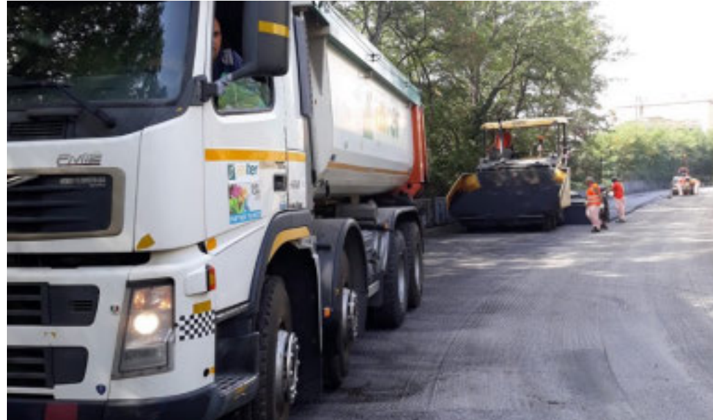
Aster si occuperà della maggior parte degli interventi

Lavori in corso o in partenza per 6,2 milioni di euro: 234 interventi su strade, marciapiedi, verde e impianti