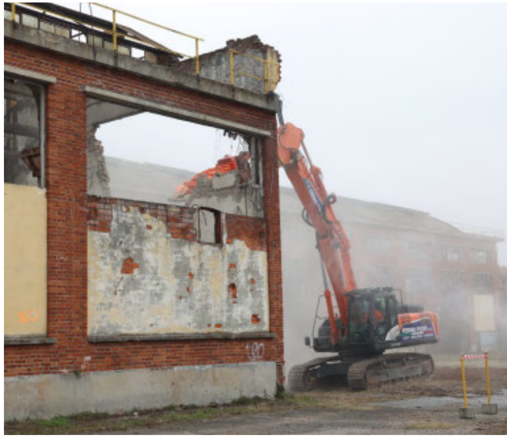
Sono iniziati ieri mattina i lavori di demolizione

Al via la demolizione del grande complesso industriale per ridare speranze al quartiere Aurora