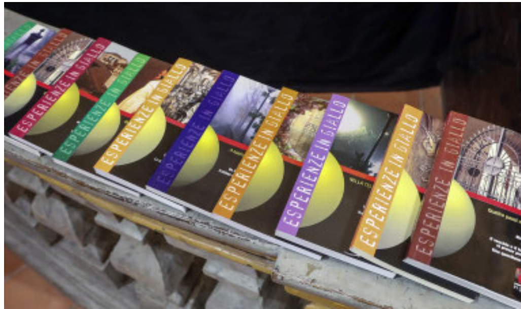
Esperienze in giallo