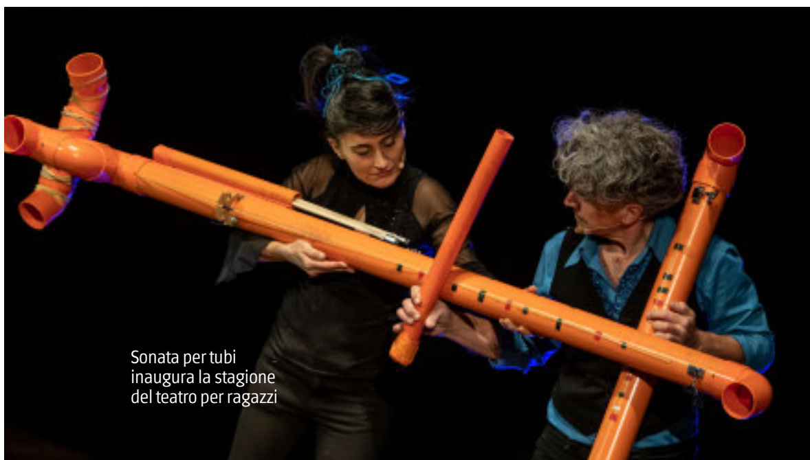
Sonata per tubi inaugura la stagione del teatro per ragazzi

Oltre trenta spettacoli per 72 repliche con le compagnie più acclamate