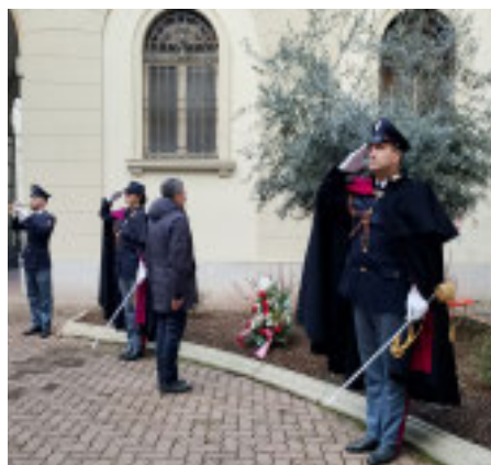
Il questore alla commemorazione

Nel 1990 è stato anche riconosciuto come 'Giusto tra le Nazioni' dallo Yad Vashem,