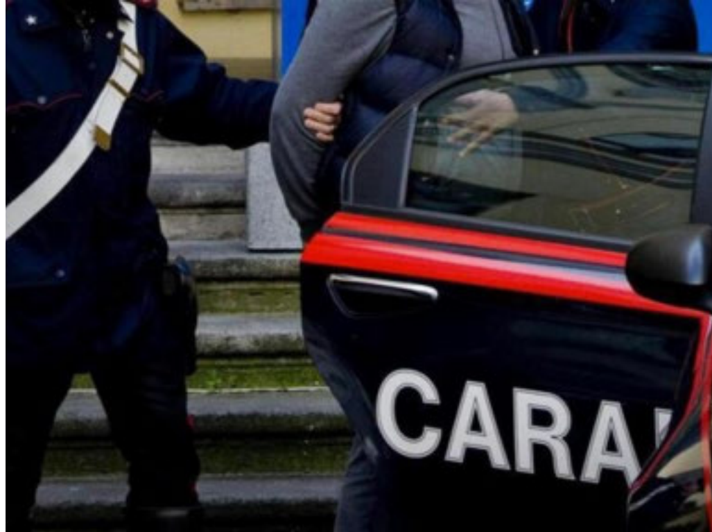
A occuparsi del caso è la Procura di Ivrea. L'arresto è stato eseguito dai Carabinieri

L'uomo, dopo aver ucciso la moglie a coltellate, ha poi tentato di togliersi la vita ingerendo sedativi