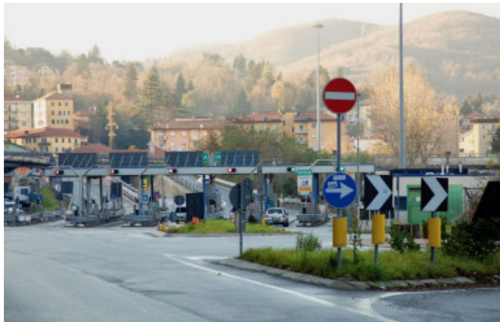
I lavori per la riqualificazione del casello autostradale partiranno in autunno

dell'utenze e ricordando sempre che la priorità è quella di garantire i massimi livelli di sicurezza». Un ulteriore confronto nelle prossime settimane per l'analisi degli avanzamenti dei principali cantieri, e dei relativi impatti sul traffico.