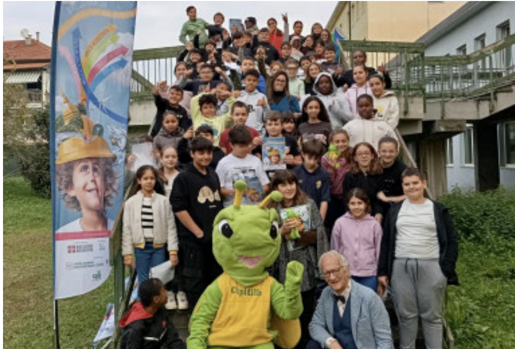
La presentazione dell'iniziativa

Il Piccolo Urbanista è un percorso di crescita per loro, ma anche per i Comuni coinvolti e utilizza le strategie migliori e già consolidate per far emergere il loro punto di