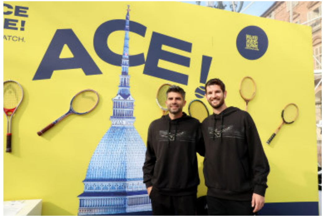
I tennisti Simone Bolelli e Andrea Vavassori