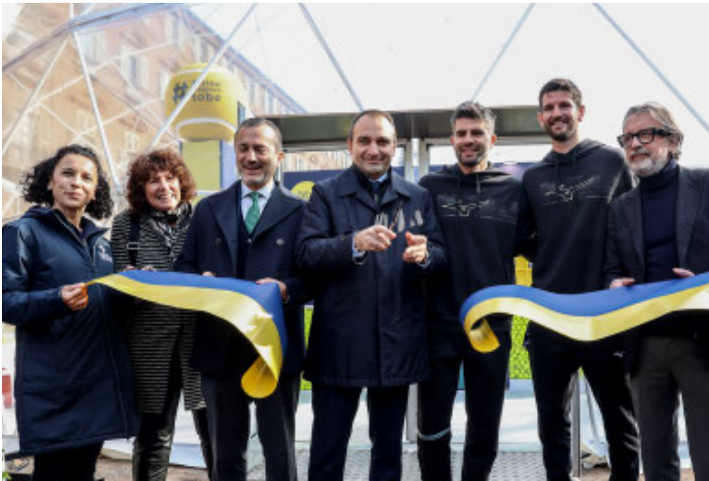
L'inaugurazione della cupola geodetica in centro