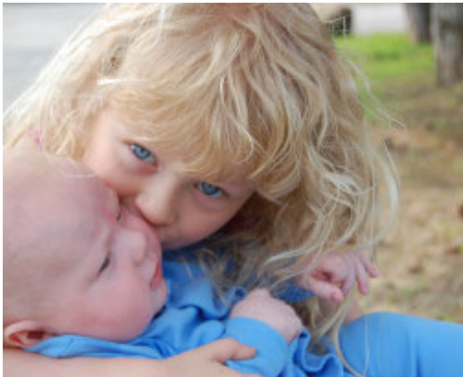
La gentilezza e l'amore si imparano da bambini