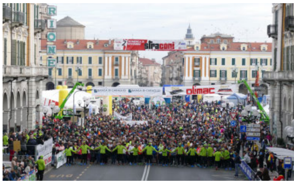
Il momento della partenza della Stracôni di qualche edizione fa

Domani mattina, dalle 6 alle 13, torna il divieto di transito in piazza Galimberti. A partire dalle 8 e fi-