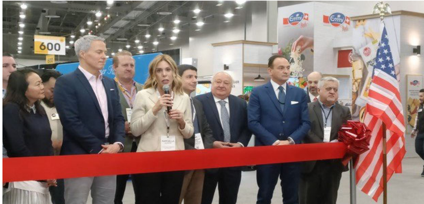
L'inaugurazione dello stand alla fiera americana

La Regione consolida i rapporti con gli Stati Uniti e promuove un mercato che continua a crescere