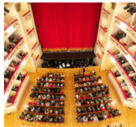
Il Teatro Sociale di Camogli

■ Sessantasette aperture di sipario in cinque mesi alle quali vanno aggiunte le quaranta della tournée di Pignasecca e Pignaverde, spettacolo co-prodotto con il Teatro Nazionale di Genova che ha debuttato con grande successo nell'ottobre scorso e che tra marzo e aprile girerà l'Italia: sono i numeri della stagione gennaio-maggio 2025 del Teatro Sociale di Camogli. Nel nuovo cartellone trovano spazio tutte le forme di spettacolo dal vivo: la musica classica, il pop, il jazz, la prosa, il teatro ragazzi, il cabaret. Un ventaglio molto ampio di spettacoli per un Teatro tra