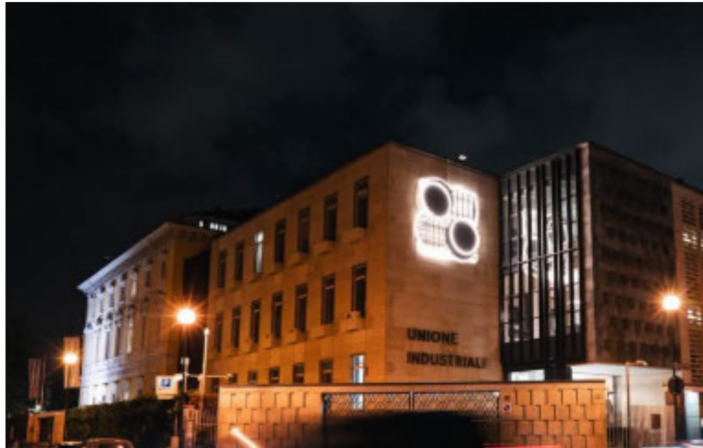
L'evento è aperto al pubblico e alle imprese piemontesi

Appuntamento giovedì prossimo, dalle ore 14.30, al Centro Congresso di via Fanti insieme ad Aifi