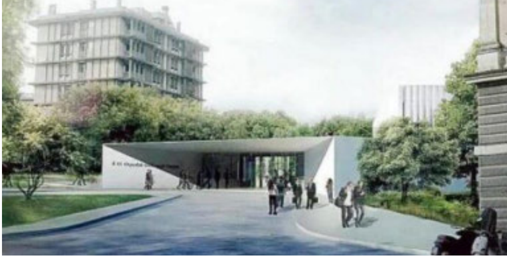
Il nuovo ospedale Galliera: un'immagine dell'ingresso

■ C'è da chiedersi se la duchessa Maria Brignole Sale De Ferrari, che nel 1888 fece edificare l'ospedale Galliera nel quartiere genovese di Carignano, sarebbe contenta oggi di vedere le condizioni delle grandi stanze di degenza con tanti letti e magari un solo bagno o nemmeno quello, senza climatizzatori e i lunghi corridoi poco agevoli per spostare i pazienti. È dagli anni Novanta che il prestigioso ospedale - dove anche oggi ci sono medici conosciuti in tutto il mondo per la loro attività di ricerca e cura che utilizzano diagnostica e tecniche d'avanguardia nella chirurgia e nelle terapie - vuole diventare moderno, al passo con i tempi, ma non c'è ancora riuscito. Per far sì che si aprano i cantieri del Nuovo Galliera, osteggiato dall'associazione Italia Nostra e prima da un gruppetto di cittadini di Carignano che ritengono che le proprietà immobiliari della zona perderebbero valore, si muovono adesso altri cittadini capitanati dai Riformisti Liberal Democratici di Genova che lanciano una petizione. «Siamo un gruppo di cittadini genovesi... fra i vari interventi necessari sia per le liste di attesa sia per i servizi territoriali, la necessità di costruire nuovi ospedali efficienti e che segua-