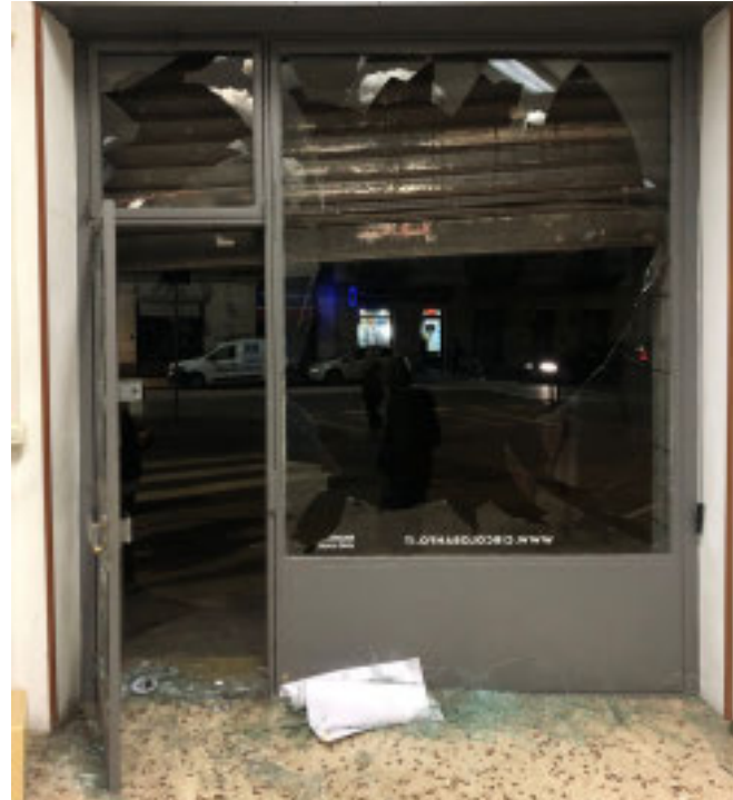
La vetrina del circolo Arci colpito da una bomba carta

Augusta Montaruli, vicepresidente alla Camera di Fdi, chiede lo sgombero immediato di Askatasuna: «Dopo l'assalto alle Forze dell'ordine, i