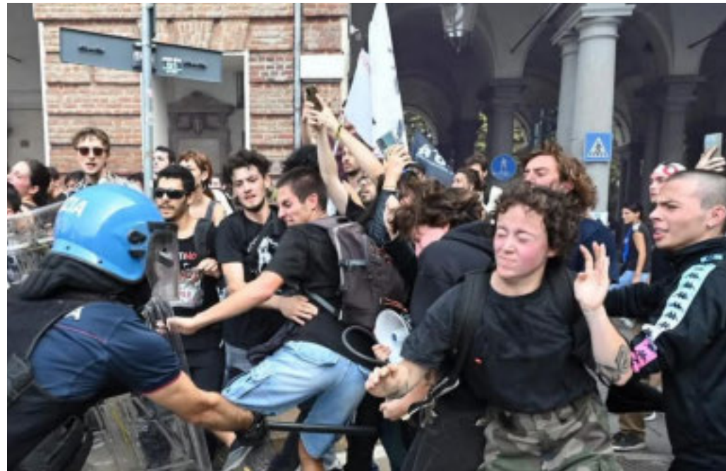
Ancora aspri scontri nel capoluogo piemontese

Dopo le ultime violenze in città, si infiamma lo scontro tra Marrone e Lo Russo sul daspo urbano