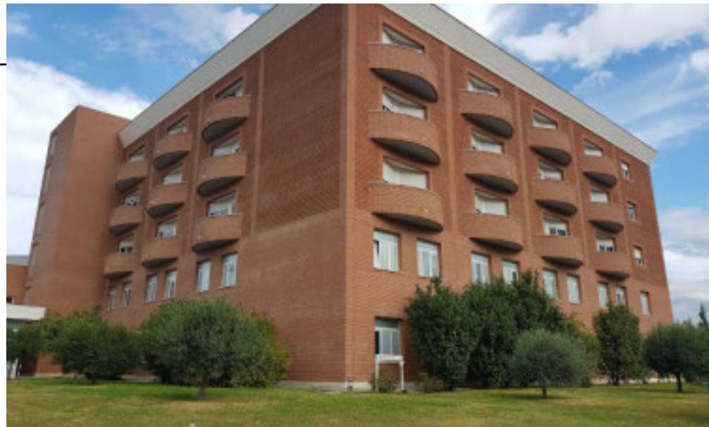
L'ospedale Santa Maria di Misericordia

Il progetto della Casa di Comunità di Albenga è stato sviluppato con la collaborazione dello Studio di Ingegneria Calvo, Delfino & Associati di Carcare, incaricato della direzione dei lavori strutturali e architettonici. La nuova struttura è stata pro-