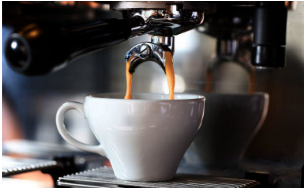
Il 2025 parte con una serie di rincari che tocca anche l'espresso

Il caffè al bar, in compagnia o da soli, è una delle abitudini più amate dai genovesi, ma la tazzina di espresso è diventata quasi un «lusso». All'ombra della Lanterna il prezzo del caffè al bar continua a salire, con alcune caffetterie che hanno portato il costo della classica tazzina fino a 1,60 euro, ma ben presto potrebbe raggiungere addirittura i 2 euro. Assoutenti ha elaborato una sorta di graduatoria nazionale dove a Genova occupa metà classifica. Il prezzo al chilo nel 2021 era di 9,86 centesimi, oggi è di 12,87 ovvero del 30,5% in più. A Torino, prima in classifica, la percentuale in tre anni è salita del 35,9%. Gli aumenti sono legati principalmente all'incremento del costo delle materie prime, che sta incidendo in maniera significativa sull'intera filiera. Secondo l'osservatorio di Assoutenti gli incrementi avvengono in modo ciclico, generalmente con aumenti di 10 centesimi alla volta. Il prezzo medio di un espresso in città si aggira intorno a 1,20-1,30 euro, ma ci sono locali che mantengono ancora il costo a 1 euro, cercando di assorbire parte dei rincari per evitare di non