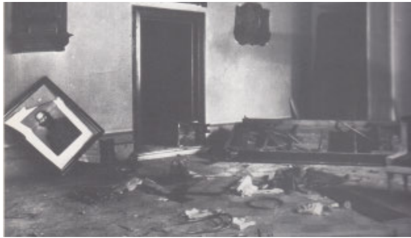
Una loggia di Firenze devastata dagli squadristi (da Aldo A. Mola, «I massoni nella storia d'Italia», Catalogo della Mostra, Palazzo Carignano, Torino, 1980).

«ex ore tuo te judico» è sempre valido, cent'anni dopo giova rileggerne qualche passo.