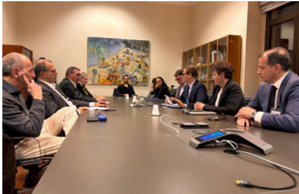
L'ultimo tavolo di confronto, dopo il quale l'accordo è stato firmato

Accordo per i pendolari nella tratta ligure, dove viene ripristinata la fermata di Sarzana a partire dal 14 dicembre