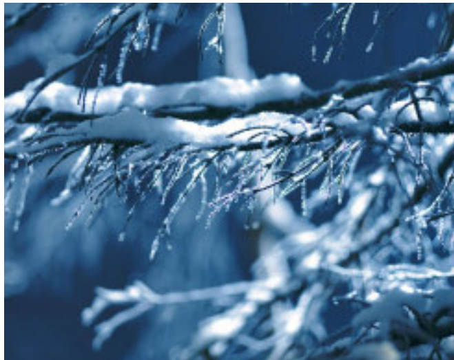
NEVE Al passo di Cento Croci e a Santo Stefano d'Aveto

Temperature in picchiata, qualche grandinata nel levante