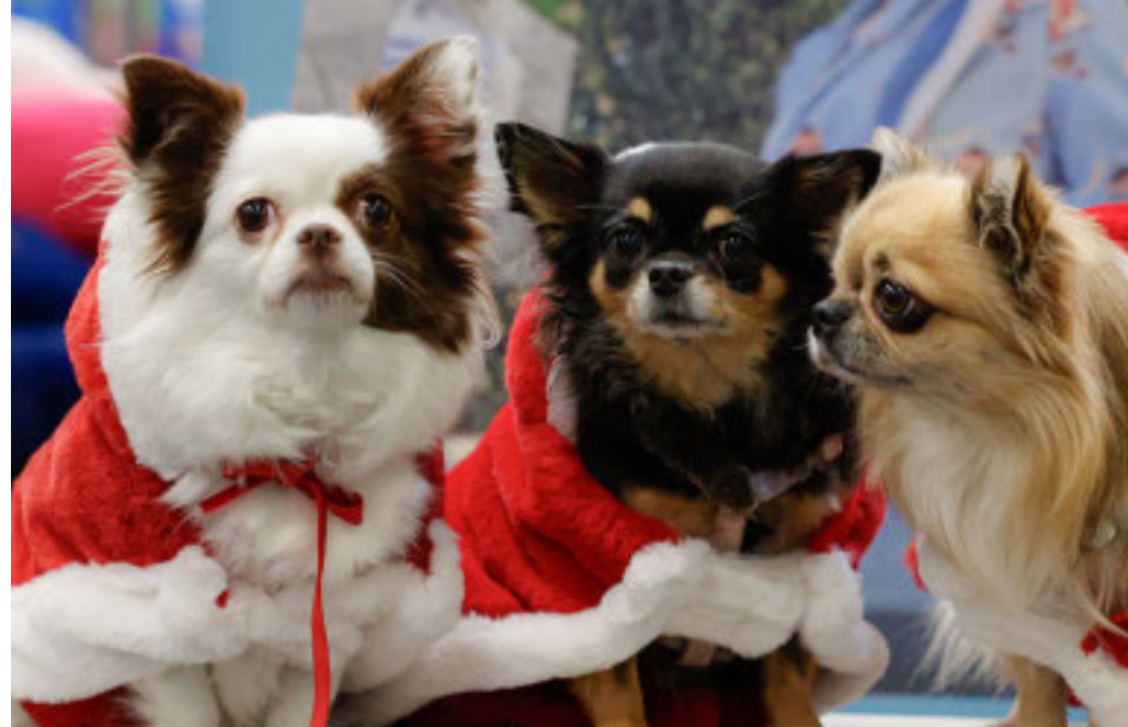
La fiera è aperta questo week-end al Lingotto dalle ore 10 alle 19

Oggi e domani due giornate tra sport, spettacoli e riuso dedicate ai nostri amici a quattro zampe