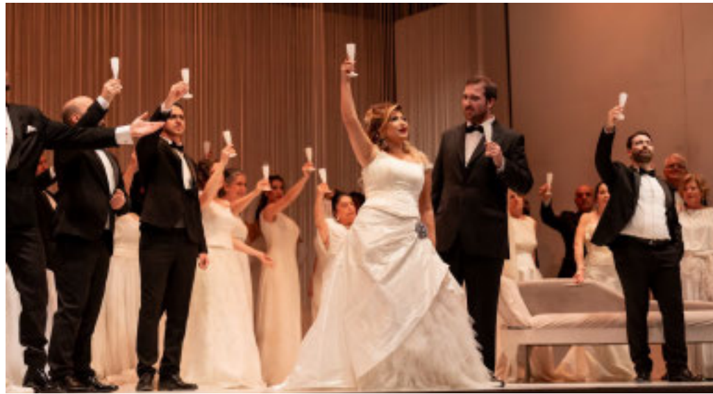
Una scena dell'opera «La Traviata»

L'appuntamento è per questa sera alle 20:30 presso il Teatro Municipale di Casale Monferrato