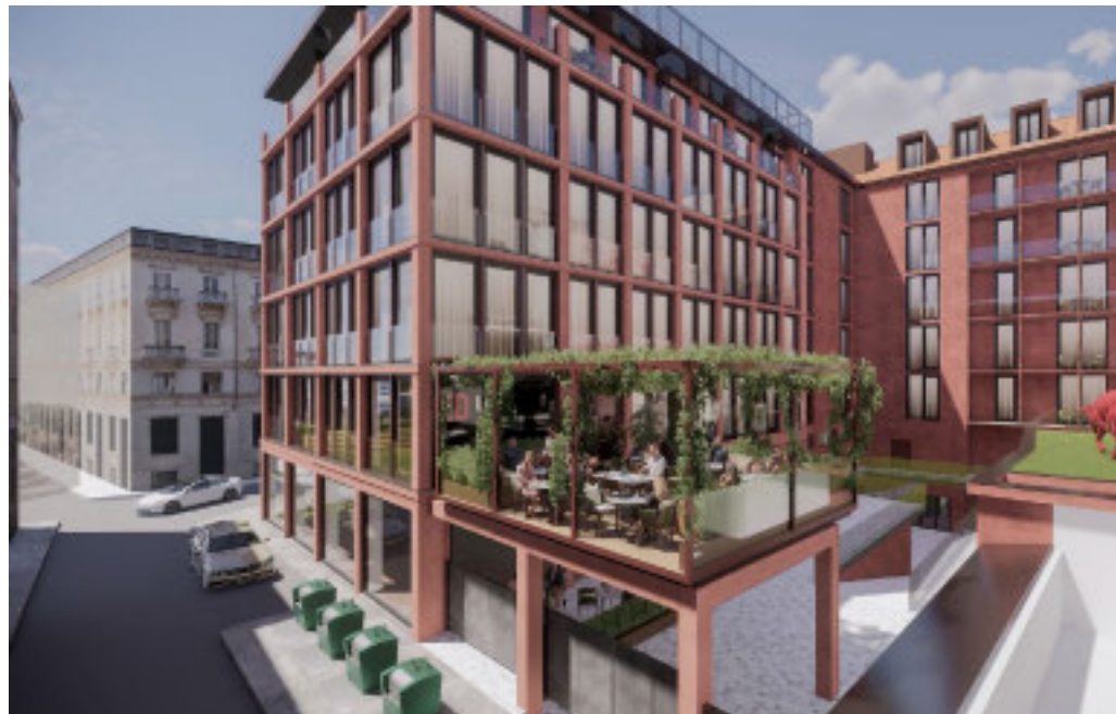
Il render del nuovo progetto nel centro storico del capoluogo piemontese

L'importante operazione immobiliare nasce da un accordo tra Gruppo Banca Finint e Gruppo Savim