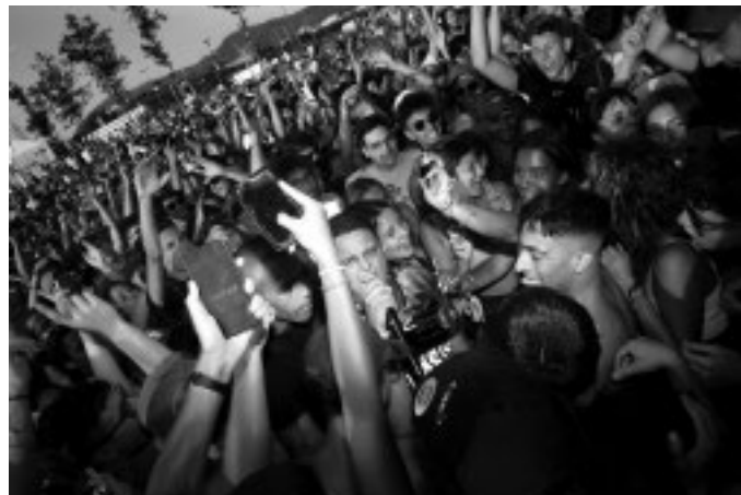
Ma che Musica, evento al Ducale

■ Dall'hip hop alla musica techno, dal rave alla musica trap. Da martedì 1° aprile è protagonista a Palazzo Ducale la musica collegata alle culture giovanili e ai temi del contemporaneo. Prende il via infatti «Ma che musica. Un percorso attraverso i paesaggi sonori contemporanei», un ciclo di incontri e di eventi musicali che accompagneranno con dj set e interventi video le parole di esperti. Il legame tra culture giovanili e musica pop si consolida negli anni Cinquanta, quando nasce la categoria sociale dei «giovani» e il rock esplose come fenomeno culturale. È in questo periodo che si sviluppa l'idea di una «musica dei giovani», dando il via agli studi sulle culture musicali giovanili e i relativi stili di vita, pratiche quotidiane e identità di gruppo. Il programma - a cura di Luisa Stagi - è organizzato in collaborazione con Laboratorio di Sociologia Visuale - Unige e Forevergreen/Electropark e abbraccia diversi temi presentati a livello musicale, con la partecipazione di alcuni rappresentanti emergenti di riferimento delle principali scene artistiche musicali locali. Il format degli incontri si apre quindi a quello degli even-