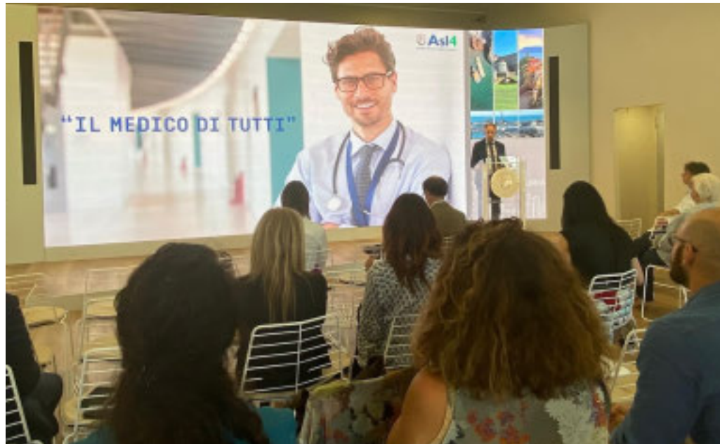
Il servizio che già esisteva viene reso ancora più efficiente e prolungato