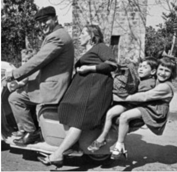
Il reportage è stato pubblicato in forma integrale in Italia soltanto nel 2022

Così dall'amore vero e profondo di un giovane fotografo francese, che nel tempo registrerà il mondo e i suoi cambiamenti, è nato uno dei reportage più straordinari della storia della fotografia.