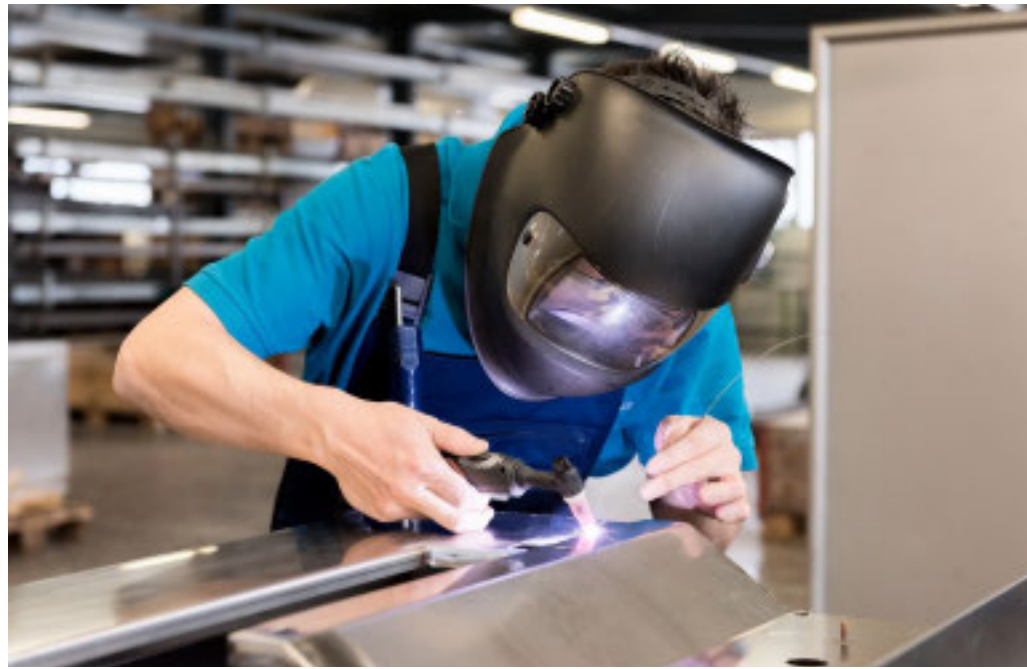
I saldatori sono una figura professionale molto richiesta

Il progetto, che coinvolge l'ente regionale Agenzia Piemonte Lavoro e l'agenzia formativa VCO Formazione, è uno degli approdi dell'efficace collaborazione fra rete pubblica e privata per soddisfare i fabbisogni occupazionali e formativi delle imprese del territorio. Tramite il servizio Alte professionalità e grandi reclutamenti e il Centro per l'impiego di Omegna, l'ente pubblico regionale Agenzia Piemonte Lavoro gestirà infatti l'intervento di ricerca e selezione del personale; l'agenzia formativa VCO Formazione, accreditata per il programma nazionale Garanzia di occupabilità dei lavoratori (GOL), si occuperà invece della progettazione e dell'erogazione del percorso