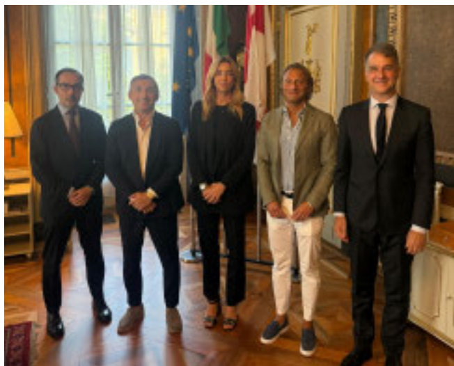
L'INCONTRO Di ieri a Palazzo Tursi con i vertici di Uefa e Cgic

La sindaca incontra i vertici di Uefa e Cgic In vista degli Europei 2032 servirà uno stadio performante