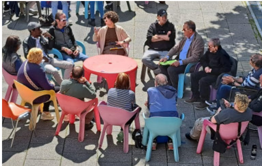
L'ente si occupa anche di prevenzione e sensibilizzazione

L'associazione non profit è stata costituita nel 1990 per volontà di Severino Poletto, allora arcivescovo