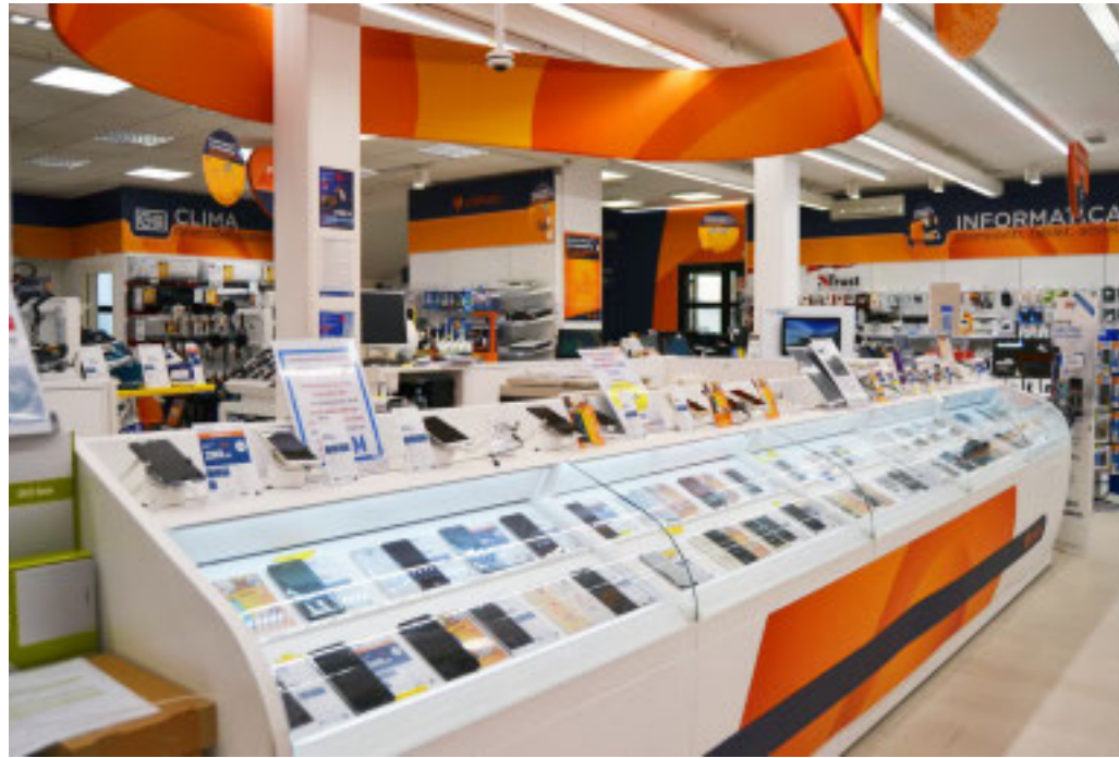
Nel Savonese piacciono telefoni, ma anche auto e mobili

In Liguria in crescita l'acquisto di auto, moto, elettrodomestici e informatica