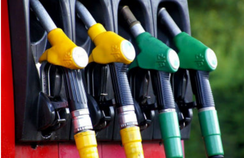
L'Italia ha una presenza di stazioni di servizio abnorme rispetto agli abitanti

roga alle normative sulla sicurezza, mentre molte zone dell'entroterra vanno depauperandosi progressivamente di un servizio essenziale, alla stregua degli uffici postali, degli sportelli bancari, delle farmacie, delle edicole e dei negozi di generi alimentari»,