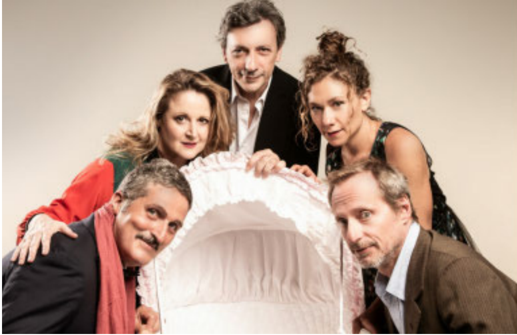
Il cast de Le Prénom, commedia in scena al Politeama Genovese

■ Arriva al Politeama di Genova, per tre recite (dal 20 al 22 maggio alle 21, prezzi: € 34,50 / € 29; Gruppi € 16, Scuole € 12), l'acclamata commedia «Le Prénom, cena tra amici». Quarantenni a confronto tra colpi di scena, battute comiche, amicizia, rancori e legami profondi. Serata conviviale a casa di due professori (liceo lei, università lui) dichiaratamente di sinistra. Tra parenti e amici inizia un gioco di provocazione e di verità che si allarga sino a diventare il ritratto di una generazione: tra piccole meschinità e grandi sentimenti. Una sera come tante altre tra cinque amici quarantenni. Tutti appartenenti alla media borghesia. Oltre ai padroni di casa, ci sono il fratello di lei che fa l'agente immobiliare e la sua compagna in ritardo a causa di un impegno di lavoro con dei giapponesi, mentre l'amico single (sospettato di essere omosessuale) è trombonista in un'orchestra sinfonica. Quella sera, il fratello comunica alla compagna che diventerà padre. Felicitazioni, baci e abbracci. Poi le solite domande: sarà maschio o femmina, che nome gli metterete? Il futuro papà non ha dubbi che sarà maschio; ma lo sconcerto nasce quando egli comunica il nome che hanno deciso di mettere al figlio. Un nome che evoca imbarazzanti memorie storiche. Il dubbio è che si tratti di uno scherzo, ma la discussione degenera ben presto investendo