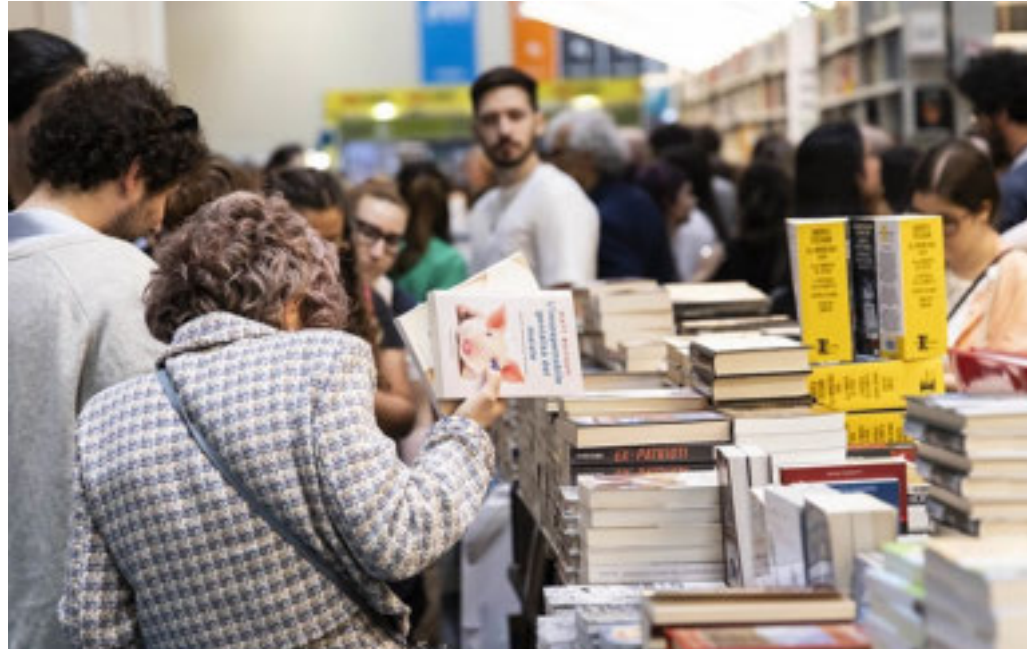
Sono 1.225 i marchi editoriali presenti fino a lunedì prossimo, con oltre 700 stand

Inaugurata al Lingotto Fiere la nuova edizione della kermesse con il ministro Alessandro Giuli