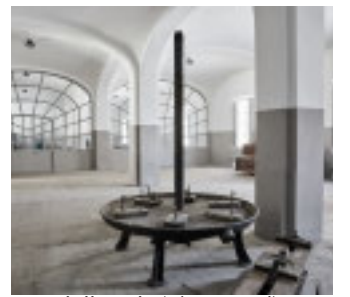
Una delle sale

L'intervento immaginato da Giuseppe Gabbellone appositamente per l'occasione è un racconto visivo in cui ogni traccia, disseminata nelle sale, punta all'unico obiettivo di individuare un orizzonte, inteso come linea, meta o apparizione misteriosa, che possa coinvolgere il pubblico a livello