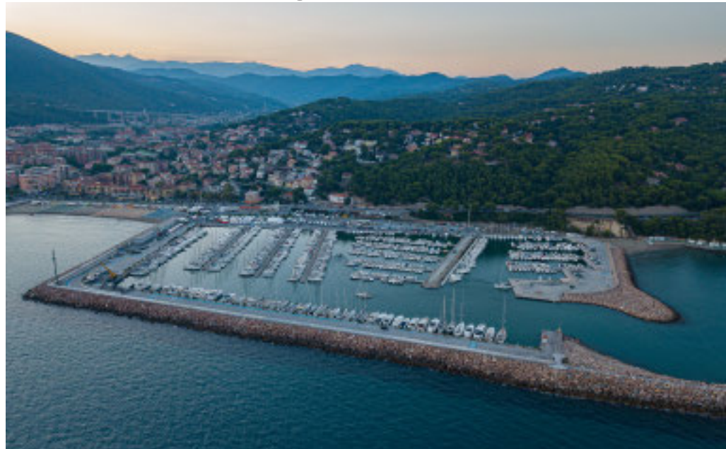
Il porto di Andora premiato per la trentottesima volta con la Bandiera Blu delle Fee

Esperti a confronto a Palazzo Tagliaferro con l'assessore regionale Marco Scajola