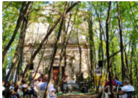
Concerto nel bosco

Il nuovo claim del festival «Semi di Jazz. Fughe e Ritorni» è insieme visione artistica e radice culturale: il Monfrà Jazz Fest 2025 esplora il jazz come linguaggio della migrazione, dell'evoluzione e del ritorno, includendo musiche nate dalla diaspora e dal nomadismo culturale: klezmer, tango, fado, gipsy. Ogni concerto è concepito come un gesto di memoria di profonde