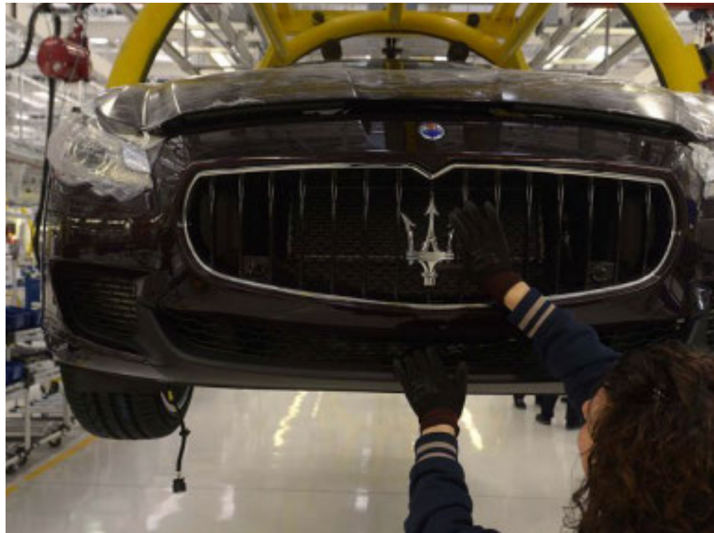
Piange lo stabilimento torinese, sorridono a Modena

Le produzioni di GranTurismo e GranCabrio lasciano Mirafiori. Arriva però la Fiat 500 ibrida