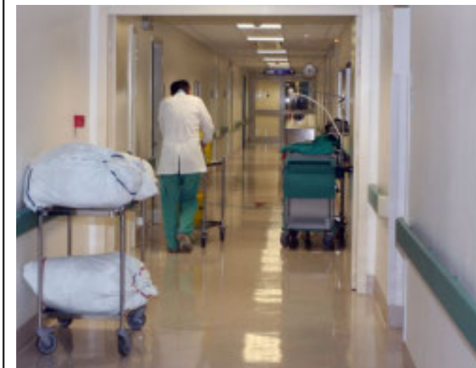
IN CORSIA Uno dei reparti dell'ospedale di Imperia

Liste d'attesa ridotte ricorrendo ai privati Asl 1 e Asl 2 acquisteranno 24 mila prestazioni diagnostiche