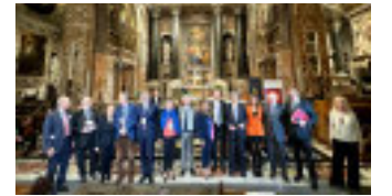
I presidenti dei Rotary genovesi