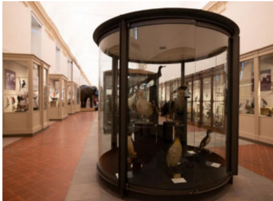
Una delle sale del Msrn di Torino

«La rivalutazione del patrimonio scientifico e la sua divulgazione attraverso l'attività dei nostri musei costituiscono azioni privilegiate attraverso le quali l'Università mette a disposizione della cittadinanza il valore pubblico della conoscenza. Questo importante accordo di