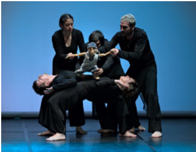
I cinque performer (più uno) in scena stasera

La rassegna Sabato a teatro, realizzata con il rinnovato sostegno di Gruppo Cambiaso Riso, proseguirà sino al prossimo maggio tra il Teatro Gustavo Modena, la Sala Merca-