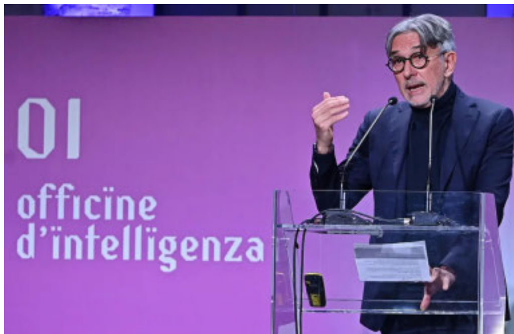
Fondamentale la partnership che collega ricerca pubblica e filiere produttive

Entro il 2030 fino a trenta centri di ricerca per sostenere la competitività delle imprese