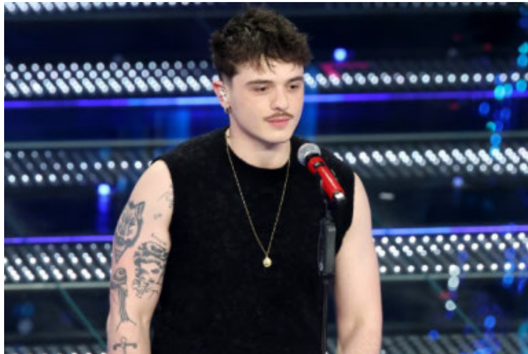
Olly ha vinto il Festival di Sanremo dell'anno scorso, con Balorda Nostalgia

per la 76ª edizione scorre veloce, milioni di italiani non si limiteranno a guardare il Festival: lo sentiranno vibrare in tasca, ricordandoci che in Italia, anche una suoneria può avere il sapore di una standing ovation.