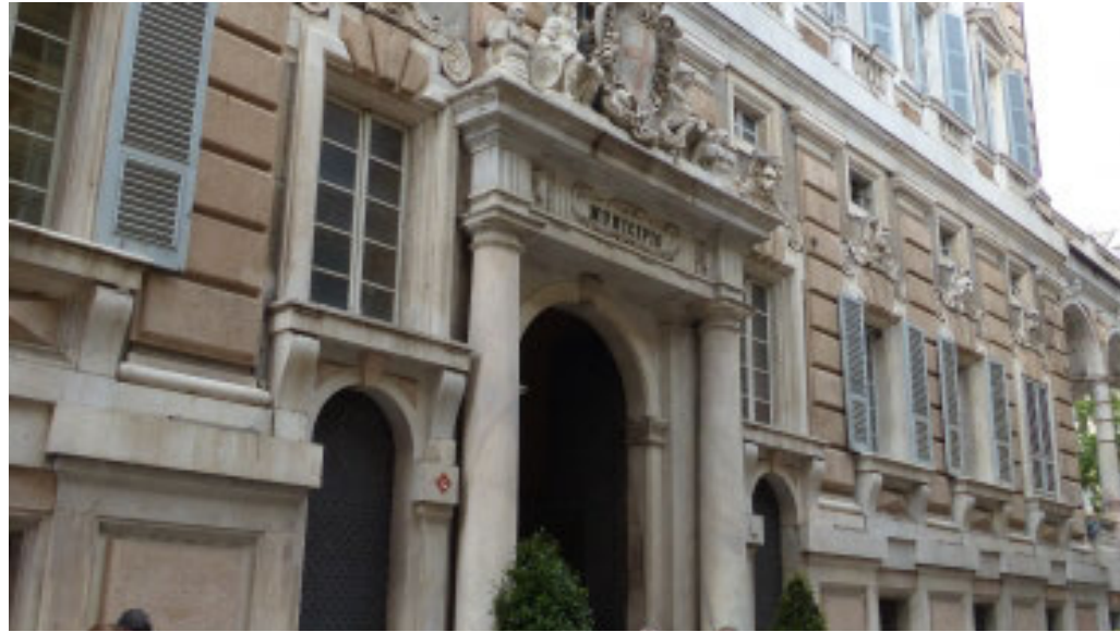
Palazzo Tursi sede del Comune di Genova

«Ma non è tutto. Abbiamo chiesto una cosa chiara: si sono svolti incontri, da parte del Sindaco, della Giunta o di Consiglieri Delegati, con un operatore economico durante la fase della gara d'appalto, successivamente aggiudicata al medesimo operatore, per Capodanno. A nulla sono valse le mail di sollecito e, pertanto, a causa della totale non trasparenza ci siamo ritrovati a dover scrivere al prefetto. Con l'occasione abbiamo anche segnalato come nessuna risposta sia pervenuta dall'assessore competente in merito al sollecito fatto, all'interno della Commissione Toponomastica, per la continua assenza della targa di Norma Cossetto (che non è stata più riposizionata dopo gli ultimi atti di vandalismo che l'hanno colpita, ndr)». La Lega ribadisce il proprio impegno a tutela delle prerogative del Consiglio Comunale