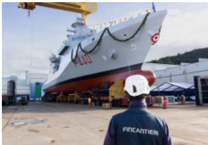
IL PATTUGLIATORE UGOLINO VIVALDI Varato ieri a Riva Trigoso

Fincantieri l'ha realizzato per la Marina Militare Italiana