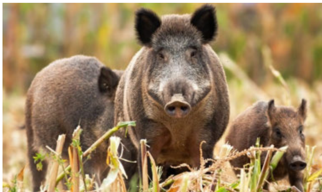
Sono previste misure più mirate, calibrate sulle singole realtà locali

Il modello di contenimento sarà presentato a Bruxelles come esempio di gestione sanitaria