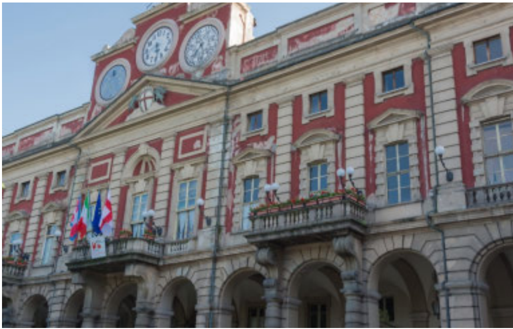
Il municipio di Alessandria