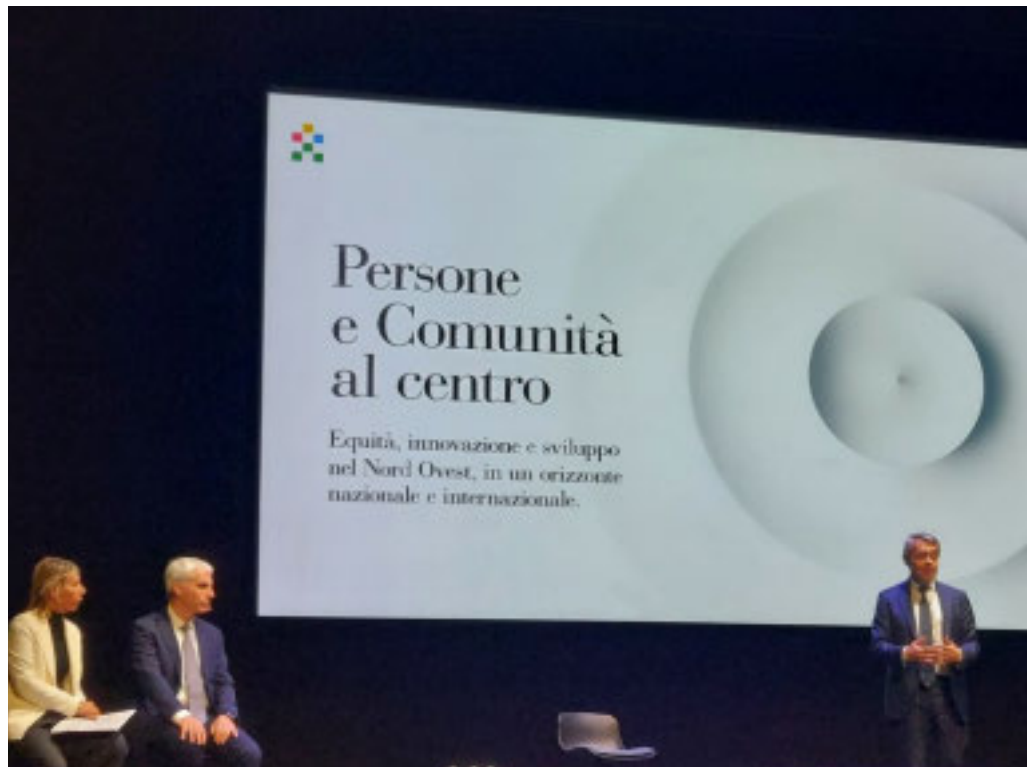
Questo sarà l'anno della piena attuazione del Piano pluriennale

Nuovi strumenti e partnership per lo sviluppo del Nord Ovest nel documento strategico 2025-2028