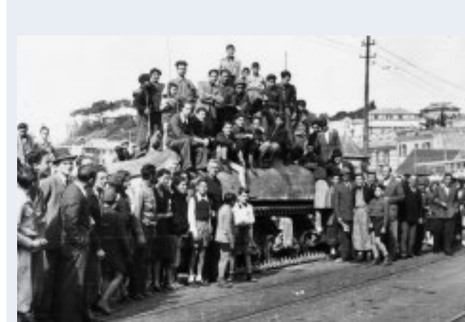
Festeggiamenti, a Quarto, per l'avvenuta liberazione

protagonista del fotogiornalismo italiano del secondo dopoguerra. Un'occasione per entrare nel vivo del lavoro dell'archivista e del curatore, tra memoria scritta e visiva, riscoprendo Genova e l'Italia che rinasce attraverso lo sguardo di un grande testimone del suo tempo. Il materiale raccolto costituisce una narrazione corale della storia di Genova e dell'intera Italia. Le fotografie, scattate nei momenti più importanti e significativi del nostro Paese, mostrano il cambiamento in tutte le sue forme: dal cambiamento urbanistico, con le strade e le case che si trasformano e si spostano al cambiamento negli eventi mondani, nei volti che li popolavano e che facevano sognare chi ne seguiva le gesta, passando per il cambiamento nelle manifestazioni politiche, religiose, sportive senza dimenticare i cambiamenti che hanno attraversato la società negli ambiti della moda, della mobilità, dell'arte e della cultura. L'evento è su prenotazione; per partecipare è necessario inviare un'e-mail all'indirizzo archivioleoni@muma.genova.it entro martedì 21 ottobre. L'Archivio Fotografico Francesco Leoni, dichiarato di interesse storico-culturale dalla Soprintendenza Archivistica della Liguria, conserva oltre quattro milioni di immagini che coprono un arco temporale dal 1930 agli anni '90.