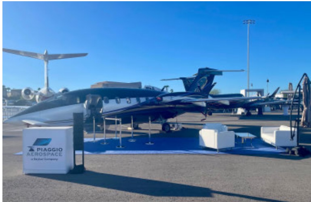
Il modello P180 Avanti Evo in esposizione a Las Vegas