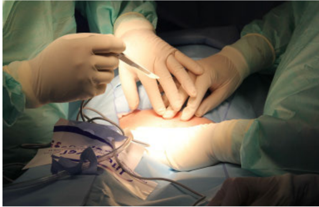
La Regione ha deciso di potenziare anche la parte degli interventi chirurgici