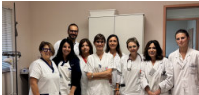
il team multispecialistico

oltre mezzo milione di fratture da fragilità, spesso conseguenza diretta della riduzione della massa ossea.