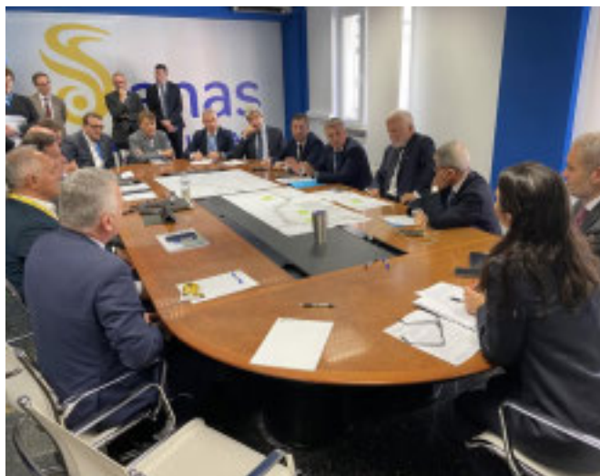
UN MOMENTO Della riunione di ieri con Anas

Il viceministro Rixi, dopo la riunione con Anas e i sindaci coinvolti