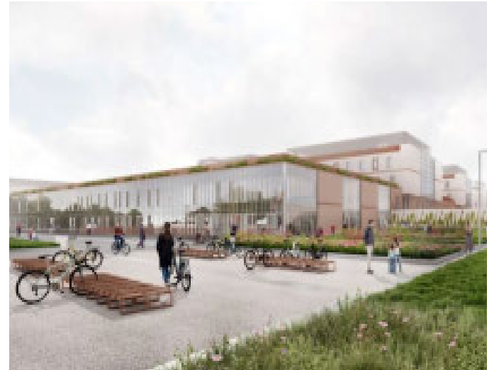
Il render del progetto della nuova Città della Salute di Novara