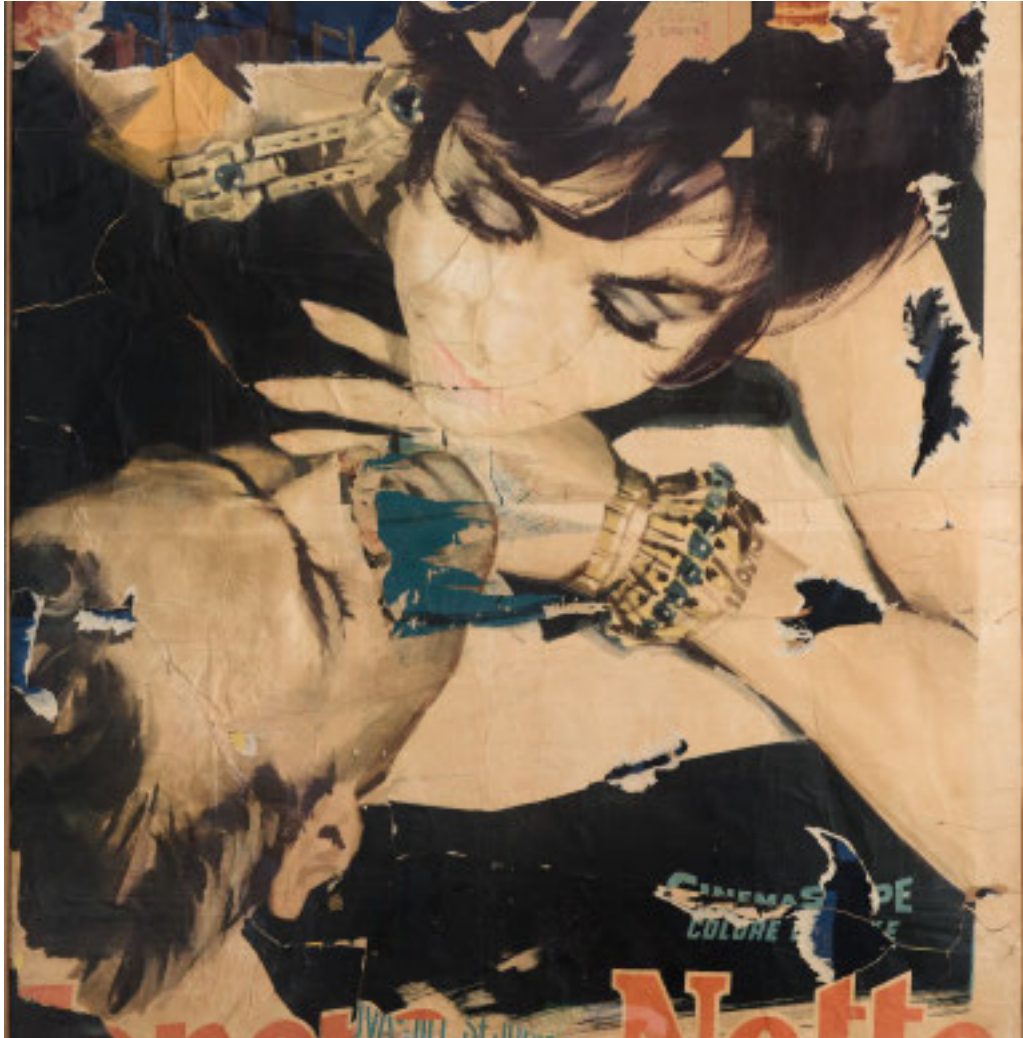
Décollage intitolato «Tenera è la notte», realizzato nel 1962

Nel sottoporticato di Palazzo Ducale l'esposizione curata da Alberto Fiz su sessant'anni di attività