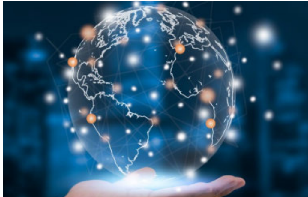
Le attività previste includono missioni internazionali e partecipazione a eventi fieristici

Importante sostegno all'internazionalizzazione con i Progetti di Filiera