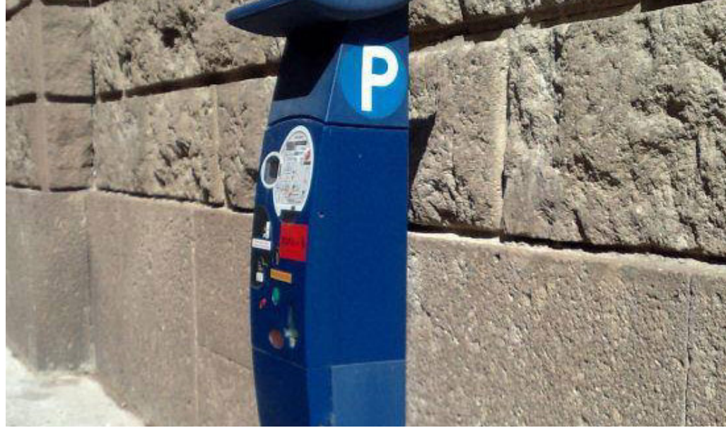
Per facilitare chi vive in centro il Comune ha rivoluzionato il parcheggio in centro dall'8 al 10 maggio

le uscire durante orario di chiusura notturno, non si possono lasciare veicoli in sosta dopo le 22 di lunedì (penale 20 € a notte).