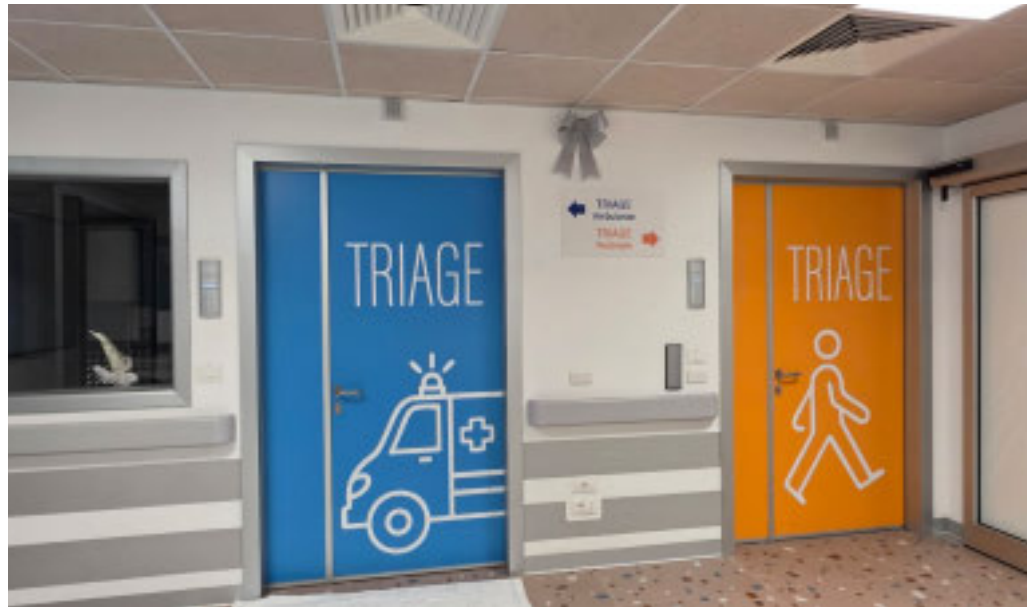
Il pronto soccorso di Imperia è stato completamente rinnovato

Lo spostamento sarà gestito attraverso un'organizzazione dedicata che vedrà il coinvolgimento del personale del Pronto Soccorso, potenziato per l'occasione, in coordinamento con la Direzione Medica di Presidio e l'Ufficio Professioni Sanitarie. Nelle fasi cruciali del trasloco saranno mantenute operative, in parallelo, alcune attività di assistenza in entrambe le sedi per assicurare la piena risposta alle necessità assistenziali durante tutta la durata delle opera-