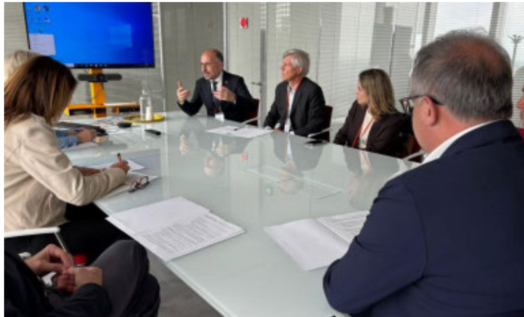
L'incontro al Grattacielo della Regione Piemonte

Il sindaco Rasero: «La Variante generale al Piano Regolatore è una scelta strategica per il futuro»