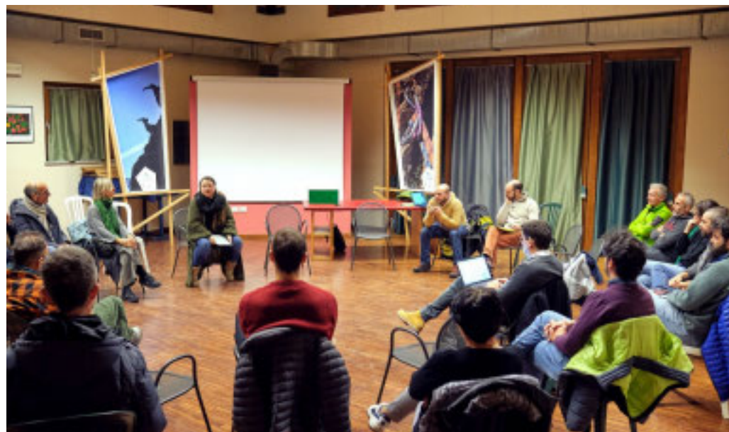
Un momento della riunione avvenuta in Porta di Valle - Segnavia di Brossasco

gnolo di tante volontarie e volontari che hanno dedicato il loro tempo e la loro passione nel promuovere campagne di sensibilizzazione e di raccolta fondi in difesa dei diritti dei bambini in ogni parte del mondo. Questo impegno è stato sostenuto negli anni dalla generosità dei cittadini e delle Istituzioni della provincia di Cuneo, che hanno sempre risposto ai nostri appelli e contribuito alle nostre iniziative. Anche in questa occasione le offerte raccolte saranno interamente destinate ai programmi di sviluppo e tutela