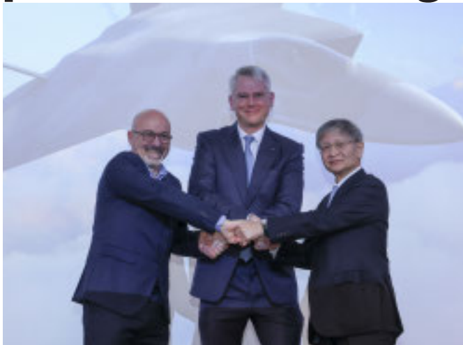
L'accordo firmato a Londra, a sinistra Cingolani