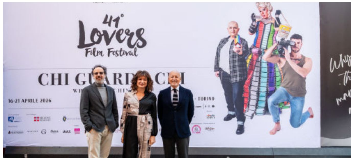
Il festival cinematografico, che si apre oggi, è giunto quest'anno alla sua quarantunesima edizione

«Lovers è oggi non solo una vetrina cinematografica, ma anche un luogo di incontro e dialogo», sottolineano il presidente del Museo Nazionale del Cinema Enzo Ghigo e il direttore Carlo Chatrian, evidenziando come la rassegna contribuisca a promuovere inclusione, ri-