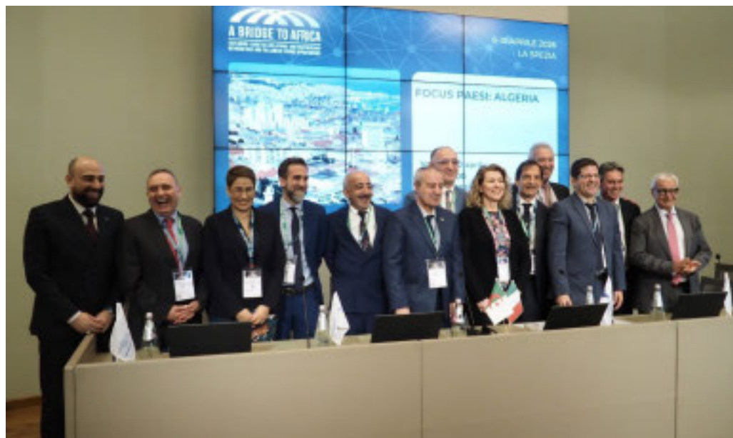
Molto numeroso il parterre dei relatori, anche istituzionali

Settecento partecipanti tra operatori, istituzioni e stakeholder internazionali