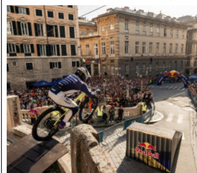
IL CIRCUITO URBANO Più spettacolare al mondo

Torna il Red Bull Genova Cerro Abajo Terzo anno consecutivo a Genova per il percorso mozzafiato