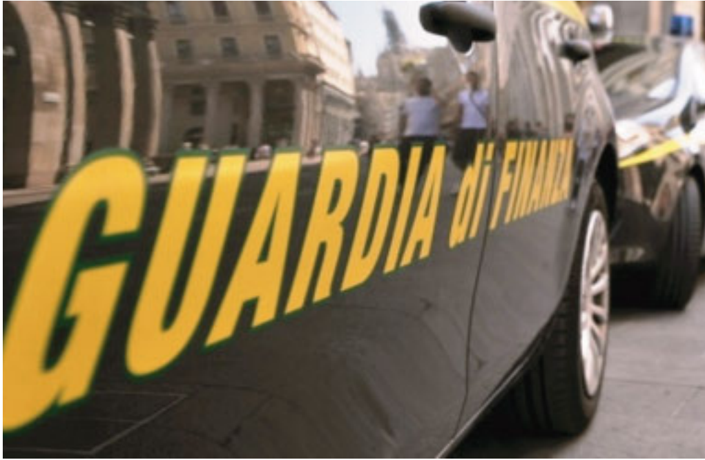
La Guardia di Finanza in azione contro i crimini