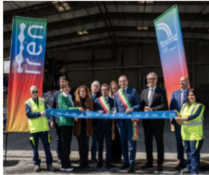
Il nuovo impianto può trattare fino a 10 tonnellate di carta all'ora, 66.500 tonnellate all'anno

Questa tecnologia consente di distinguere anche materiali apparentemente simili, ma destinati a filiere differenti, come spiegano i tecnici,