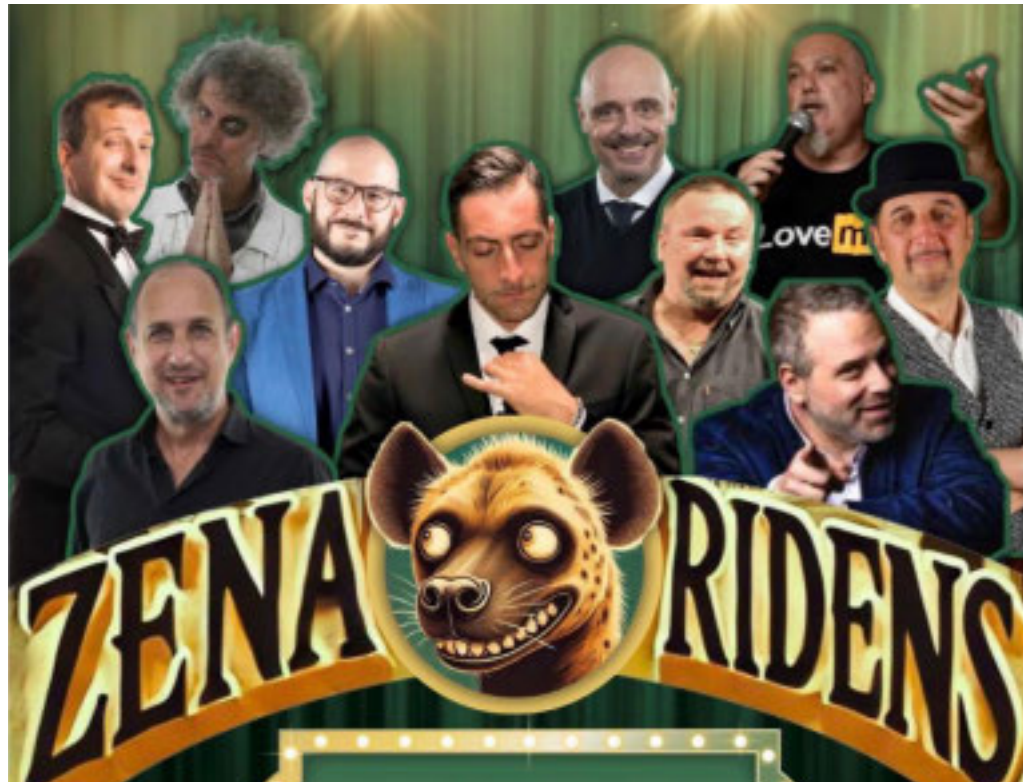
La locandina dell'evento che si terrà al Carlo Felice di Genova