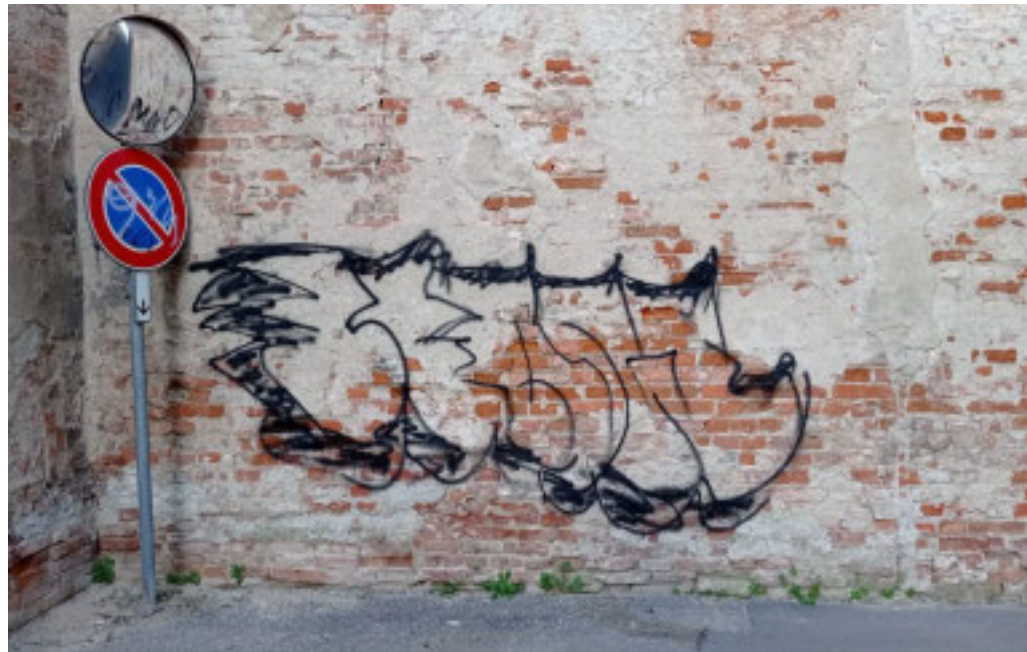
Il muro imbrattato dell'ex Caserma Baronino

Il giovane è ritenuto responsabile di imbrattamento di immobile pubblico e resistenza a pubblico ufficiale