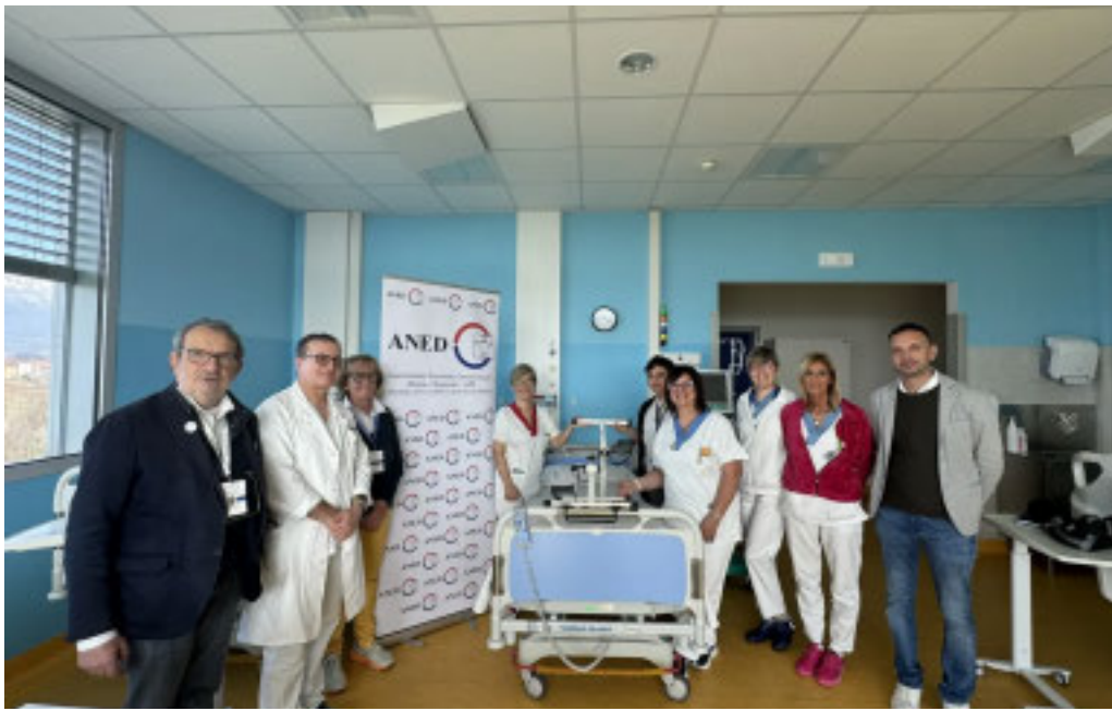
In foto i rappresentanti di Aned e il personale della Nefrologia e Dialisi

mento importante. Le mini bike rappresentano un'opportunità concreta per migliorare la qualità della vita di chi ogni giorno affronta la malattia. Anche un piccolo movimento, per chi è costretto a letto o a lunghe ore di trattamento, può significare benessere fisico, autonomia e dignità. Dietro a questo traguardo c'è un grande lavoro fatto di dedizione e attenzione ai bisogni dei pazienti. Un ringraziamento va all'ASL BI, che ha dimostrato apertura al dialogo e disponibilità alla