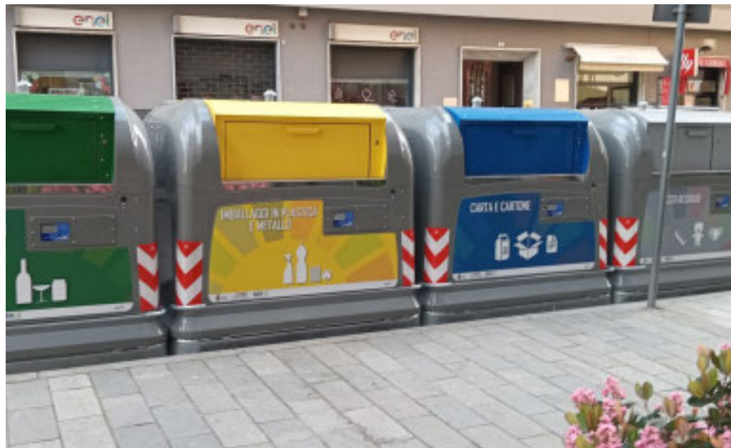
I bidoni «intelligenti» sistemati dalla Seas in centro città

Affidato l'incarico ad un avvocato la valutazione dei documenti legali