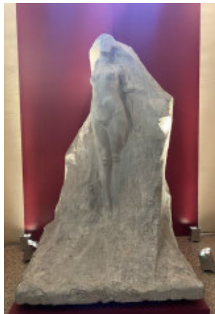
Un'opera esposta alla mostra

Per ulteriori informazioni: www.comune.casale-monferrato.al.it/labellezaliberata