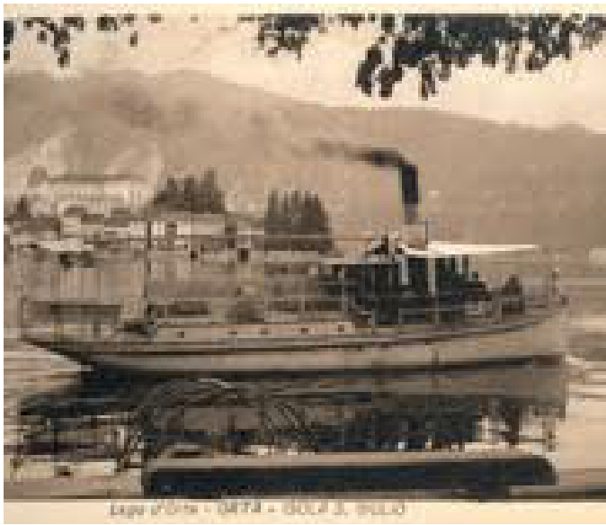
Il Battello Riviera

«Occorreva - spiega Morea - trovare però l'imbarcazione, di struttura possente, nobile di presentazione, imponente ed elegante: tutti requi-