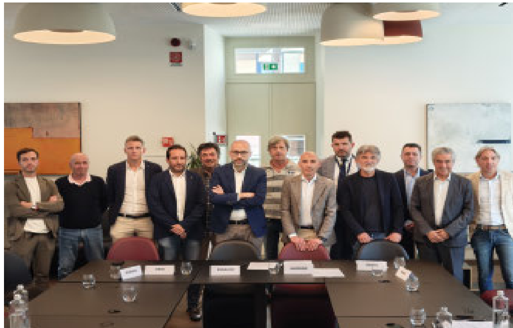
Gli imprenditori di Ance Cuneo, sezione strade e asfalti