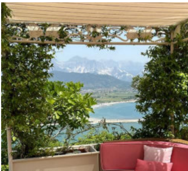
Uno scorcio della villa ligure dell'avvocato dei vip

Tre malviventi hanno picchiato e sequestrato il custode, che era solo