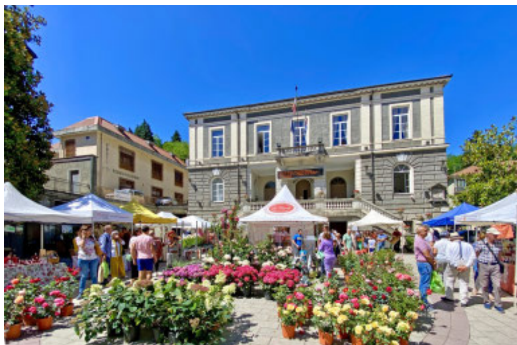
Piazza Macciò è uno dei luoghi della festa

Punto centrale della festa è l'immane Sagra delle Antiche Rose della Valle Scrivia interamente organizzata dalla Pro Loco nella tensostruttura della Piccola Velocità adiacente a piazza Colombo dove, sabato a pranzo e cena e domenica a pranzo, sarà possibile gustare uno squisito menu a tema: dai formaggi serviti per antipasto con confettura e gelatina alle rose, al risotto alle rose con assaggio dell'ormai celebre pesto rosa lanciato proprio in occasione della Festa di due anni fa, per proseguire con