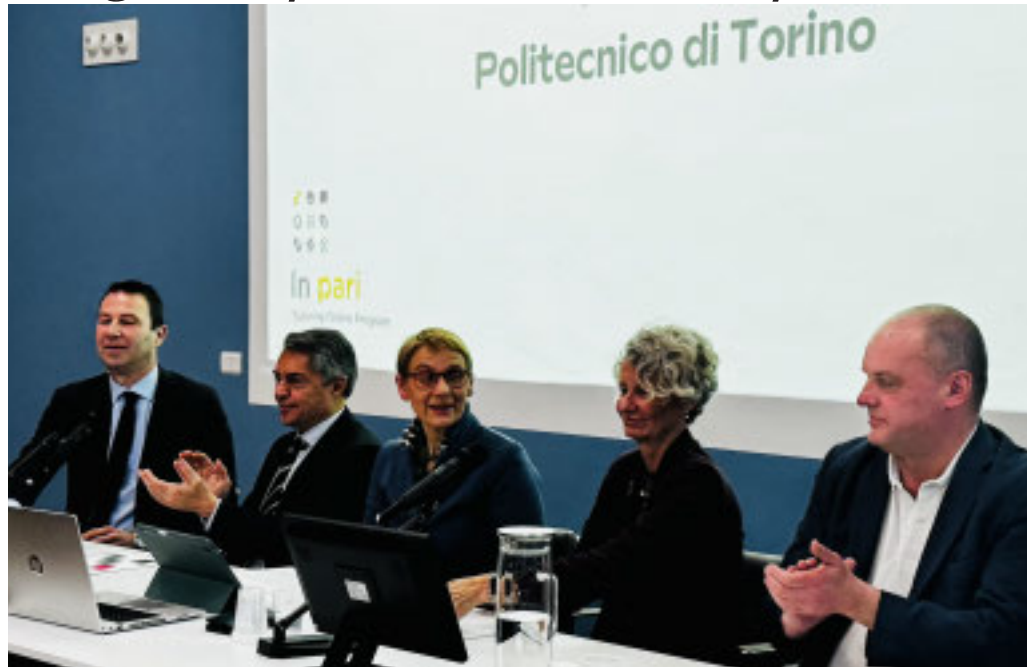
La presentazione della nuova iniziativa

Parte il programma «In pari - Tutoring Online Program» per contrastare le povertà educative