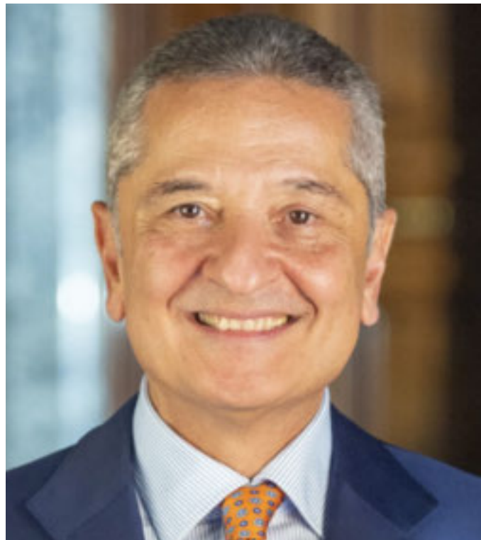
Il governatore Fabio Panetta

Al Centro Congressi di Torino Lingotto, Fabio Panetta ha anche parlato del pesante impatto dei dazi di Trump sul Pil globale