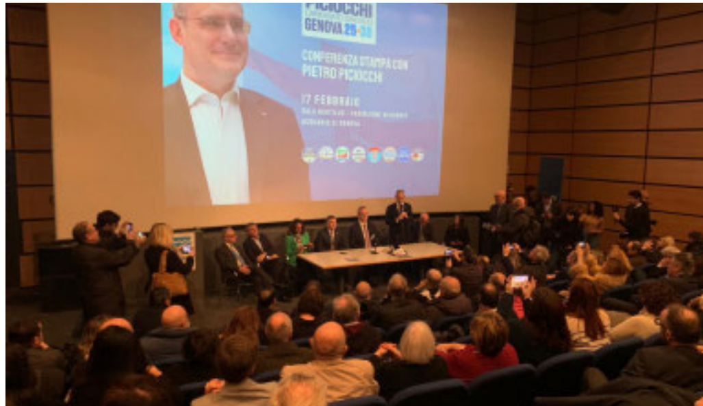
La presentazione del candidato del centrodestra a sindaco di Genova, Pietro Piciocchi

La presentazione ufficiale nella corsa alla carica di primo cittadino per il centrodestra con l'obiettivo chiaro: «Indietro non si torna»