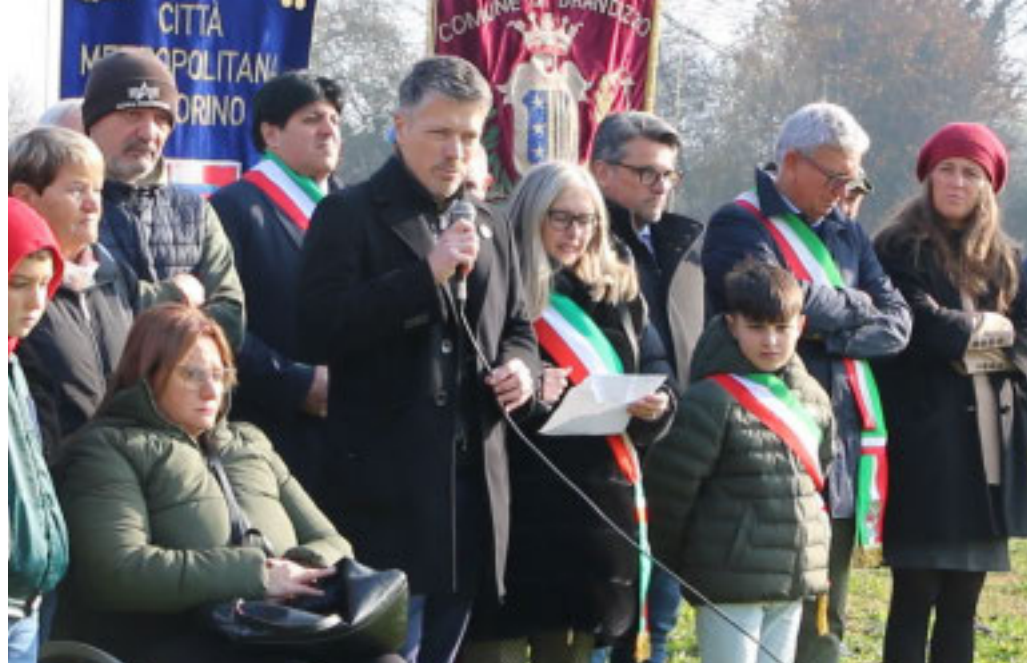
La cerimonia all'interno del Parco Bresso con i bambini della scuola 'Gianni Rodari'

Un'area verde ricorda le cinque vittime della strage del 30 agosto 2023. Donati cinque tigli dalla Filca