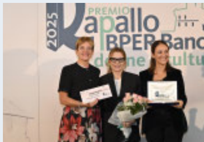
Teresa Ciabatti 1° Premio Narrativa