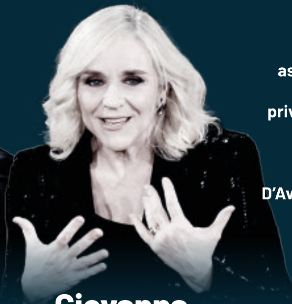
Giovanna Botteri Giornalista