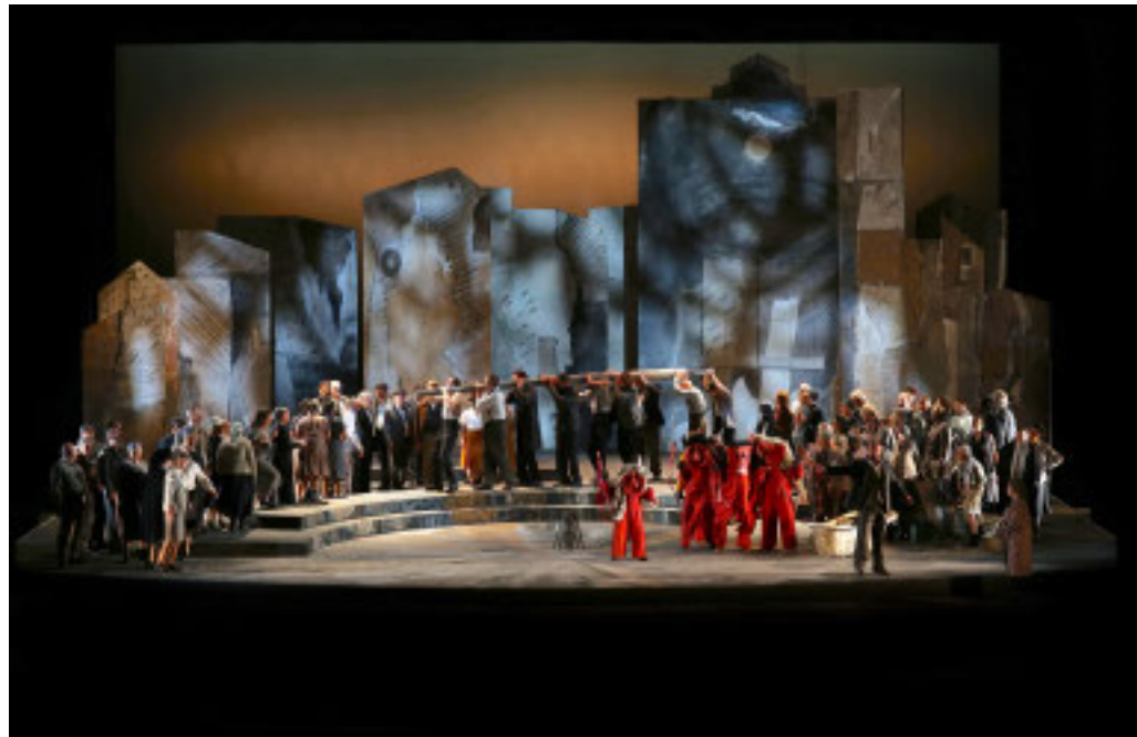
Nella produzione di Teatrialchemici un'esperienza immersiva per lo spettatore

La passione verista tra miti ancestrali e tradizioni popolari torna in scena al Teatro Carlo Felice di Genova con Cavalleria rusticana di Pietro Mascagni, su libretto di Giovanni Targioni Tozzetti e Guido Menasci, in programma da venerdì 14 novembre alle ore 20 Turno A (repliche: sabato 15 novembre ore 15 Turno F, domenica 16 novembre ore 15 Turno C, venerdì 21 novembre ore 20 Turno B, sabato 22 novembre ore 20 Turno L e domenica 23 novembre ore 15 FA1). L'opera, tratta dall'omonima novella e dal dramma di Giovanni Verga, segnò con il suo debutto nel 1890 l'esplosione del verismo musicale italiano: un cambiamento di prospettiva che porta al centro della narrazione la realtà popolare e la forza diretta delle passioni. L'allestimento è la ripresa della produzione realizzata dal Teatro Carlo Felice nel 2019 a firma di Teatrialchemici - Luigi Di Gangi e Ugo Giacomazzi, artisti che da anni nel loro lavoro coniugano linguaggio teatrale, gesto e rito, trasformando l'opera in un'esperienza corale e immersiva. Le scene sono di Federica Parolini, i costumi di Agnese Rabatti e le luci di Luigi Biondi; assistente alla regia Francesco Traverso, ai costumi Anna Varaldo. La direzione musicale è affidata a Davide Massiglia, sul podio dell'Orchestra e del Coro del Teatro Carlo Felice, preparato da Claudio Marino Moretti. Nel cast, Vero-