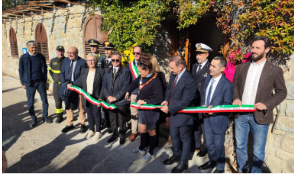
Il momento del taglio del nastro per l'avvio dei lavori