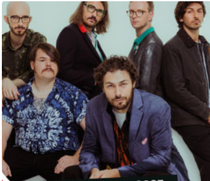
GRUPPO POP I Pinguini Tattici Nucleari

«Sono davvero felice di poter annunciare che quest'anno Genova festeggerà il Capodanno con un grande concerto dei Pinguini Tattici Nucleari in piazza della Vittoria - dichiara la sindaca di Genova Silvia Salis - Saluteremo il 2025 e daremo il benvenuto al 2026 insieme, con una grande festa pensata per far vivere alla nostra città una notte di musica, divertimento e partecipazione. Un Capodanno all'altezza di Genova, della sua energia e della sua voglia di stare insieme. Ringrazio tutti coloro che stanno lavorando all'organizzazione del «Genova Countdown 2026», una grande occasione per promuovere la nostra città a livello nazionale. Se siete genovesi, restate in città: sarà una serata da non perdere. E se non lo siete ora sapete dove andare a festeggiare il Capodanno: vi aspettiamo in piazza della Vittoria».