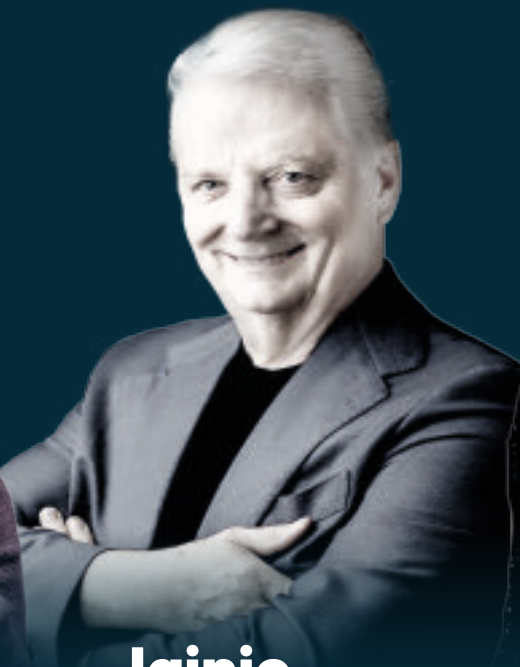
Iginio Massari Chef pasticciere