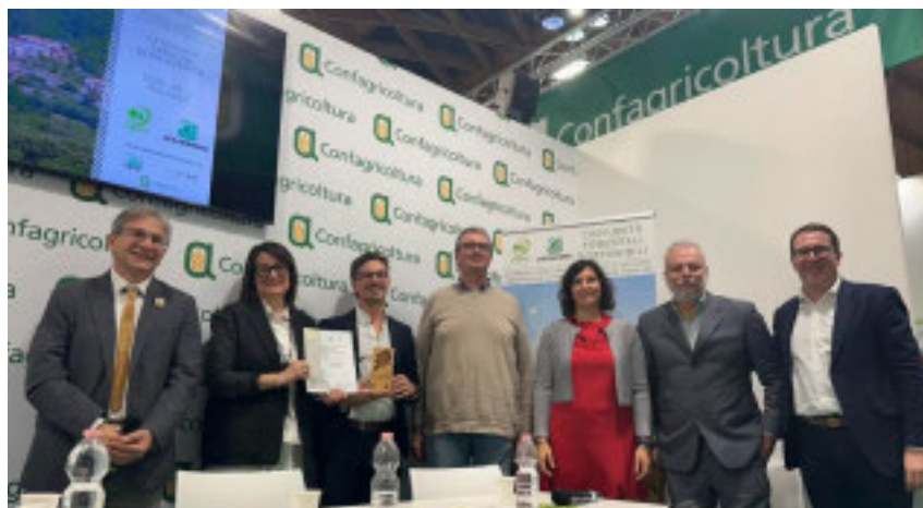
Il personale del Comune di Vendone ha ritirato il premio

Il premio nasce con l'obiettivo di valorizzare le realtà che si distinguono per l'impegno profuso nella gestione so-