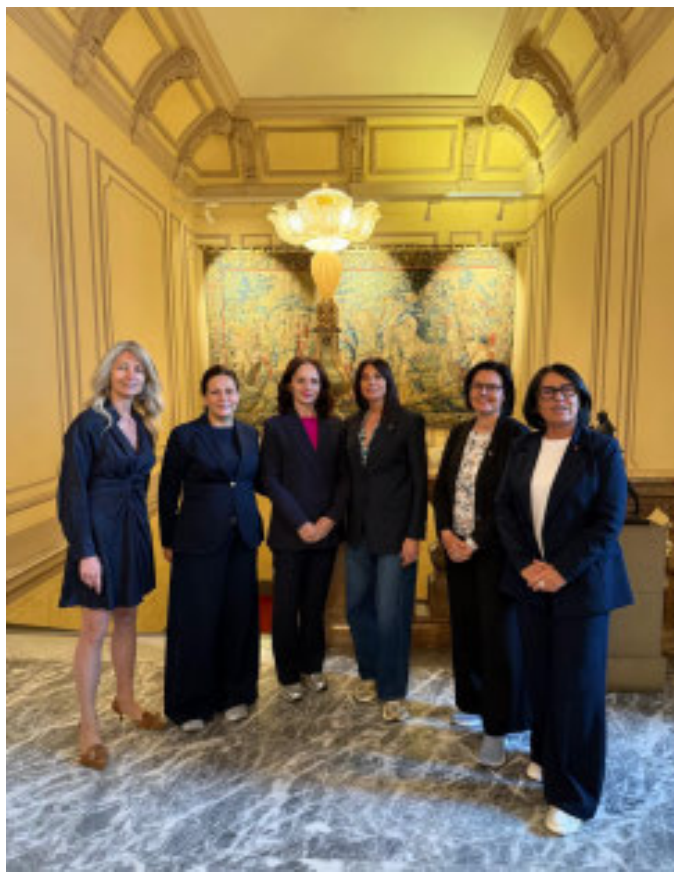
Le consigliere regionali di Fratelli d'Italia