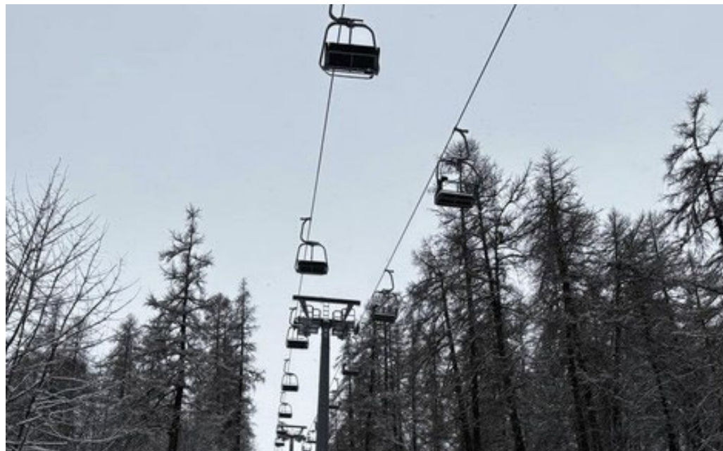
La seggiovia di Monesi indispensabile per il rilancio delle Alpi Marittime

no su tutto il tessuto economico e sociale di Monesi e delle valli circostanti. Il turismo, sia estivo che invernale, ha bisogno di infrastrutture funzionanti e accessibili. La seggiovia rappresenta il punto di partenza ideale per escursioni, sport sulla neve, attività naturalistiche e paesaggistiche, ma anche per iniziative culturali e promozione enogastronomica del territorio. Monesi, un tempo definita «la piccola Limone del Ponente Ligure», potrebbe finalmente tornare ad avere un ruolo centrale nella mappa del turismo alpino ligure-piemontese, rilanciando anche le piccole imprese locali: rifugi, bed & breakfast, ristoranti, agriturismi, guide ambientali, artigiani.