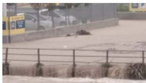
Fiume esondato a Finale Ligure

Fiumi esondati e smottamenti. Sono state soprattutto il finalese e il pietrese le zone più colpite dal passaggio della perturbazione annunciata dall'Arpal. A Rialto, via Berea è chiusa nel tratto compreso tra località Berea e il bivio con via Costa a causa di uno smottamento sulla carreggiata. Frane segnalate anche a Tovo San Giacomo soprattutto nella zona di Bardino Vecchio. Smottamenti anche in zona Briffi sempre a Bardino Vecchio e nella zona della Bringhiera (via Rocca). Le criticità maggiori si sono verificate a Finale Ligure dove è esondato il fiume Pora. Il corso d'acqua ha oltrepassato gli argini all'altezza del supermercato Eurospin. La strada che conduce a Calice Ligure è stata allagata e quindi chiusa al traffico. Anche il ponte di ferro è chiuso alla circolazione viaria. Sem-