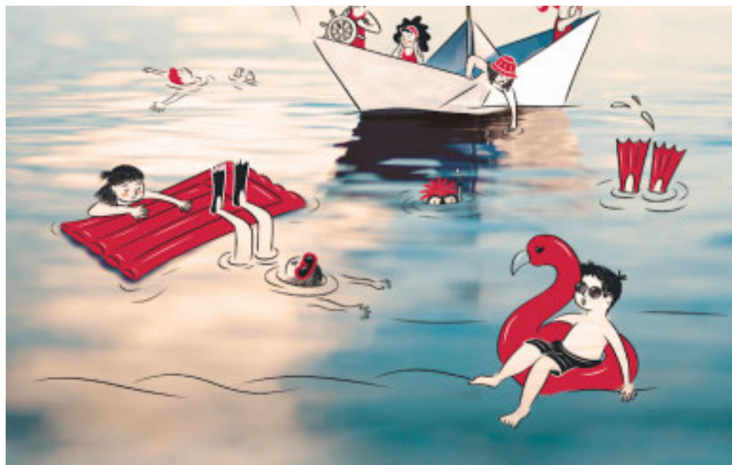
La locandina dell'iniziativa

Durante il soggiorno, le mamme si prendono cura dei loro bambini in un contesto sereno e sicuro, sostenute da educatori che le affiancano nel rafforzamento delle loro competenze genitoriali, senza sostituirsi nel ruolo di cura. I più piccoli vivono momenti di spensieratezza, gioco e divertimento in gruppo e con le loro mamme.