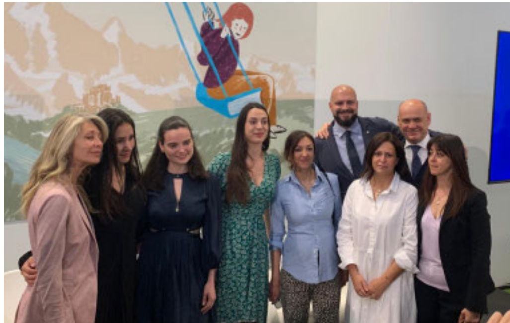
L'evento con il Collettivo Nemesis alla kermesse letteraria

Fdi: «Nessun cachet per le tre ospiti del Collettivo Nemesis. Il femminismo non è di vostra proprietà»