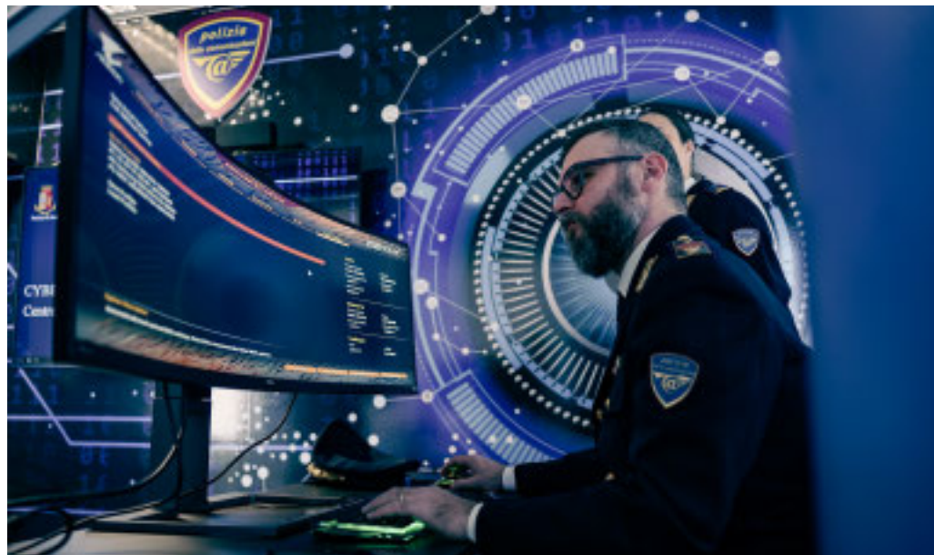
Registrato un aumento esponenziale degli attacchi cibernetici in tutta la regione

■ Il porto, l'aeroporto Cristoforo Colombo, l'Università di Genova. Sono tre dei tanti obiettivi sensibili che nel corso del 2024 sono stati messi al tappeto dai cyber criminali che non hanno risparmiato neanche la Liguria. Sono gli hacker del gruppo Ransomhub che, nella scena cyber, hanno iniziato ad essere monitorati nel mese di febbraio 2024. Oltre 300 rivendicazioni criminali all'attivo. Ed è proprio la sicurezza informatica, in Liguria, ha subito una preoccupante escalation di attacchi e frodi digitali nel corso dell'anno appena concluso. La regione è stata teatro di attacchi informatici che hanno colpito sia istituzioni pubbliche che privati, mettendo in luce la crescente vulnerabilità di fronte a una cybercriminalità sempre più strutturata e pericolosa. Nel mirino anche aziende e cittadini che si trovano ogni giorno a fare i conti con una realtà