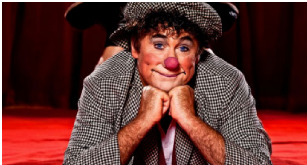
Un artista capace di coinvolgere ogni volta il pubblico dalla prima all'ultima fila