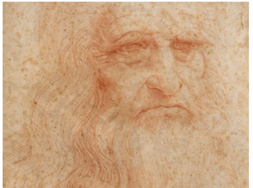
Si potranno ammirare virtualmente opere come 'Autoritratto' (in foto) e 'Codice sul volo degli uccelli'

'Orazio Gentileschi. Un pittore in viaggio' è il titolo dell'esposizione, allestita nelle Sale Chiabrese, che si concentrerà sul maestro toscano, la cui straordinaria qualità