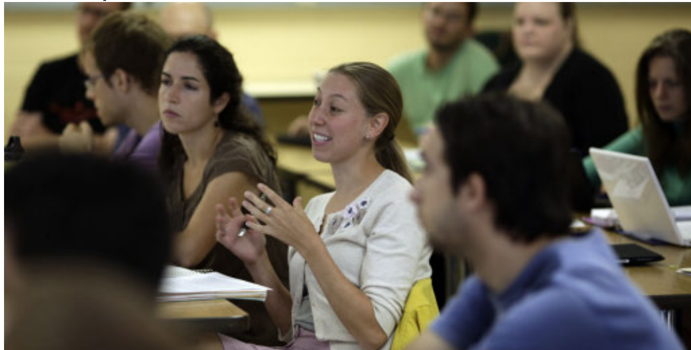
Altri investimenti in favore degli istituti scolastici da parte della Giunta Cirio

La Regione Piemonte stanziava nuovi fondi per studenti ad alto potenziale, a rischio ritiro sociale e con sordità