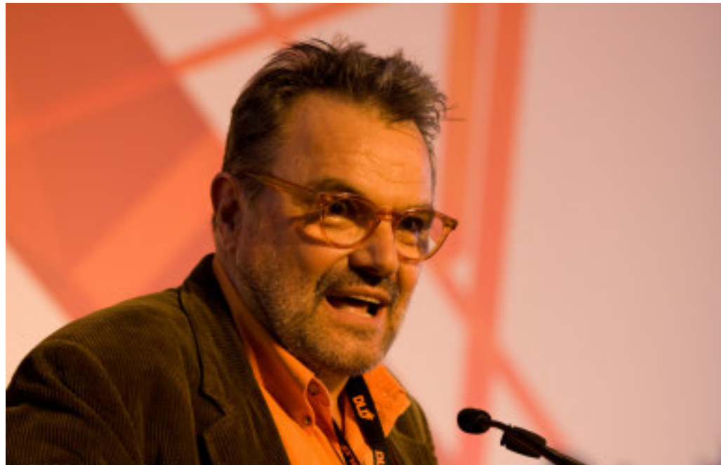
Il fotografo milanese Oliviero Toscani, scomparso lo scorso 13 gennaio

In questo momento di dolore per la sua prematura scomparsa, il Politecnico ricorda il famoso artista con commossa gratitudine per la fiducia che ha dimostrato nei confronti dell'Ateneo, affidandogli questo importantissimo progetto per la conservazione e la diffusione della sua vasta opera. A partire dal mese di maggio 2024 - grazie alla collaborazione con la società