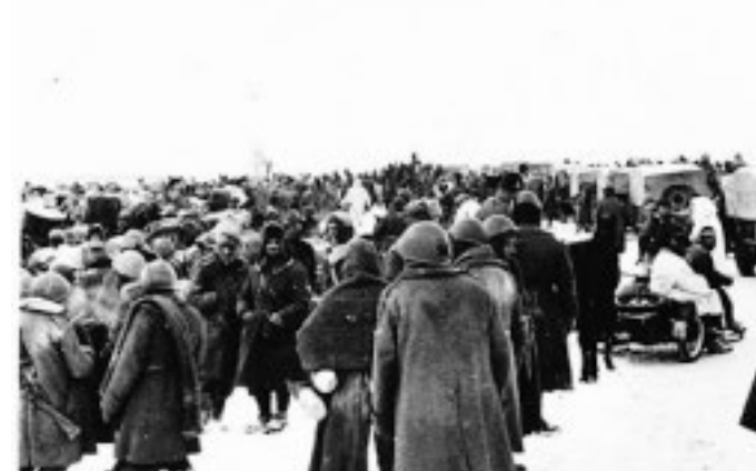
Immagine di repertorio di Nowo Postojalowka

panti e il regolare svolgimento della manifestazione, saranno adottate le seguenti modifiche alla viabilità cittadina.