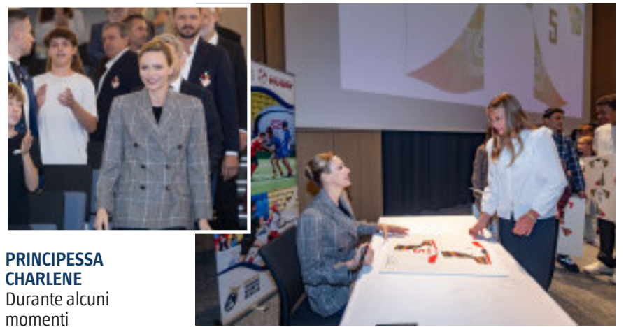
PRINCESSA CHARLENE Durante alcuni momenti della giornata insieme ai ragazzi delle scuole medie inferiori

riceverà inoltre una maglia autografata dai giocatori della nazionale.