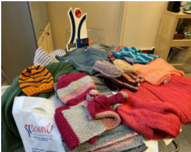
ALCUNI CAPI Realizzati dalle volontarie e dai volontari

Al via la sesta edizione dell'iniziativa dell'associazione «50&Più»