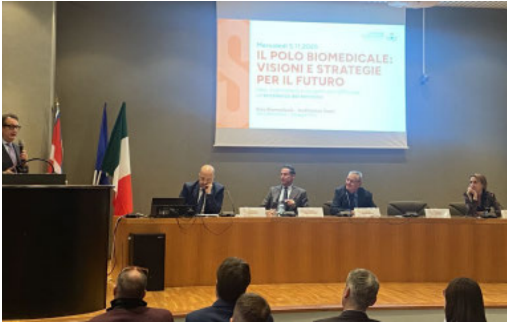
Un momento della presentazione

Da oltre vent'anni Confindustria Novara Vercelli Valsesia è infatti al fianco delle imprese del Polo Biomedicale di Saluggia, promuovendo azioni concrete a tutela dello sviluppo dell'area.