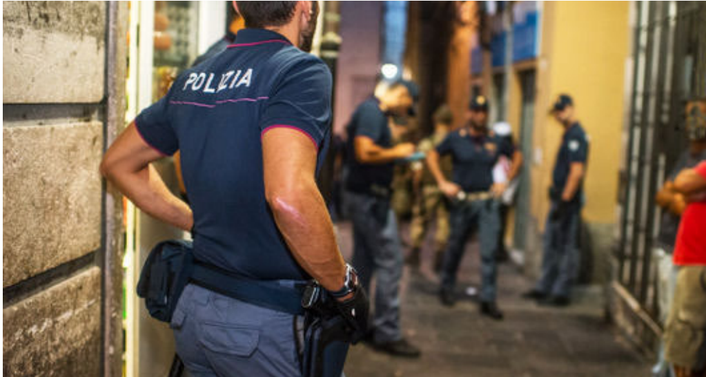
La polizia nel centro storico