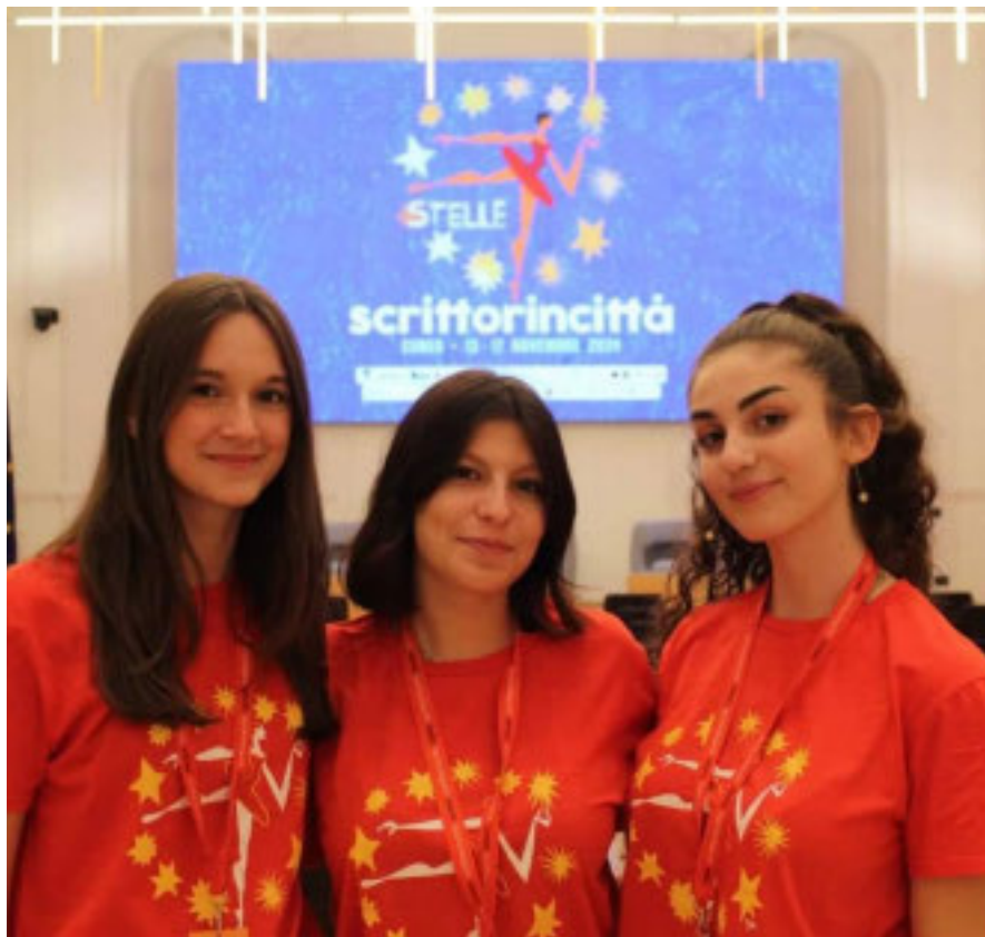
Una foto dell'edizione del 2024

main sponsor Fondazione CRC e Fondazione CRT, dagli sponsor Confindustria Cuneo, Confcommercio Cuneo, dagli sponsor tecnici Open Baladin, Birra Baladin, Auto Mattiauda, Cuneo Rent, Informatica System, Castelmar, Copro, Gufram, Coldiretti Cuneo. Ed è realizzata in collaborazione con ABL-Associazione Amici delle Biblioteche e della Lettura ODV ETS, Europe Direct Cuneo, Fondazione Artea, Promocuneo, ACDA, ALC-Associazione Librai Cuneo e ATL-Azienda Turistica Locale del Cuneese. La manifestazione è realizzata con il Patrocinio della Rappresentanza a Milano della Commissione Europea; La Stampa e Rai Radio Kids sono media partner e Radio GRP la radio ufficiale.