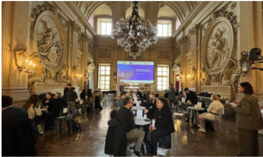
L'evento è stato organizzato da Ceipiemonte

Un approccio che trova piena sintonia con la strategia di Ceipiemonte, come spiega il