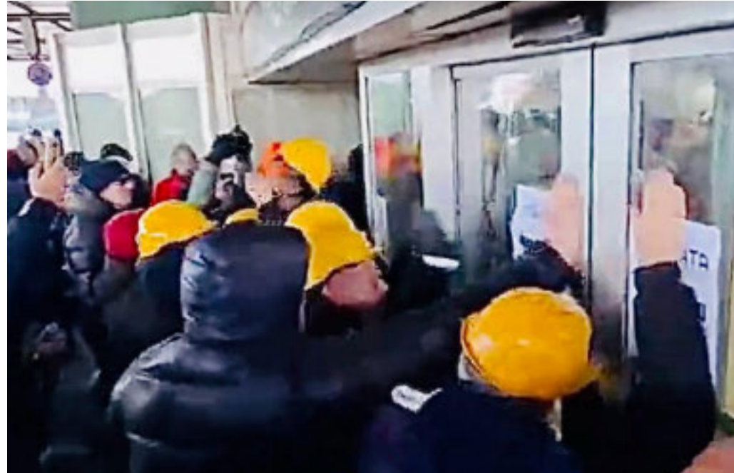
La protesta dei lavoratori si è allargata fino ad arrivare all'autostrada e all'aeroporto

Giornata infernale per il traffico, autostrada e Aurelia interrotte. «No al ciclo corto», cortei e proteste