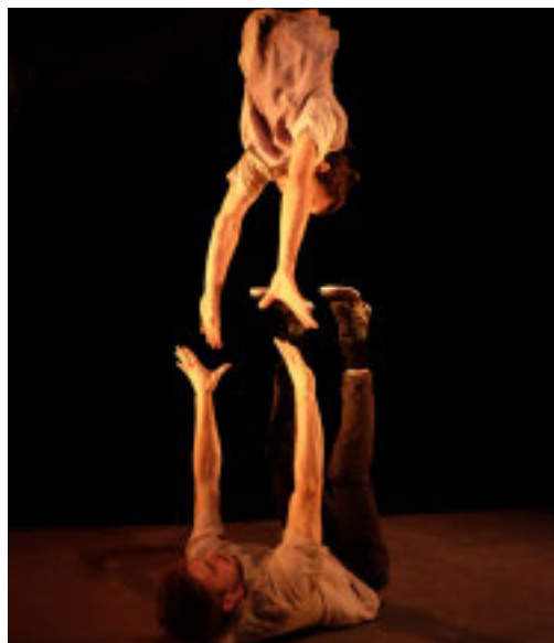
«Carré de je», uno spettacolo della Kirn Company

In programma, sette prime nazionali. Si apre il 6 dicembre con la danza acrobatica e gioiosa di «Carré de je», uno spettacolo della Kirn Company (Francia) che grazie alla collaborazione del Teatro Necessario di Genova sarà presentato in una location molto particolare: il carcere di Marassi, in calendario una pomeridiana esclusivamente dedicata ai detenuti e una serale aperta al pubblico. Si continua fino a capodanno con molte altre premiere: