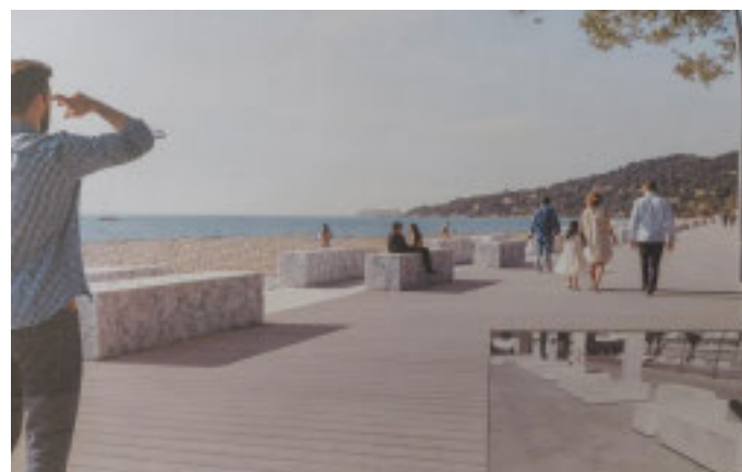
Un render di come sarà la nuova passeggiata

coperta dai sedimenti della spiaggia, aumenterà quella della passeggiata (dove sarà ammesso anche il transito ciclabile) la quale discenderà gradualmente verso la spiaggia, le cui dimensioni resteranno invariate. La nuova passeggiata, costruita in legno ricomposto, poggerà su una sottostruttura