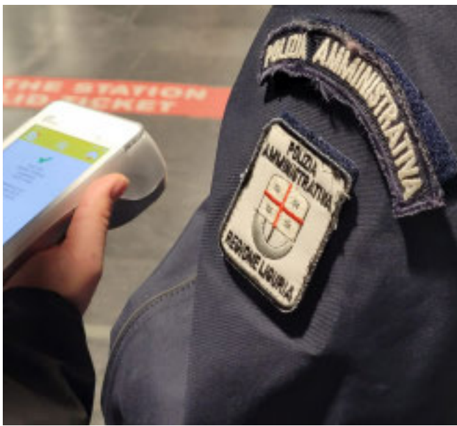
VERIFICATORI Di Amt in attività

Verifiche sulla Metro: 229 senza biglietto Ieri i controllori hanno svolto controlli per 4 ore a De Ferrari