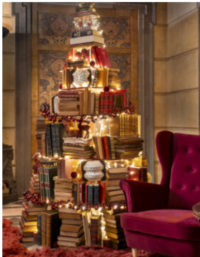
La biblioteca ispira racconti magici di Natale

Dalla suggestiva biblioteca, al Giardino d'Inverno, fino alle opere d'arte di chef Mesiano