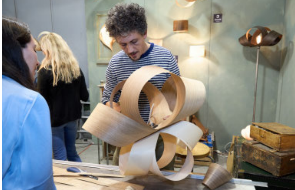
L'edizione 2025 ospita oltre 2.800 artigiani provenienti da 90 Paesi

Oltre ottanta imprese alla manifestazione a Rho per promuovere creatività e tradizioni regionali