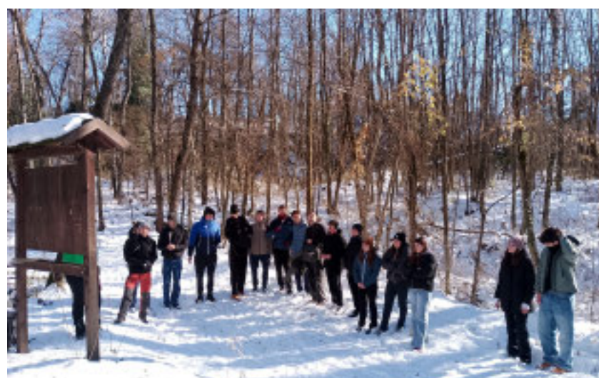
Alunni e insegnanti sul sentiero tematico dedicato al rapporto tra persone, territorio e tutela dell'ambiente

■ Venerdì 12 dicembre dalle 17, presso la sala comunale di Demonte (via Martiri e Caduti per la Libertà, 13), è in programma l'evento conclusivo del progetto "I diritti in natura", un percorso educativo e territoriale promosso dal Club per l'UNESCO di Cuneo, con il patrocinio del Comune di Demonte, dell'Unione Montana Valle Stura, dell'ATL, del CeSPeC di Cuneo e realizzato grazie al contributo della Fondazione CRC. Il progetto ha coinvolto un gruppo di studenti e docenti dei licei "Pellico-Peano", "De Amicis" e "E. Bianchi" di Cuneo, che - con il supporto dell'associazione Lou Viage - hanno recuperato e curato un sentiero tematico dedicato al rapporto tra persone, territorio e tutela dell'ambiente, con l'obiettivo di rinsaldare un legame armonico e consapevole con la natura. L'intera cittadinanza è invitata a partecipare. Ingresso libero.