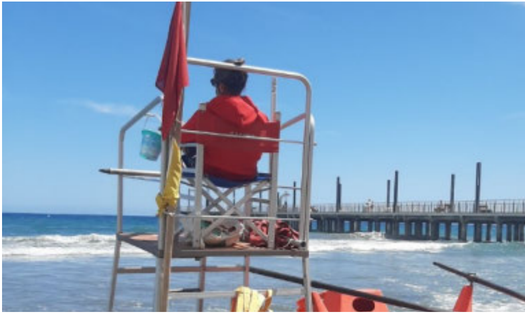
I trespoli degli stabilimenti della regione rischiano di rimanere vuoti