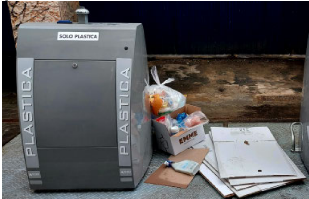
Continuano le polemiche sui servizi gestiti da Amiat

Il Consiglio Comunale affronta un'interpellanza generale sui disservizi di Amiat e sull'aumento Tari