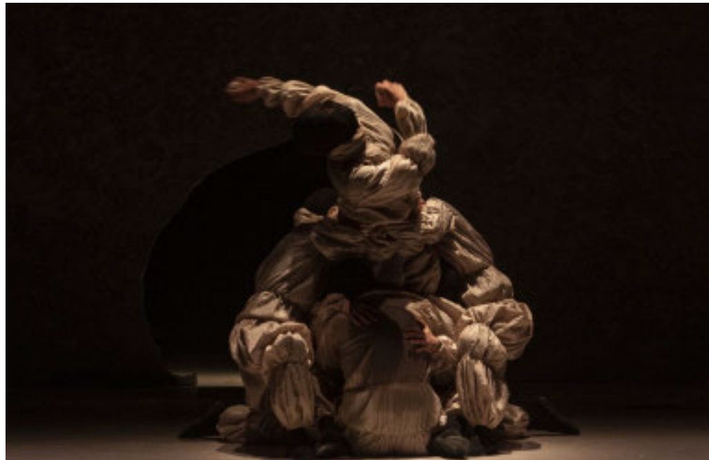
La compagnia Dewey Dell mette in scena un rituale primordiale

Il mistero della primavera e della violenta venuta al mondo della vita, in un conflitto tra suono e visione, tra la potente seduzione della musica e la furiosa energia dei corpi, tra danza e performing arts. In ogni metamorfosi e grande cambiamento dell'essere umano, la morte è sempre al fianco della vita, manifestandosi come un rito di passaggio o