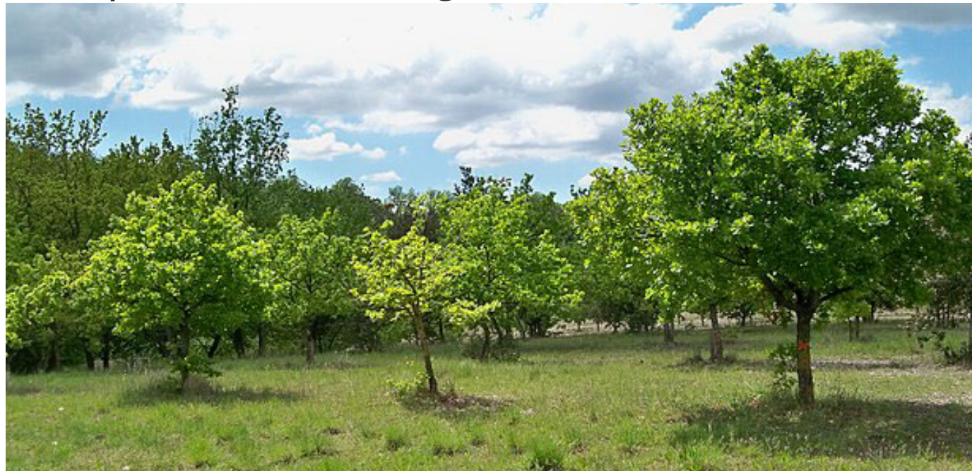
Querceti, saliceti e pioppeti sono indicati come gli ecosistemi forestali più favorevoli

Il progetto regionale punta a promuovere il già ricco patrimonio tartufigeno famoso in tutto il mondo