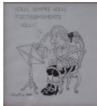
Una Vignetta di Forattini

vour, di libera matita in libero Stato. - ha esordito Florio che ha continuato - Eppure quando da sindaco proposi al consiglio comunale di conferirgli l'importante riconoscimento (allo-