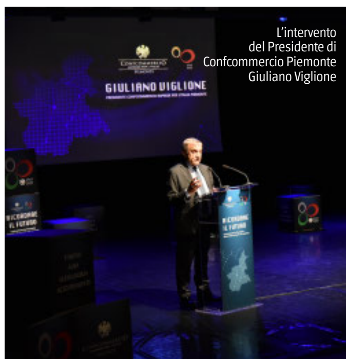
L'Intervento del Presidente di Confcommercio Piemonte Giuliano Viglione

sti. Innanzitutto, una normativa moderna, che aiuti il commercio tradizionale a ritrovare equilibrio rispetto alle liberalizzazioni dei primi anni Duemila, all'espansione della grande distribuzione e alla concorrenza delle piattaforme digitali. E poi una regolamentazione che valorizzi i territori, restituendo ai Comuni un ruolo attivo nella pianificazione degli insediamenti commerciali e nella rigenerazione urbana.