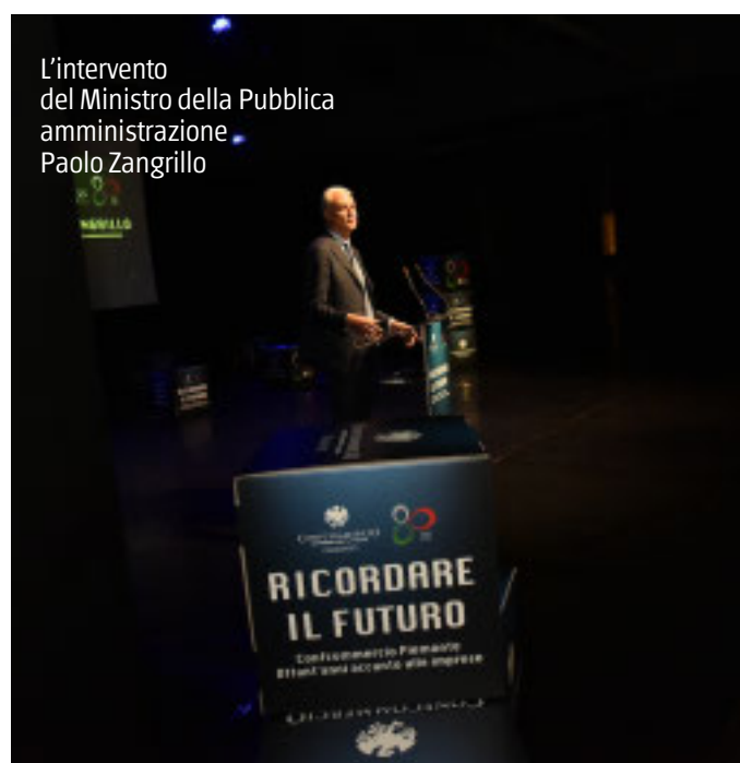
L'Intervento del Ministro della Pubblica Amministrazione Paolo Zangrillo

Un grande evento a Torino per testimoniare il forte impegno a sostegno delle imprese del territorio