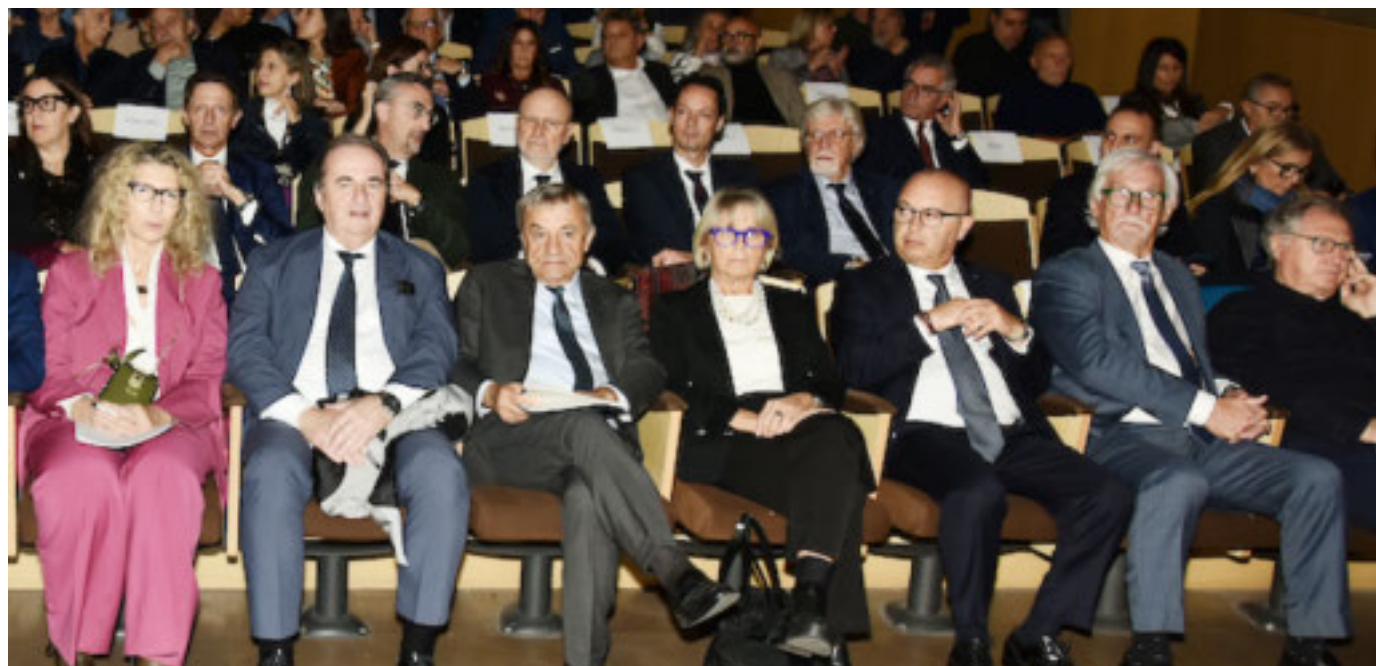
La platea per il grande evento a Torino per gli 80 anni di Confcommercio

Per quanto riguarda la nascita e la cessazione delle attività, il bilancio 2024 evidenzia una mortalità d'impresa pari a 14.396 cessazioni a fronte di 8.619 nuove iscrizioni.