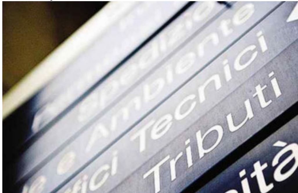
Gli azzurri condividono lo spirito dell'iniziativa, ma criticano la pressione fiscale sui Torinesi

Il Comune punta a una maggiore equità fiscale e a recuperare nuove somme da mettere a bilancio