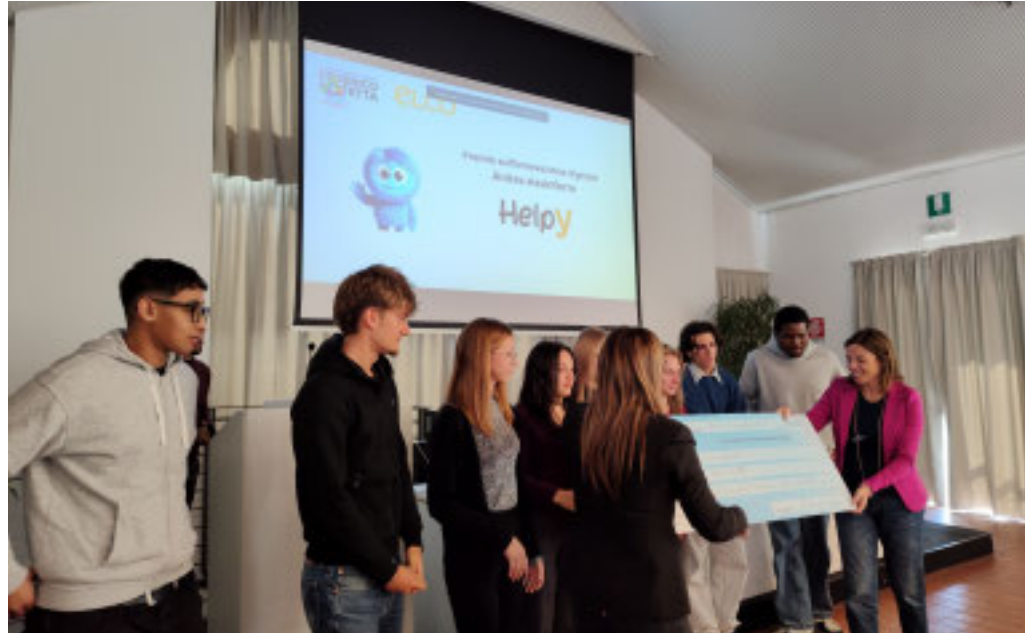
I ragazzi dell'Iis Patetta di Cairo Montenotte ricevono il premio per il progetto «Helpy»

A livello nazionale, dal 2017, anno di istituzione del concorso, sono stati coinvolti nell'ini-