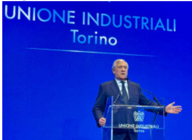
Il vicepremier Antonio Tajani

Il vicepremier Tajani e i ministri Urso e Pichetto vogliono far tornare Torino capitale dell'industria