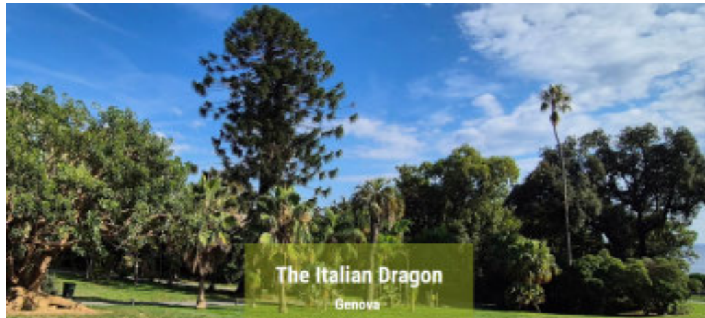
Il maestoso albero nei Parchi di Nervi, noto come The Italia Dragon

Con l'Araucaria di Nervi partecipa al contest nazionale «Italian Tree of the year 2024»