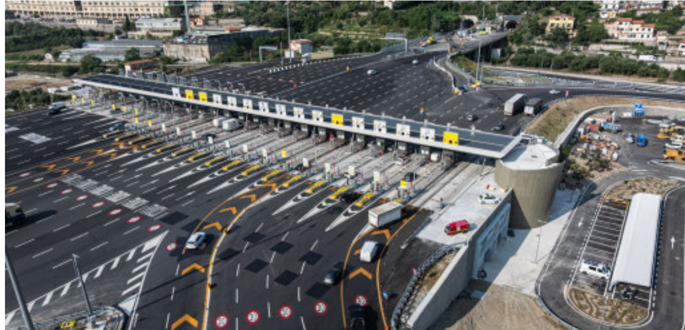
La barriera di Ventimiglia vista dal lato dell'Italia

Più esattori in pista nei periodi critici, visto che solo il 40% usa il telepedaggio. Si valuta ampliamento di una rampa