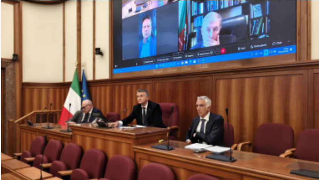
Il viceministro Rixi a Roma, in collegamento con i sindaci del Ponente e con il presidente Bucci

■ «Al Parlamentino del Ministero delle Infrastrutture e dei Trasporti, ho incontrato tutti i protagonisti civili e istituzionali coinvolti nel progetto di raddoppio ferroviario tra Finale Ligure e Andora. È stato un confronto costruttivo, segnato da ascolto e dialogo, due valori fondamentali per portare avanti un'opera di questa portata nel rispetto dei territori e delle comunità locali. Quest'intervento, atteso da oltre 50 anni, non è più rinviabile: un tassello fondamentale per il futuro della mobilità, in grado di migliorare i collegamenti verso l'estero, sostenere l'economia e ridurre l'impatto ambientale del trasporto su gomma», ha detto ieri il deputato e viceministro al Mit Edoardo Rixi durante l'incontro al Ministero a cui hanno partecipato 13 sindaci del Savonese, i presidenti della Regione Liguria e della Provincia di Savona, gli amministratori delegati di Rete Ferroviaria Italiana e Italferr, il commissario straordinario di governo Vincenzo Macello, l'assessore regionale alle Infrastrutture Giacomo Giampedrone e, in videocollaborazione l'assessore ai Trasporti e all'Urbanistica Marco Scajola, e i vertici locali delle associazioni di categoria coinvolti dall'opera. «Oggi abbiamo la responsabilità di trasformare un sogno in realtà, lavorando insieme per superare ogni ostacolo e dare finalmente al nostro territorio la mobilità che merita. Un'opera che non