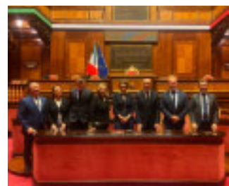
La delegazione al completo