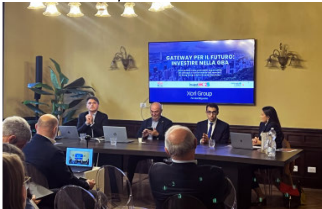
Un momento del convegno

Collaborazione, tecnologia e crescita sostenibile all'incontro ospitato nella sede torinese di Xori Group