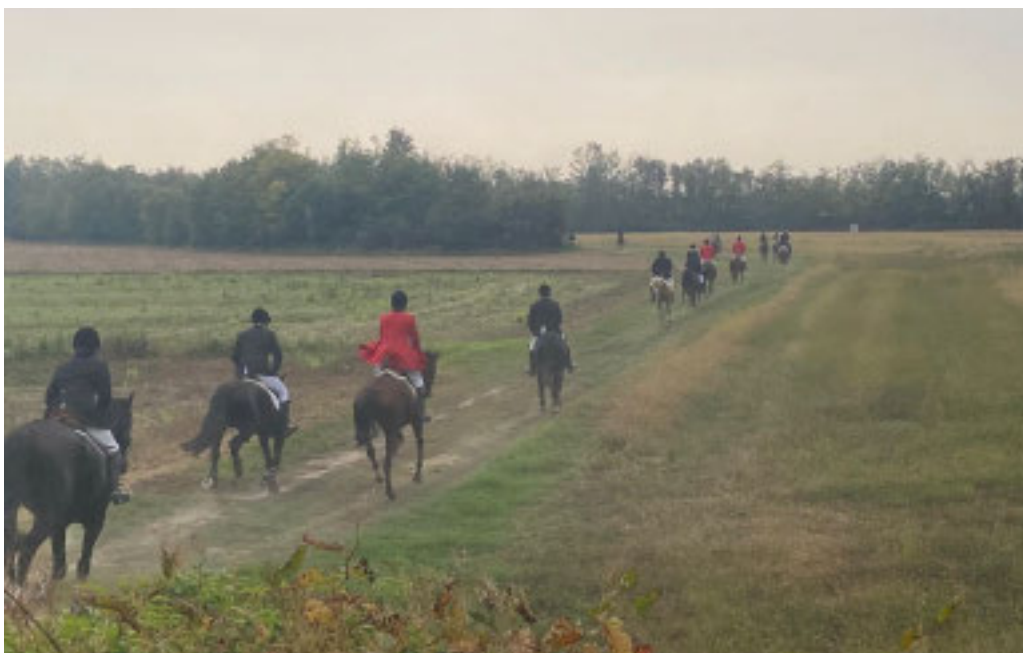
Un momento della «caccia»

Questa edizione del 2025 ha visto la partecipazione di un folto numero di cavalieri, amazzoni e cavalli, a testimonianza di quanto la passione per l'equitazione sia sempre viva. La collaborazione con la Società Milanese per la Caccia a cavallo e Società Cacce a Cavallo nel Monferrato ha arricchito ulteriormente l'evento, portando sul campo anche una decina di giovanissimi ragazzi, vestiti con le tradizionali bardature, pronti a sfidarsi con determinazione e spirito di squadra. Un'occasione speciale per vedere crescere nuovi talenti nel mondo equestre, un passaggio di testimone che guarda al futuro della disciplina.