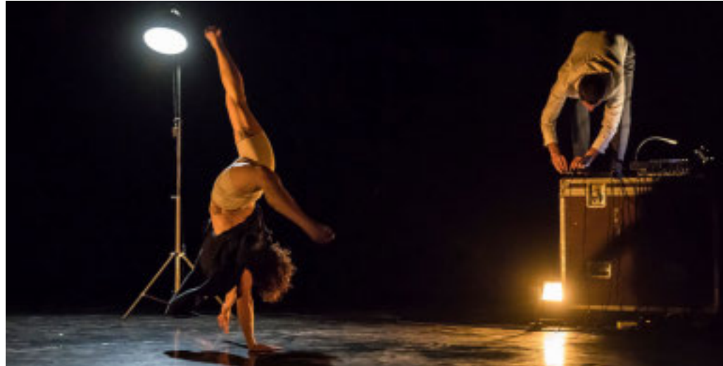
Un momento dello spettacolo «Es» della compagnia Kimera

La forza del risultato raggiunto è attestata dai numeri registrati nei resoconti ufficiali tra gennaio 2022 e maggio 2025: 116 rappresentazioni teatrali italiane e straniere per un totale di 7118 spettatori, 1263 giornate di attività - tra spettacoli, concerti e film, ospitalità a Festival ed eventi, residenze artistiche, progetti in collaborazione con le scuole e le associazioni del territorio, laboratori di circo e teatro, affitti, conferenze, mostre e